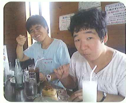
▲おいしくてニコリッ

8月6日(金)、男性利用者さん6名で、喫茶外出に出かけました。お店の「シユプール」は近所ということもあり、メニュー表を見て、ケーキなど、食べたいものを選び、ゆっくり楽しむことができました。