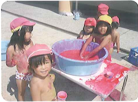
▲何色に変身するのかな？

少しずつ子どもたちの思いやりも芽生え、年中・年長組の子どもたちは自分より小さな子の面倒をみることで自信がつき、年少組は頼れるお兄さんお姉さんのことが大好きになりました。