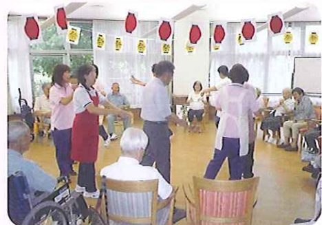
▲「炭坑節」で踊りました

その日から、ヘルパーとしてお世話をさせていただきます。食事を摂ってもらうことと、栄養を摂ってもらうことを心がけました。今では見違えるようにお元気になられ、あらためて食べることの大切さを痛感させられました。