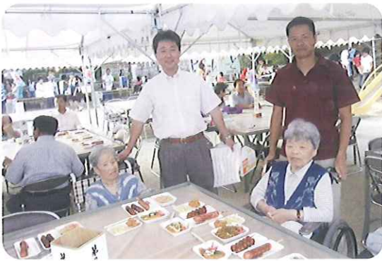
▶楽しい雰囲気でした