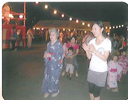
▶みなさん、とても楽しそうに踊っています