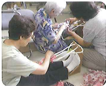
結構、千カラがいります

手作り作品の販売で、大人気の布草履。 作り方が難しく、以前は断念する結果となりましたが、今回、他の方から作りたいたいと申し出があり、再度作り方を教えていただくことに。説明を聞きながら一緒に作り、1時間もするとみなさん形も上手にそろい、でき上がり。 「生まれて初めて作った。」と楽しそうに作っていらっしやいました。