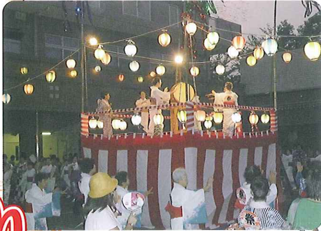
▲すてきな踊りを披露