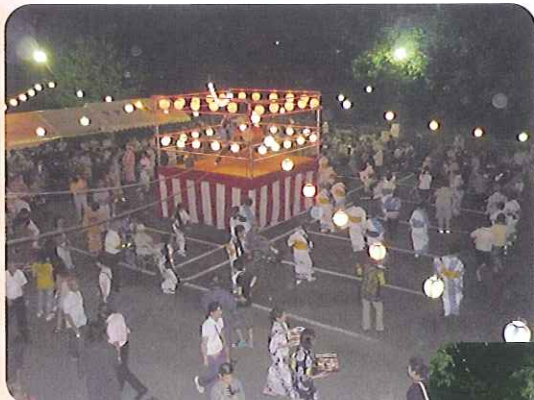
▲たくさんの人で盛り上がりました