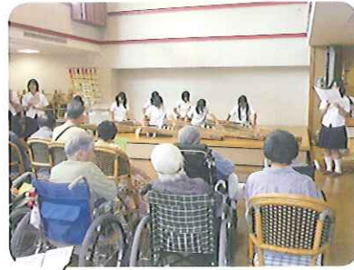
昔なつかしい曲目でいい演奏だったよ!!

8月23日(月)、豊田高校箏曲部のみなさんによる演奏会が行われました。毎年恒例の演奏会ですが、今回は合唱部と合同でさらに迫力アップ。 一生懸命演奏する高校生に、手拍子で応える利用者さんも多く、会場がひとつになった演奏会でした。