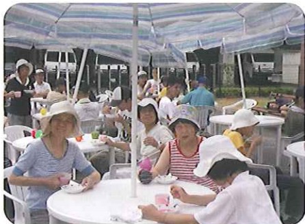
▲ひんやりかき氷で暑さも忘れちゃった☆

8月15日(日)、お楽しみ会を行いました。お楽しみ会では、花火を手に持ち、声を出して楽しむ方、すぐに紙漕りが切れてしまい、「また切れた！」と言いつつも、取れるまで真剣に水風船釣りをする方、いろいろな姿が見られ、それぞれに楽しんでいました。特にかき氷は、自分の好きな味を選び、「おいしいね。」「冷たいね。」と、とてもうれしそうに食べていました。