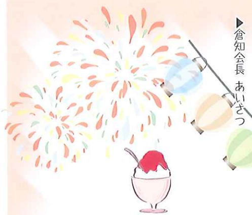
▶倉知会長 あいさつ

高橋地区民生委員 様 東山自治区 様 梅坪民謡クラブ 様 いきいき民謡 様 早川流やくら太鼓 様