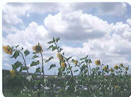
▲デイサービス裏にたくさんのひまわりが咲きました