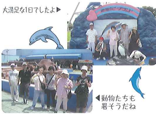
大満足な1日でしたよ