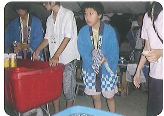
「いらっしゃいませ。おいしいよ！」