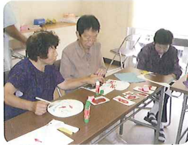
手作りうちわをつくり夏を乗り切りましょう

7月30日(金)、野見区民会館にて、地域ふれあいサロン参加者のみなさんと、認知症の予防について勉強会を行いました。