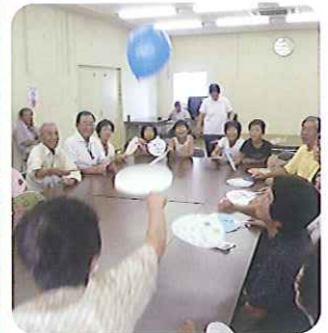
てきたうちわで風せんハレー大会開催 老いも若きも「それ!いいわよ!!」 大盛況でした