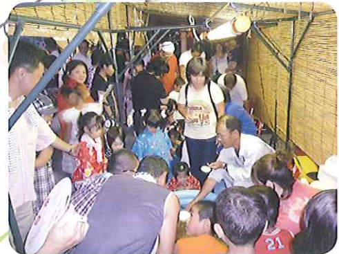
▲たくさんの方でにぎわっています。

各施設で夏祭りが開催されました。さんの輪が広がり、夏祭りムード満行列ができ、地域の皆様、ボランティアしていただきました。