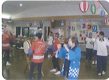
▲輪になって踊りました

8月3日(火)から8日(日)までの6日間、夏祭りを開催いたしました。日替わりで、ボランテアの踊り子さんに来ていただき、利用者さんや職員、中学生のボランテアと一緒に踊っていただきました。また、輪投げや水風船釣りをを行い、みなさん童心に帰り、とても懐かしそうでした。踊った後は、特製のかき氷に舌鼓を打ち、あふれんばかりの笑顔で夏祭りを楽しませていました。