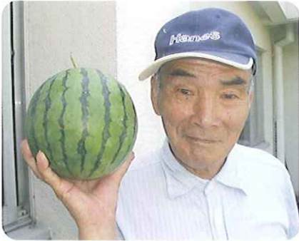
▲自慢の立派なスイカです

夕涼み会では、「炭坑節」これから音頭などを踊りました。先日の盆踊り大会で披露した踊りを踊っている利用者さんも多くいらっしゃいました。踊りのあとに花火を打ち上げ、利用者さんはベンチに座ってお菓子と