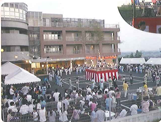
▲700名を超え盛大に行われました