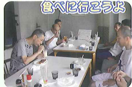
▲みんな食べてると楽しいね

8月6日(金)、男性利用者さん6名で、喫茶外出に出かけました。お店の「シユプール」は近所ということもあり、メニュー表を見て、ケーキなど、食べたいものを選び、ゆっくり楽しむことができました。