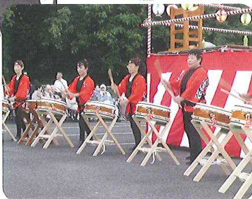
▲早川流やくら太鼓のみなさんです