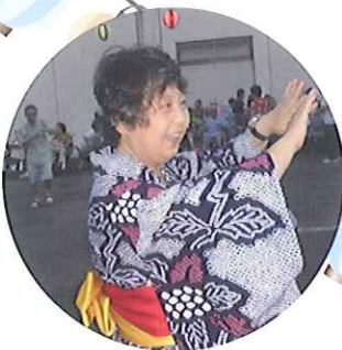
◀すてきな笑顔です