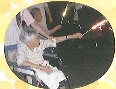
▲ちょっとこわいけど... きれいだね