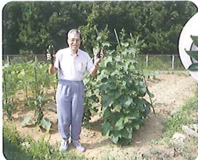
▲とよた苑の畑で夏野菜をつくりました