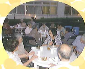
▼92名が参加されました