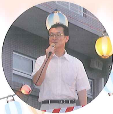
▶春日井市長 伊藤太様 あいさつ