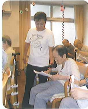
▶また、せひまてくたさいね！