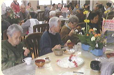
▲甘いものは別腹♡お血がすっかりきれいです

11月26日(金)、「ケアハウス豊田」恒例の「収穫祭」を行いました。ケアハウスの畑で収穫した作物を使ったおやつでティータイム。クラブ活動の発表、展示も行いました。