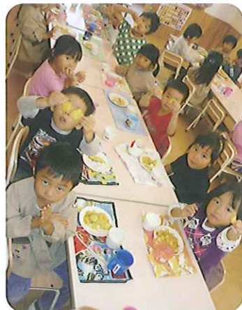
▲「いっただっきま〜す!」