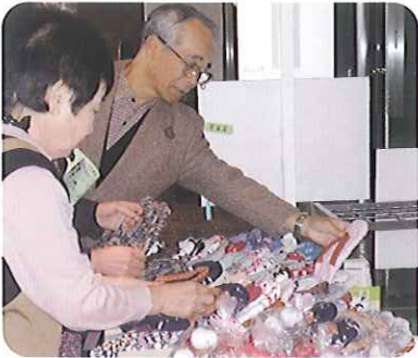
▲なかなかいい作品ですね

11月14日(日)、「豊田市福祉健康フェスティバル」に参加しました。日々一つひとつ丁寧な心を込めて作り上げた作品とあって、販売にも熱が入ります。多くの方に手にとっていただき、感謝の気持ちでいっぱいです。