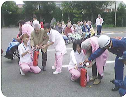
▲「消火器の使い方をしっかり覚えなければ」