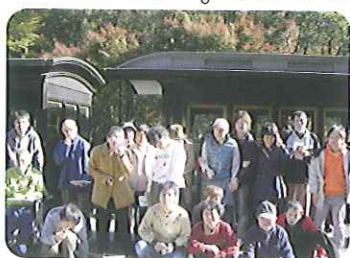
▶明治へタイムスリップ!!

11月18日(木)、紙すき班のメンバーで『明治村』へ行ってきました。到着してすぐにSLを見ると、「乗っていいの!」「早く乗りたい。」などの声がありました。聞こえてきました。窓からは明治の建物ときれいな紅葉が見えました。お