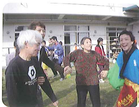
▶上手に踊れているかな?

11月7日(日)、『無門学園』の「むもん祭」に参加してきました。「長巻き」作りを見学し、「どれだけのお米使うんだろ」と不思議そうに作っているのを見ていました。他にも「模擬店」で食事を楽しんだり、「もち投げ」や「よさこい踊り」に参加したりと、他施設の方たちとの交流もすることができました。「また来年も来ようね。」と利用者さんは言うっており、大満足の外になりました。