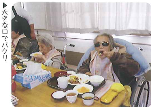
▶大きな口でパクリ