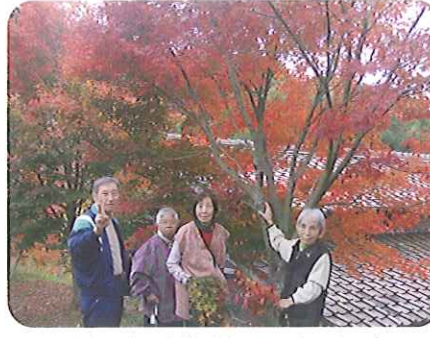
▲今年も真っ赤です😊来年はどうだろう?楽しみ!

日頃からお世話になっている「豊田市健康福祉部」の方々の協力のもと、「健康チェック」、「脳トレ」、「筋トレ体験コーナー」を開催しました。すばらしい秋空の下、多数の参加があり、地域の方々に「包括支援センター」を紹介するいい機会になりました。