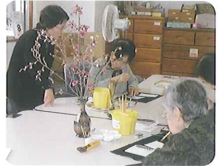
▲世界に一つしかない素敵な作品を作ります