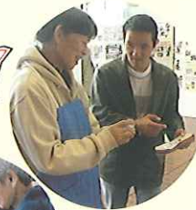
▲ガンパッテ売ったよ!