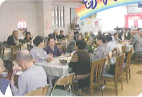
▶25名のボランティアさんが参加してくださいました