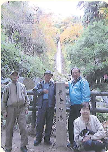
▲念願の滝を拝観。疲れも吹き飛んだ!

11月24日(水)、暖かい天候に恵まれ、5名で「養老の滝」へ行ってきました。セツクたからと、健康が自慢のみなさんで思い切つて滝を見に行くことに。途中何度か休み、ようやく会えた滝に思わず笑み。延命水もたつぷりいただき、身も心も生き返りました。