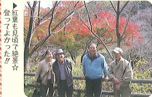
▶紅葉も見頃で絶景☆登ってよかった!!