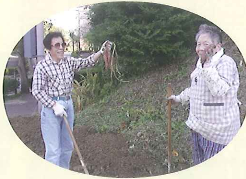
▶私の顔とどっちが大きい!?

11月5日(金)、さつまいも掘りを行いました。今年には猛暑だったせいか、いもの育ちが悪く、最大のもので800gほどでした。しかし掘っていくとかわい小さいものが顔を出し、総重量は45kg。早速いもきりにして、天日干し。食べるのが楽しみです。