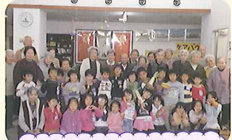
名古屋柳城短期大学附属豊田幼稚園の園児さんが収穫祭の野菜を持ってきてくれました。