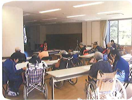
▲詩吟クラブにも参加