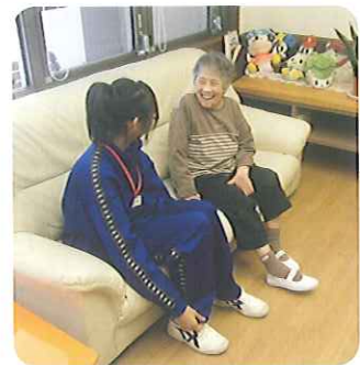
▲利用者さんも笑顔

少し驚かれる利用者さんもうらっしゃいましたが、珍しそうに話をされていました。ご家族はロボットを動かす操作が「ゲームみたいで面白かった。」と楽しまれたようです。今後、改良されて、もっと素晴らしいロボットができることを期待しています。