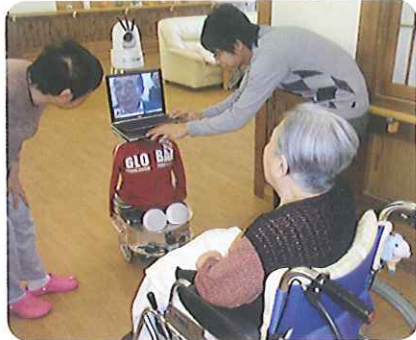
▲モニター越しに会話しています

11月18日(木)、19日(金)の2日間、松平中学校2年生の生徒さん4名が、「職場体験学習」のため来苑されました。最初は緊張した様子もみられましたが、利用者さんと会話をしたり、掃除のお手伝いをしたりと積極的に活動をしていく