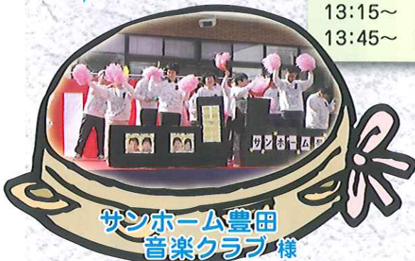
サンホーム豊田音楽クラブ様