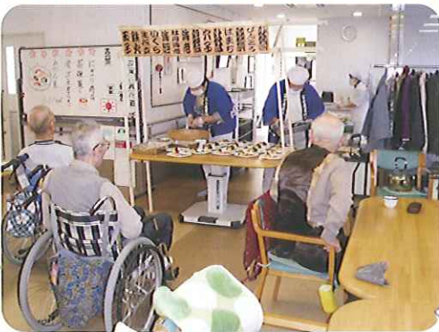
▶「へい、いらっしやい! 何にしましょ!」