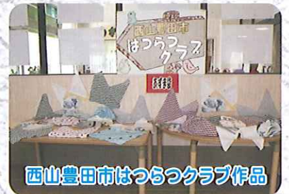
西山豊田市はつらつクラブ作品