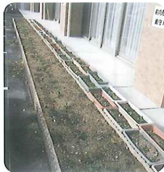
▲日当たりもよく大きく育ちそうです

11月17日(水)、春日井市の花いっぱいのもちづくり活動による「パンジー」と「デージー」の苗をいただき、「チューリップ球根」と一緒に植えました。建物の改築により新しく花壇も増え、春にはきれいな花を咲かせてくれることでしょう。暖かくなって利用者さんと散歩に行きながら眺めるのを楽しみにしています。