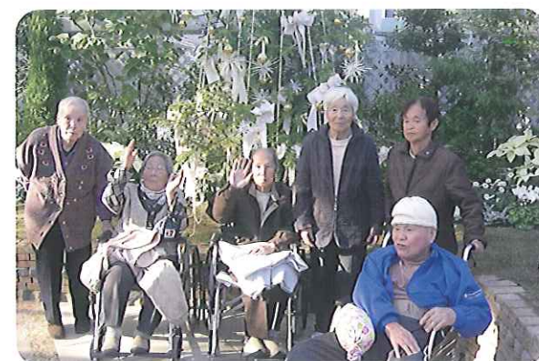
◀みなさんで記念撮影

デイサービス 散歩に行きました 11月5日(金) から11月30日(火)までの間、近郊の「春日井市都市緑化植物園」へ散歩に行きました。午後のレクリエーションの時間を利用して、4名から5名の小グループで散歩による機能訓練や、外出することによって紅葉などの季節感を味わい、気分爽快、リフレッシュしていただきました。