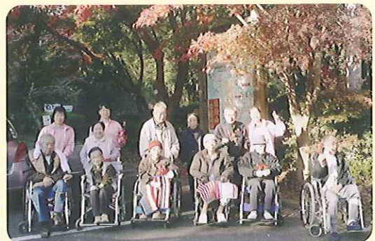
▲きれいな紅葉の前で記念撮影

利用者さんからも、「きれいだったね。」と好評で、赤い紅葉の落ち葉をお土産に持って帰ってきてくださいました。また、来年も一緒に見に行きましよう。