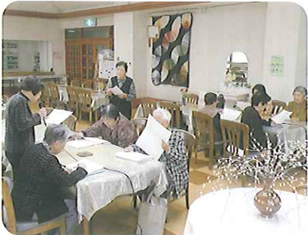
▲熱心に取り組んでいます

「ケアハウス豊田」では毎日たくさんボランティアさんが来てくださっています。クラブ活動では現在11クラブあり、それぞれ熱心に指導してくださり、みなさん今回の収穫祭、記念祭、作品展などを目標に頑張っています。趣味を持って活動することが、いきいきとした生活につながっています。