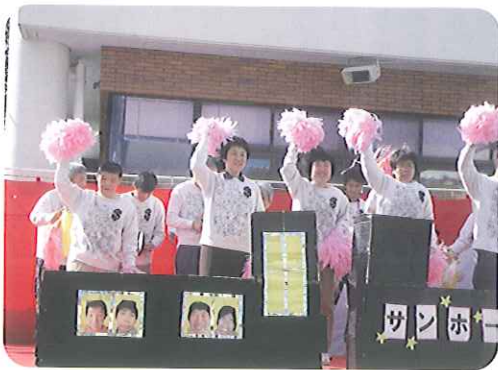
私たちの歌声 みんなの心に届け

発表の前には「模擬店」でおいしい物をたくさん食べた。他団体の発表を見ながら踊ったり楽しく過ごしました。「サンホーム豊田」の発表になり、緊張した様子でステージに上がりましたが、歌い始めると大きな声で歌い、元気に踊ることができました。発表が終わると、「楽しかった。」「頑張ったよ。」とみんな満足そうでした。