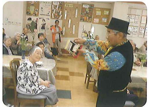
◀マジックショーです

「ケアハウス豊田」では毎日たくさんボランティアさんが来てくださっています。クラブ活動では現在11クラブあり、それぞれ熱心に指導してくださり、みなさん今回の収穫祭、記念祭、作品展などを目標に頑張っています。趣味を持って活動することが、いきいきとした生活につながっています。