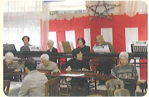
▲大正琴クラブ、キーボードクラブ初めて一緒に発表しました