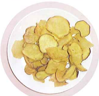
▲おいそうなさつまいもチップス