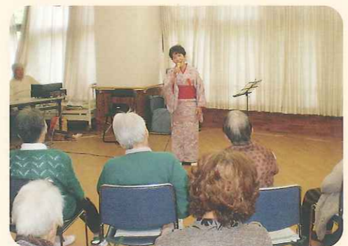
いながら季節の和菓子を楽しむことができました。

端午の節句にちなんで、「菖蒲湯」を楽しみました。利用者さんから「バラバラにしちやダメなのよ。」と「菖蒲」を輪ゴムでまとめてくださり、「菖蒲」についていろいろと教えていただきました。 また、レクリエーションでは、慰問で来ていただいた方の踊りを見たり、端午についての連想ゲームなどを行ったりとそれぞれに楽しみました。おやつの中には、かしわ餅を食べ、「おいしい。」と言