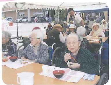
▲「外でいただく食事もいいね!」と好評でした