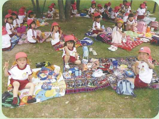
お外で食べるの美味しい!