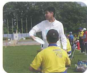
▲上手にできるかな?