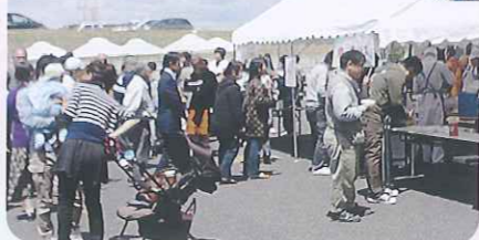
▲多くの人に参加していただきました