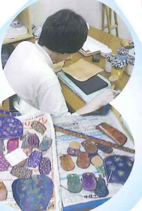
記念祭の作品を作っている利用者さん