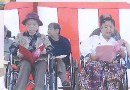
▲詩吟クラブ発表 大きな声で吟じました