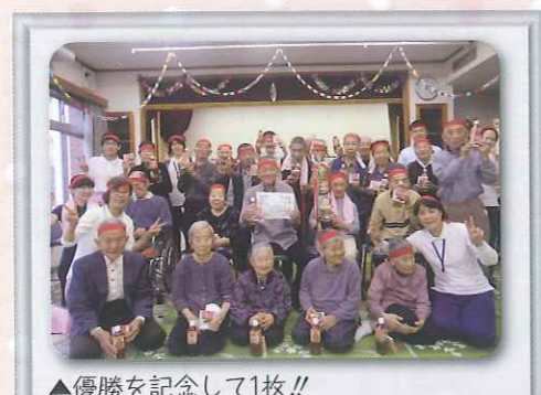
▲優勝を記念して1枚!!

して「けやきワークス」に行ってきました。おいしそうにたくさん並んだ手作りのパンを目の当りにして「どれにしようか迷うなあ。」「私はこれを食べようかな」とうれしそうに食べていました。