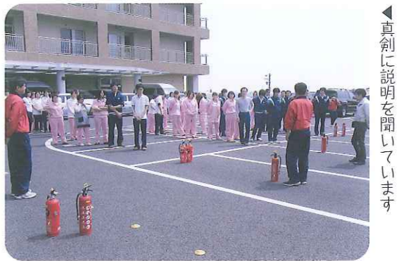
▲真剣に説明を聞いています

5月25日(水)、全職員を対象にした防災訓練として、「初期消火訓練」を行いました。 消防管理業者の方から初期消火の大切さ、消火器の使い方の説明を聞いた後、実際に水の出る消火器を使い、訓練を行いました。 火災も含め、災害はいつ起こるか分からないものです。「いざ」という時に的確に動くことができなければ、訓練中強く感じました。