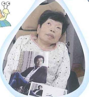
御園座に行きました。