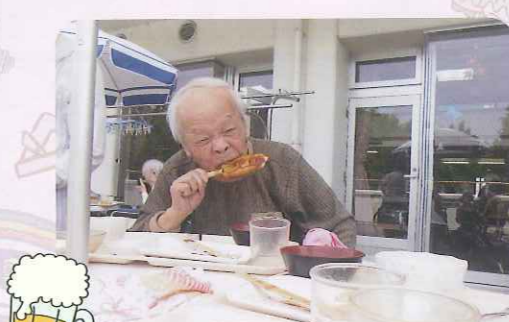
▲どんどんいっちゃうよ!!

れる方、味噌が口の周りにつくのも気にせずがぶりついて食べられる方など、それぞれの楽しみ方で五平餅を味わっていました。