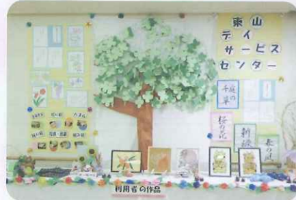
▲すてきな作品ばかりです