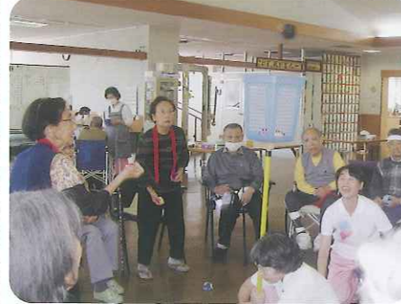
みなさん、勝利のために真剣です

午後の時間、様々なレクリエーションを行っています。玉入れ・ゲーゴルゲーム・ボウリング・スカットボール等々。点数を競うゲームがほとんどです。素晴らしいプレーには拍手が送られ、ゲーム中はみなさん真剣です。