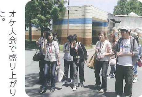
▲しろくま見に行ってきたよ!! 水中ダイブ見れなくてちょっと残念