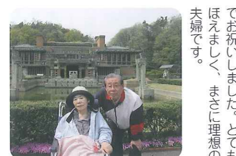
▲結婚50周年、金婚式を迎えられました

▲気分もリフレッシュできました 薫風香る5月10日(火)、明治村に行ってきました。天候にも恵まれ、新緑の木々の下、マイナスイオンをいっぱい浴びながら、色とりどりの花の香りを感じての散歩を楽しみました。そして、この日外出された利用者さんの中に、今年で金婚式を迎えられた方がいらっしゃいました。この日は、ご主人も同行され、ご夫婦で散歩をし、みなさん