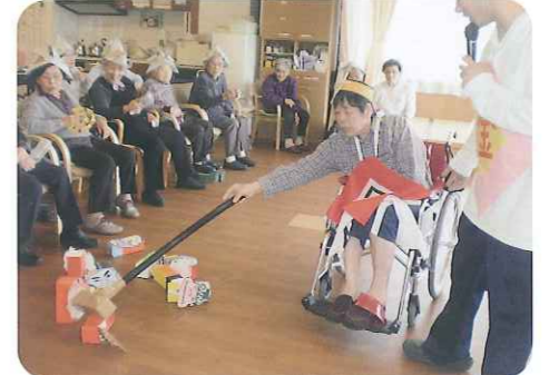
▲鬼をめがけて「エイッ!」と気合が入ります