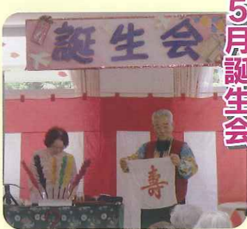
▲すてきなマジックです！

今回は手作り遊びを楽しむ会の方に、本の読み聞かせ、手品、ハーモニカ演奏をしていただきました。手品ではいきなり鳩が飛び出しビックリ。とても楽しい時間を過ごすことができました。