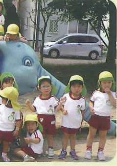
そうさんの前々ハイ、チーズ