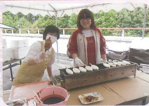
▲今年もおいしく焼きますよ！

端午の節句の日に、「特養」・「デイサービス」・「ケアハウス」でそれぞれベランダにテントを張り、五平餅を焼きました。五平餅を焼いている匂いが施設に広がると、見ていた利用者さんは我慢できずに焼き台の所に行き、味見をしていました。ほかにも、はしで上品に食べられる方、ビールと一緒に楽しま