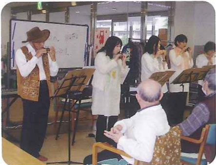
▲心癒される音色です