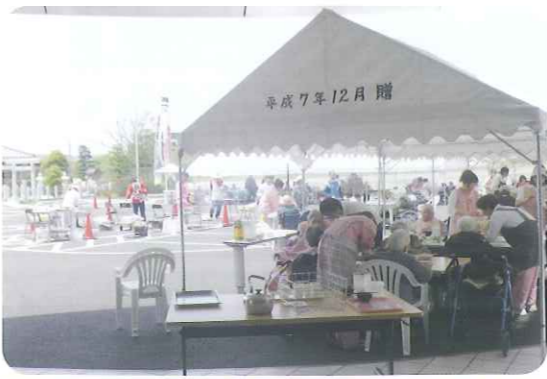
▲気持ちの良い天気でした

晴天に恵まれた5月5日(木)、「端午の節句会」として、野外でバーベキューを行いました。 メニューは、ねぎま、つくねなどの串ものや豆腐田楽、五平餅、豚汁などといった豊富なメニューです。食べ物の焼ける音やにおい、また、野外といういつもと違った雰囲気もあって、利用者さんはいっつもより食が進んでいました。 初めての試みでしたが、「おいしかったよ」、「たくさん食べたよ。」などの声が聞かれました。