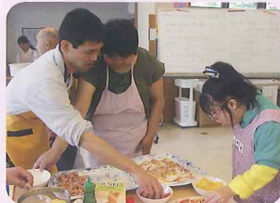
▲早く食べたいなあ