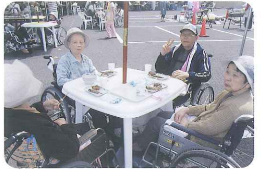
▲パラソルの下でお食事