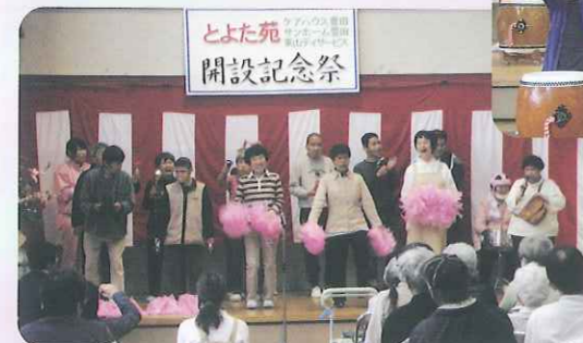
▲サンホーム豊田音楽クラブのすてきな演奏でした