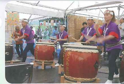
▲すてきな演奏 ありがとうございます みなさん食事を楽しんでます▶