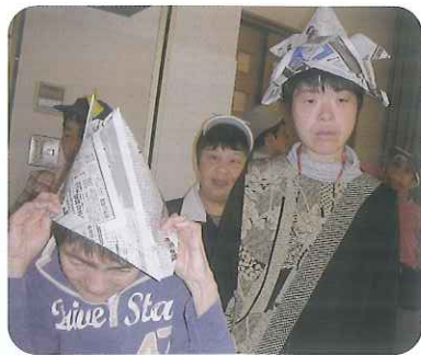
▲かぶと似合うでしょ!!

5月5日(木)、「端午の節句会」を行いました。かぶとの付いた帽子をかぶり、各作業班に分かれて「かぶと取りゲーム」を行いました。みなさん真剣で、白熱した戦いとなり、とても盛り上がりました。優勝は外注班チームでしたが、どのチームもとても一生懸命でした。ゲームの後は、かしわ餅を食べ、菖蒲湯に入り、とても満足そうでした。