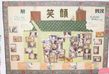
▲展示 ユニット紹介