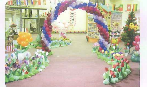
▲春緑苑25周年 歩んできた道のりです