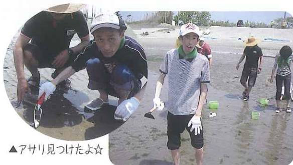
▲アサリ見つけたよ☆

5月21日(土)、豊田市運動公園で行われた「県の障がい者スポーツ大会」に参加しました。「サンホーム」で2月に予選会を行い、4月から練習を重ね本番に臨みました。競技中に緊張している利用者さんもありましたが、元氣よくプレーすることができました。結果は、アキュラシュー5は2位、アキュラシュー7