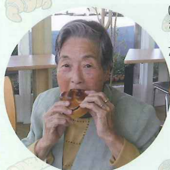
▲おいしいパンだね!!

して「けやきワークス」に行ってきました。おいしそうにたくさん並んだ手作りのパンを目の当りにして「どれにしようか迷うなあ。」「私はこれを食べようかな」とうれしそうに食べていました。