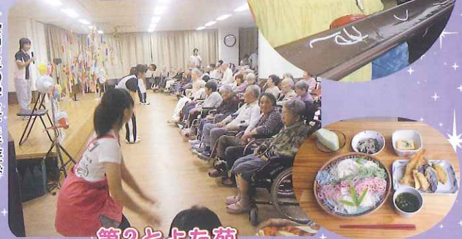
▶実習生の学生と手遊び