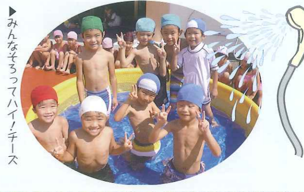
▶みんなそろってハイチーズ

楽しむ子など様々ですが、夏ならではの遊びを思いっきり楽しめるようにしていきます。