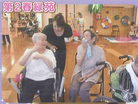
▶いつも楽しそうです!!