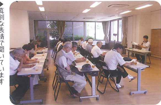
▶真剣な表情で聞いています

とよた宮が建立され2年がたちました。毎月2回行っている月例祭を楽しみにしている利用者さんも多く、これからも、とよた宮が利用者さんの心のよりどころになるよう、願っています。