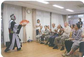
▲とてもすてきな演奏でした

7月6日(水)、7日(木)の2日間、「七夕会」を行いました。一令会の民謡演奏や日舞付きの歌謡ショーは大盛況で、利用者さんに楽しんでいただきました。