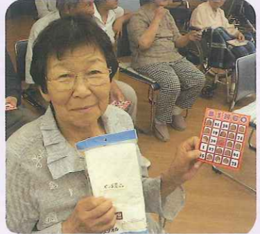
▲景品をもらってニコリ!!