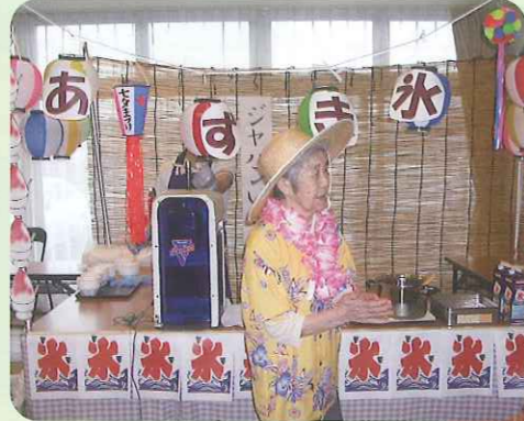
▲あずき水はいかがですか?