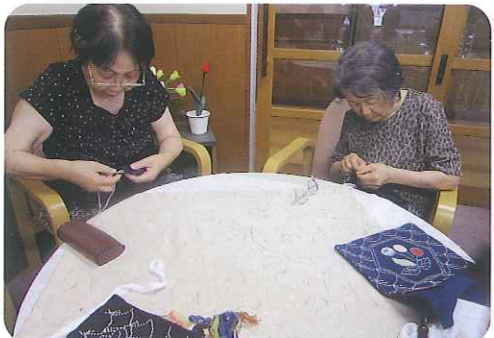
▲一生懸命作られています

7月より、毎週日曜日に刺し子刺しゅうを行い、会話を楽しくしながら作品を作っており、手作り作品は、10月に行われる