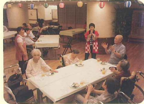
▲音楽にのって手拍子。楽しいですね!!

楽しい夏の夜でした。8月は、屋上でビアガーデンを計画しておりますので、お楽しみに。