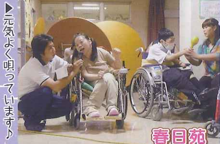
▶元気よく唄っています!!