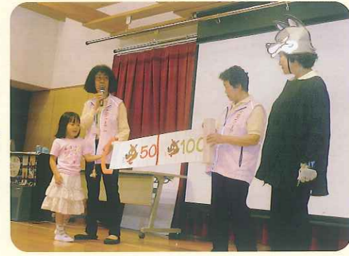
▲どのくらい離れたら大丈夫?