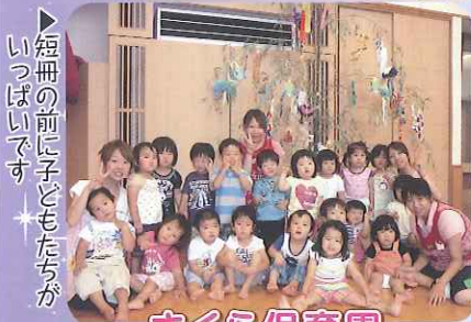
▶短冊の前に子どもたちがいっぱいです

7月初旬、春日井・豊田グループ各施設で七夕会を開催しました。様々な演芸会や慰問があり、みなさん大いに楽しみました。