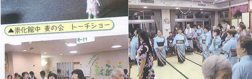
▲「これから音頭」の始まりです