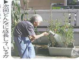
▲今回どんなに頑張りましたか