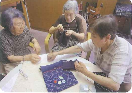
▶みなさん、とても仲が良かったです