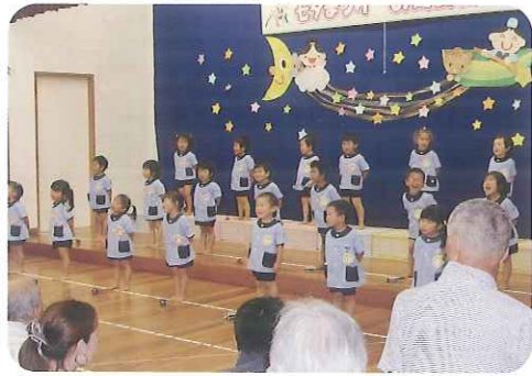
▲かわいい子どもたちに癒されます!!

6月30日(木)、神屋保育園の「七夕まつりお遊戯会」に、特養利用者6名、職員3名、合計9名で参加してきました。子どもたちが一生懸命お遊戯をしている姿を見て、みなさんとても感動され、にこにこしながら見ていらっしやいました。子どもたちが、たくさん練習して頑張った姿を想像するとほほえましくなります。保育園からの帰り道「楽しかったわぁ」とにこにこ顔だった利用者さんが印象的でした。