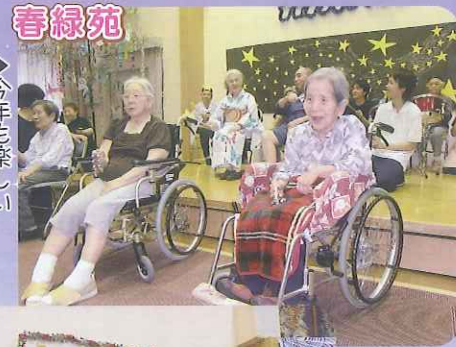
▶今年も楽しい七夕会になりました