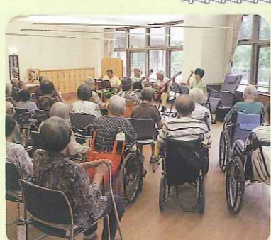
▲すてきな音色が響いています

7月21日(木)、マンドリンサークルの「けやき」が来てくださいました。「みかんの花咲く丘」や「青い山脈」など、懐かしい歌をすてきな演奏と一緒に楽しみました。利用者さんからは「楽しかった」、「た