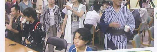
▲室内でもにぎわっています

日時：平成23年7月27日(水) 18:30~20:20 ※雨天決行 場所：養護老人ホーム若草苑 グラウンド