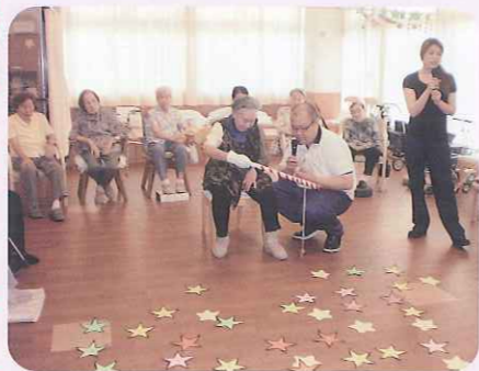
▲たくさん星を獲りました

7月6日(水)、7日(木)と2日間「七夕会」を行いました。利用者さんに、短い職員の手紙で大盛り上がり、事を書いていただき飾り付けをしました。職員が織姫、彦星に扮し劇をしたり、歌を歌ったり、短冊に願い