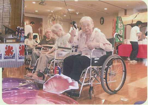
▲こんなに大きな魚が釣れました