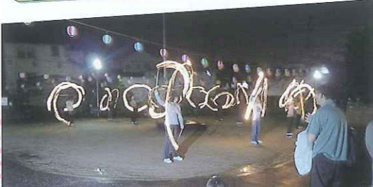
▲崇化館中 麦の会 トーチショー

7月27日(水)、盆踊り大会を開催しました。天候不良により急ぎよ室内に変更して行いましたが、400名近くの方に参加していただきました。地域の方々ボランティアの方々に協力いただき、室内でも大いに盛り上がりました。ありがとうございました。