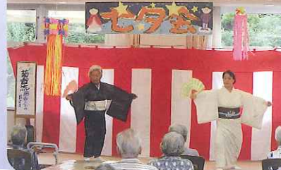
▲すてきな踊りを見ることができました