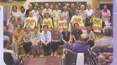
▲K.JB37 (ケージービーサーティーセブン) 大盛り上がりでした!!