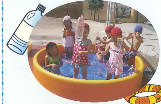
▲手作りおもちゃ楽しいよ!

待ちに待った夏がやってきました。さくら保育園では、プール遊びを楽しみ子どもたちの声がにぎやかに聞こえてきます。ペットボトルなどを利用して保育士が作ったおもちゃは、どれもかわいく子どもたちに大人気です。また、幼児組はみんなで協力していろいろなおもちゃを作りました。水のかけ合いをしたり、足をばたばたして遊ぶ子、おもちゃのシャワーを浴び、かけ回って