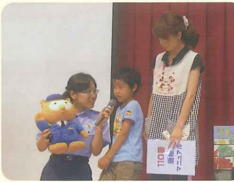
▲どうしたらいいのかな?

6月23日(木)、園児の防犯意識を高めることを目的に、市内で安全啓発活動を実施している女性フォーラム実行委員会の方と春日井市警察署の方をお招きしました。防犯に関するクイズや紙芝居、園児や保育士が参加しての寸劇などを通して、子どもたちは「こわい目に遭った時どうし