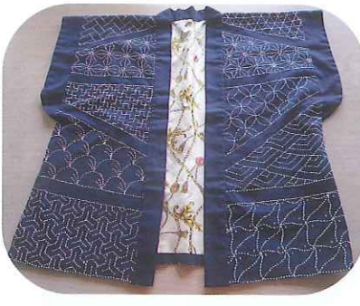
▲素晴らしいはんてん作品です

7月より、毎週日曜日に刺し子刺しゅうを行い、会話を楽しくしながら作品を作っており、手作り作品は、10月に行われる