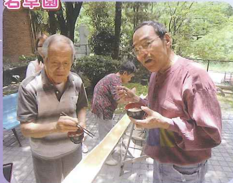
▲やっぱり七夕の日には、流しそうめんにかざるね