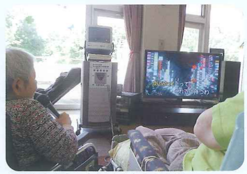
▲見やすくなったね!大きなテレビ!