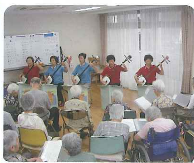
▲7月8日(金)、「認知型後援会家族交流会」を行いました。

7月6日(水)、7日(木)の2日間、「七夕会」を行いました。一令会の民謡演奏や日舞付きの歌謡ショーは大盛況で、利用者さんに楽しんでいただきました。