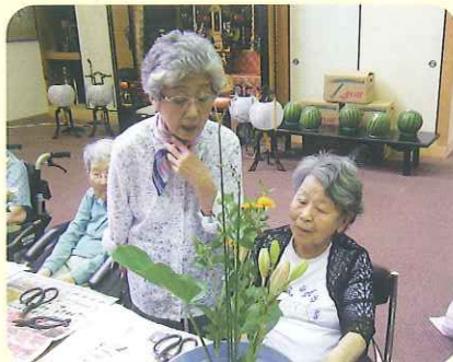
先生、お願いします

各施設では、様々なクラブ活動を実施しています。今回は、春緑苑・とよた苑のクラブ活動の様子をご紹介します。