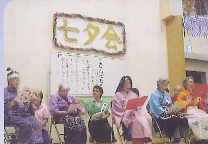
グループホーム春緑苑