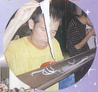
▶上手にとれました