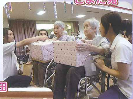
▲七夕会を盛り上げてくれた子どもたちに利用者さんからお菓子のプレゼント!!