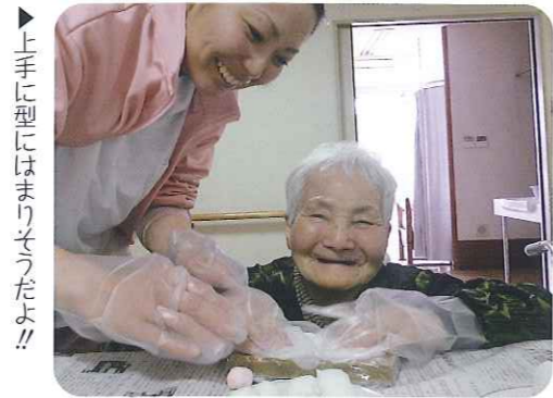
▲上手に型にはまりそうだよ!!