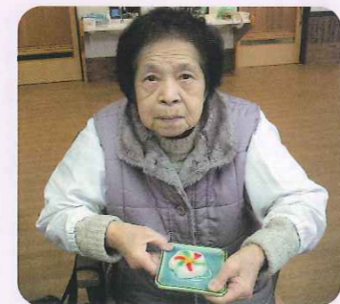
▲上手にできました

ひな祭り会 デイサービス 2月26日(木)から3月3日(日)までの1週間「ひな祭り会」を行いました。 「ひな祭り会」では季節のおやつとして、苺のホットケーキとおこしものを作りました。 おこしものは西三河地方では豊田地域独特の和菓子です。米粉に赤や黄、緑の色をつけ、梅や鯛の型にはめ、蒸し上げました。蒸し上がったおこしものを見て「昔よく作ったわねえ。」と利用者さんは大喜びでした。できたてに砂糖醤油をつけ、3時のおやつ時間にみなさんでおいしくいただきました。