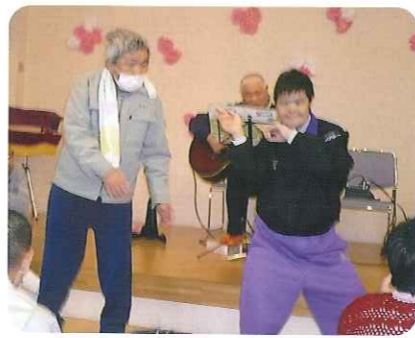
▲ギターと一緒にダンス♪

何ができるかな? をやっていただきました。ギターの音色に合わせ「うれしいひな祭り」や「あの素晴らしい愛をもう一度」などを歌いました。手品では、秘密を探ろうと利用者さんはじっと見つめていました。