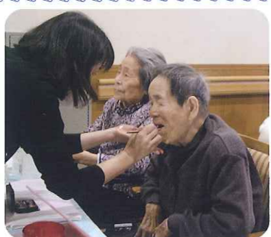
▲口紅を塗っていただきました

3月14日(水)、ポーラ化粧品さんによる化粧ボランティアが行われました。手のマッサージを始め、口紅を塗っていたりなど初めは恥ずかしがっていた利用者さんも、次第に表情も緩み、笑みがこぼれていました。お化粧後、鏡を見てびっくりされているものの、うれしそうなお表情をされていました。利用者さんにとって大満足な日となりました。ポーラ化粧品さんありがとうございました。