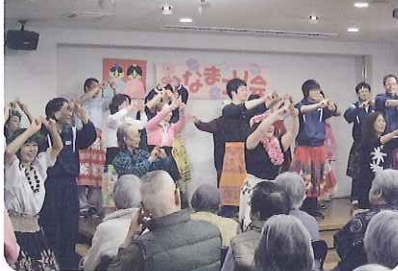
▲にぎやかなひな祭り会となりました