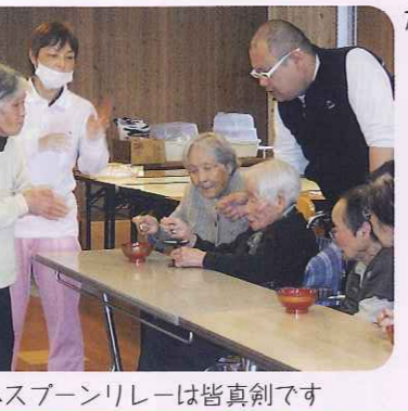
▲スプーンリレーは皆真剣です