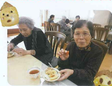
▲おいしくいただいています

太鼓 2月26日(日)から3月3日(土)までの1週間「ひな祭り」を行い、たくさんの方が慰問に来てくれました。 「早川流」の方々による太鼓演奏は、とても力強く身体のあるまじりびれるような迫力のある音でした。 太鼓の演奏の後は、全員で太鼓に挑戦しました。リズムに乗りにながら楽しそうに太鼓を叩いていました。利用者さんが元気にも元気がわいてきました。