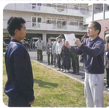
▲いつもありがとうございます

3月14日といえばホワイトデー。前日の3月13日(水)、バレンタインのお返しに、料理クラブの男性利用者さん3名が、チョコチップと紅茶の手作りクッキーを作りました。