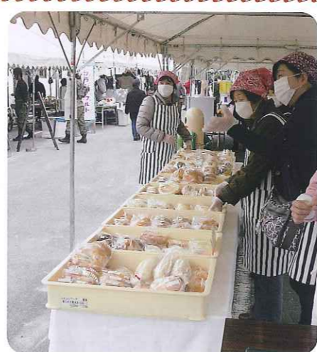
▲パンがスラリと並んでいます!!

昼にはパンが完売し、その後雨に降りましたが、自衛隊の隊員は雨にも負けず、大声で呼び込みを続け、模擬店は大繁盛でした。