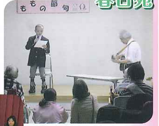
▲施設長の演奏で 歌を披露