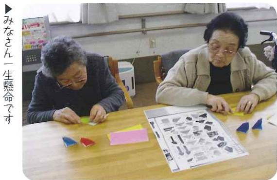
▶みなさん一生懸命です