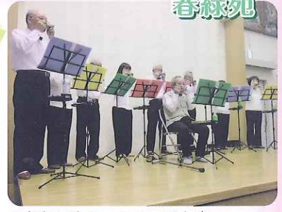
▲きれいなハーモニーでした