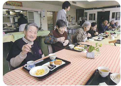
▲わたしのおすすめです!!