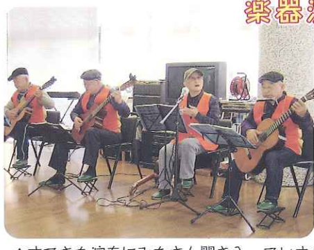
▲すてきな演奏にみなさん聞き入っていました▼