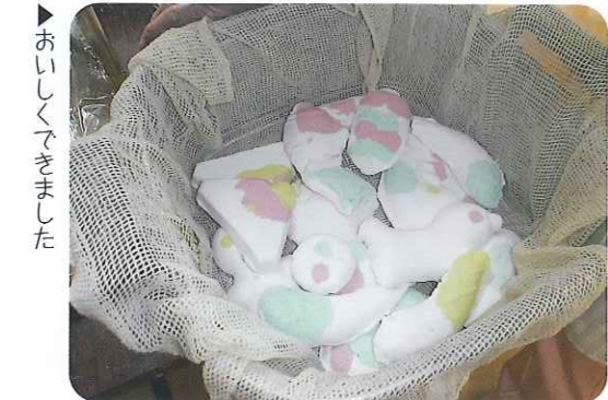
▲おいしくできました

そうじ粉をこね、いろいろな型にはめて形がで上がりしました。あとは蒸して焼いたおこしものを食べ、みなさん楽しいひと時を過ごされました。