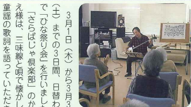
▲すばらしい三味線でした