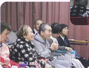
▲みなさん楽しそうです!!