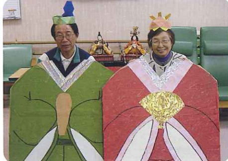
▲すてきな雛様です

3月2日(金)に、1日早い「ひな祭り会」を行いました。利用者さんには、すまし顔でお雛様とお内裏様になっていただき、写真撮影をしました。 春にちなんで紅白だんごを作り、みなさんでいただきました。利用者さんから「やわらかくておいしかった」、「また食べたい。」という声が聞こえてきました。 利用者さんのすてきな雛様とお内裏様で、「ひな祭り会」を大成功で終わることができました。