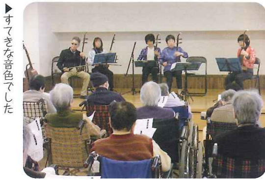
▶すてきな音色でした

春分の目コンサート 3月20日(火)、二胡演奏グループ「楽楽団(ラー・ユエ・トゥアン)」の皆様が来苑され、演奏会が催されました。 二胡とは中国の弦楽器で初めて見る利用者さんも多く、とても繊細できれいな音色でした。 曲目は「春の小川」、「見上げごらん夜の星を」、「ふるさと」など利用者さんにもなじみの曲が多く、曲に合わせ口ずさんだり、思い思いに春の演奏会を楽しんでいる様子でした。