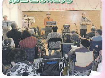
▲すばらしい演奏でした