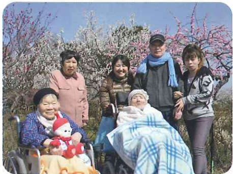
▲天気もよく、気持ちのよい一日でした

3月上旬から中旬にかけ、各ユニットごとで近所の梅林公園に梅の花を見に出かけました。今年は寒さの影響で開花が遅れていましたが、紅白に咲いた花を見て利用者さんたちは「きれいだね」、「春だね。」などとおっしゃっていました。