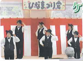
▲演芸会は 大盛り上がり!!