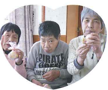
▲わーい! おいしいそう♡