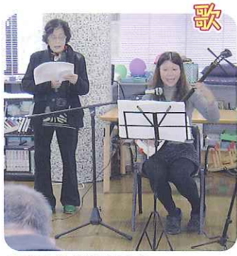
▲すてきな歌声です

毎月たくさんさんのボランティアさんが来てくださいます。体操、踊り、歌、手品、楽器演奏など、利用者のみなさんは、「今日は誰が来てくれるのだろうか。」と毎回楽しみにされています。ボランティアのみなさんお一人おひとりのご協力によって、利用者さんは楽しいひとときを過ごされています。本当にありがとうございます。