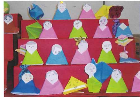
▲ひな壇にきれいに飾られました