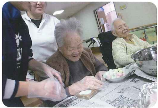
▲型にはめるのがうまくできるかな〜!?

ひなまつりに向けて、特養ケアハウス豊田でおこしもの作りを行いました。みなさん楽しんで