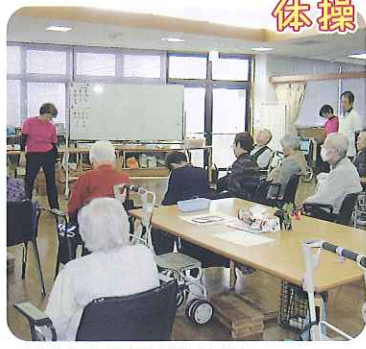
▲どんな体操だろう？