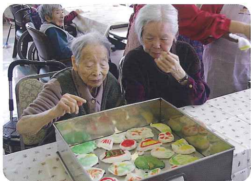
どれにしようかな？

3月4日(日)、坂下公民館まつりの演芸発表会に特養・ケアハウス・グループホーム春緑苑利用者さん13名が参加しました。 「春の小川」と「真つ赤な太陽」の2曲を披露し、会場のみならずも一緒に口ずさんでおりました。本番前は、緊張でいっぱいだった様子が伺えましたが、本番では練習の成果を十分に発揮することができました。交流の輪も広がり、他の演芸発表を見たりと楽しい時間を過ごしました。