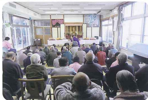
▲先亡者90名の冥福を祈りました

3月13日(火)に彼岸法要を行いました。いつもお世話になっている住職に来ていただき、苑で亡くなった利用者さんの供養をしていただきました。