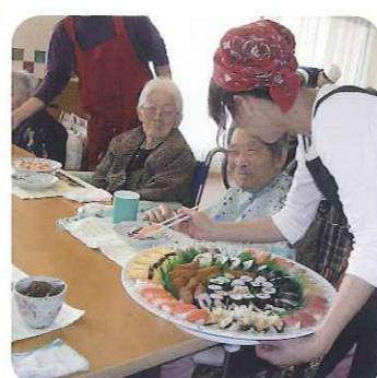
▲大きなお皿を目の前に、とても笑顔です

職員リレー随想 片づけ術 最近「片づけ術」の本がいろいろと出ていますが、私も二度と散らからない「片づけ」に挑戦しています。 物への執着を捨てるということが大切ですが、使っている物と使っていない物に分別したら、なんとガラクダだらけの我が家になってしまいました。自分でもあきれてしまいました。が、同時に、意欲が増してきました。まだ、始めたばかりですが、楽しんで挑んでいます。部屋も心もスッキリして時間にも余裕が出てきました。本によれば人生も変わるそうですよ。