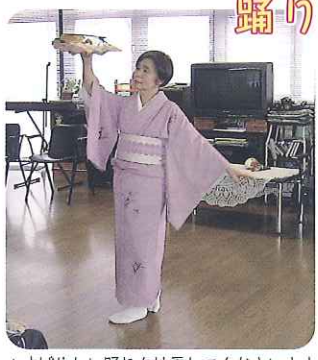
▲すばらしい踊りを披露してくださいませ