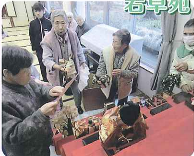
▲準備にみなさん一生懸命です