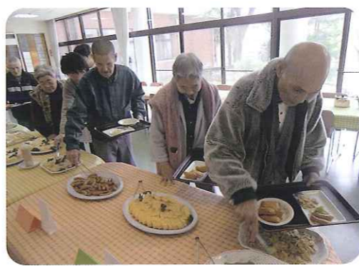
▶何を食べようかな?

3月22日(木)、ランチバイキングを行いました。今回のメニューは助六など全10種類を用意しました。普段のメニューにはないものもあり、「これが食べたかったんだよ。」と大喜びの利用者さんもありました。