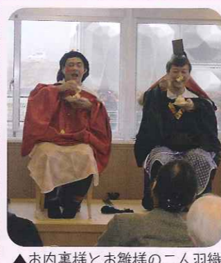
▲お内裏様とお雛様の二人羽織

デイサービス ひな祭り会 3月2日(金)、「ひな祭り会」を行い、男性職員がお内裏様、お雛様、三人官女に仮装しました。 最近「片づけ術」の本がいろいろと出ていますが、私も二度と散らからない「片づけ」に挑戦しています。