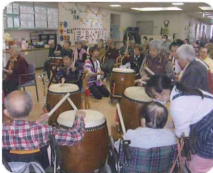
▲みなさん楽しそうです!!