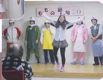
▲ヘタレンジャー 新旧交代のピンチ!?