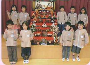
◀かわいいお内裏様と お雛様が いっぱいです