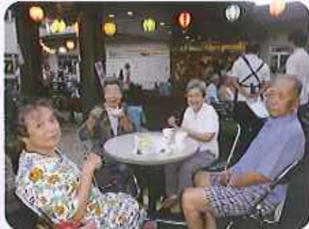
▲食事もおいしいね