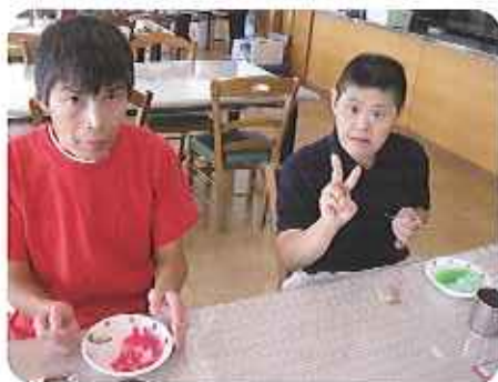
▲また食べたいなあ