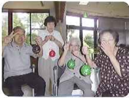
▲お孫さんに良いお土産ができました♪

みなさんは、重心にかえり、笑顔で「ヨーヨー釣り」を楽しんでいました。お孫さんにプレゼントしようと、必死に釣り上げようとしている利用者さんもありました。