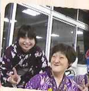
▲春日苑も楽しそうです!!