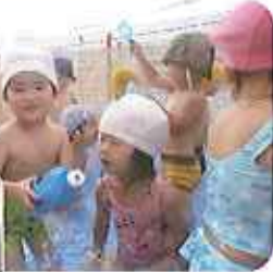
◀0歳児「りす組」水着姿、初デビュー

今年はお天気が良かったため、子どもたちは、たくさん水遊びをすることができ、まっ黒に日焼けし、たくましくなりました。