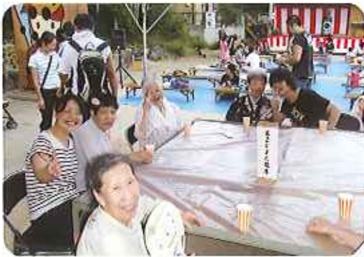
楽しい夏祭りでした