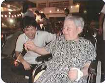
▲お腹一杯になった後は、花火で夏の夜を楽しみました

杯。手作りの梅酒と梅シユースも用意しました。おつまみセツトは、じっくり煮こんだ鶏の甘酢とケアハウス豊田で収穫したじゃがいもを使ってのフライドポテト、枝豆、ねぎまをみなさんに召し上がっていただきました。カラオケも盛り上がり、最後には豪華な花火を見て楽しみました。