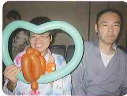
▲浴衣似合うでしょ!!

みなさん、保護者の方やボランティアの方と一緒にやぐらの周りに集まり、楽しそうに「炭坑節」や「東京音頭」、「ダンスングヒーロー」などの盆踊りを踊っていらっしやいました。この日のために練習を重ねてきただけあり、みなさんばっちり決めっていました。