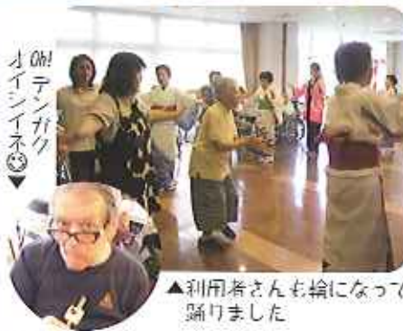
▲利用者さんも輪になって踊りました