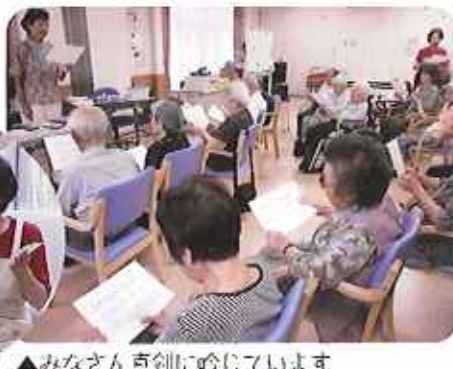
▲みなさん真剣に吟じています