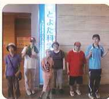
▲みんなで記念写真☆

また、勉強の後は、恐竜の迫力ある映像やオーロラの様子を鑑賞して、息抜きをすることもできました。