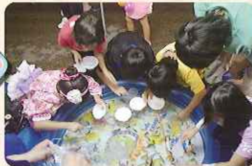
▲金魚すくいに集中している子どもたち

祭りが開催されました。当日、天く の雨になってしまった施設もあ たくさんの踊り子さんの輪が広が りの方やボランティアの方々など になりました。