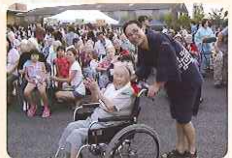
▲夏祭りを満喫しています