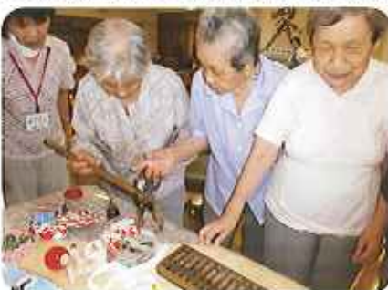
▲昭和21年頃に使用されていた道具を見て、みなさん、昔を思い出されていたのでしょうか?

今回は昭和21年頃の出来事を話題に、みなさん積極的に話をされ、懐かしい歌を唄ったりして講演会に参加していました。「元氣の良い日は、大いに外へ出ましよう!四季の移り変りを肌で感じる」とが元氣の源です。」と、最後にお話され、参考になりました。