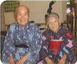
▼夫婦仲良く、決まっています!