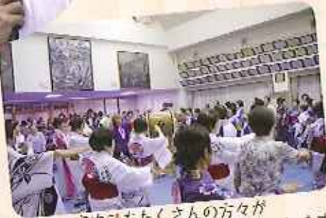
▲室内でもたくさんの方が太鼓のまわりを回って踊っています