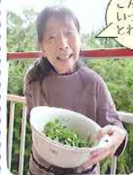
こんなにいっぱいとれましたよ〜

していたたぎ、昼食のデザートに飾りつけをしました。見た目も味も最高のデザートになりました。