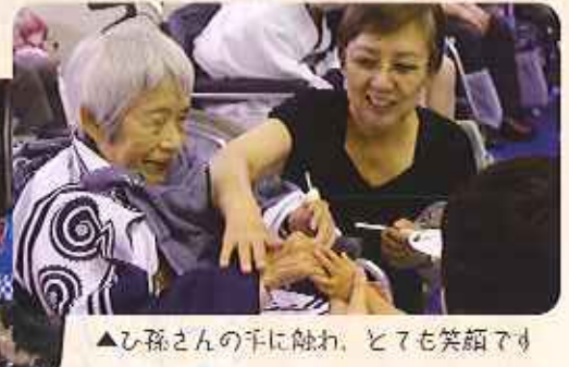
▲ひ孫さんの手に触れ、とても笑顔です