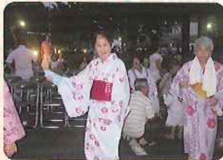
▲すてきな浴衣ですね!!