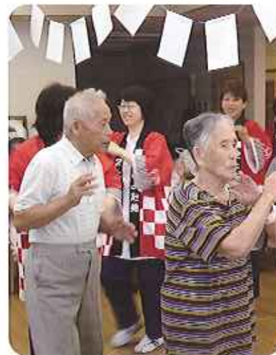
▲盛り上がりがあった盆踊りでした

利用者さんの中には、職員の踊り方を見て、丁寧に踊り方を教えてくださった利用者さんもおりました。和やかな雰囲気の中で、夏祭りが行われていましたが、すいか割りになるとその気配が