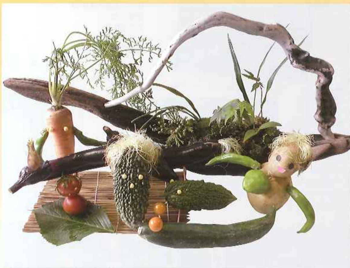
「収穫した自家製野菜の仲間たち」