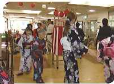
▲みなさん踊りもバッチリ!!

利用者さんは、浴衣を着て、「はずかしいわ。」「浴衣なんて何十年ぶりかしら。」と少し照れていらっしやいましたが、いざ「炭坑節」が流れてくると、活き活きと踊られ、いつもとは違った利用者さんの一面を発見