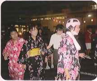
▲上手に踊れたかな？

当日は快晴に恵まれ、絶好のお祭り日和となりました。利用者のみなさんも、朝からとても楽しみにしており、「私はピンクの浴衣を着るんだよ。」と盆踊り、上手に踊れるかな。」と会話に華が咲いていました。