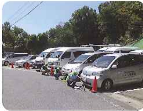
▲暑中、ありがとうございます

春日井東部 地域安全・安心センターの方に、公用車65台、職員の自家用車35台にナンバープレート盗難防止ネジを付けていただきました。