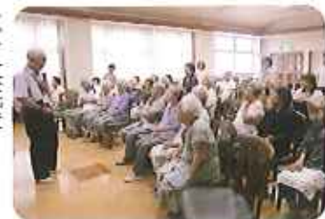
▶どんな話をされたのでしょうか?

今回は昭和21年頃の出来事を話題に、みなさん積極的に話をされ、懐かしい歌を唄ったりして講演会に参加していました。「元氣の良い日は、大いに外へ出ましよう!四季の移り変りを肌で感じる」とが元氣の源です。」と、最後にお話され、参考になりました。