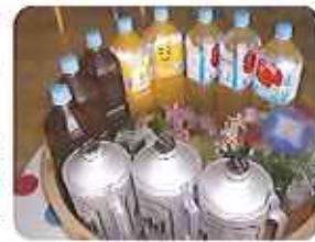
▲ピレシニースマック