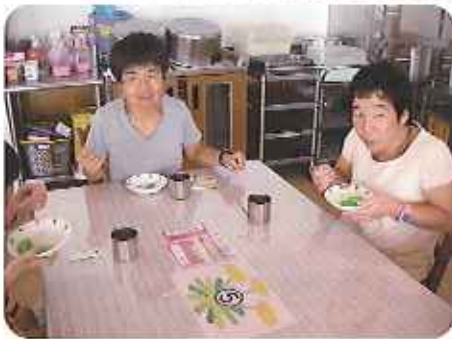
▲冷たくておいしいね！

待ちきれない様子で、好きな味を選んだ後は、「冷たくておいしいね。」「また食べたいな。」などと、楽しく話しながら、あっという間に食べ終えています。