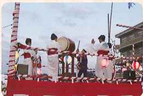
▲第2春緑苑は大保に通まれ、踊り子さんがやくらの下で、 すてきな踊りを披露してくださっています