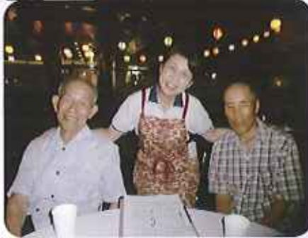
▲にっこり。すてきな笑顔です

杯。手作りの梅酒と梅シユースも用意しました。おつまみセツトは、じっくり煮こんだ鶏の甘酢とケアハウス豊田で収穫したじゃがいもを使ってのフライドポテト、枝豆、ねぎまをみなさんに召し上がっていただきました。カラオケも盛り上がり、最後には豪華な花火を見て楽しみました。