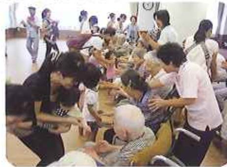
▲かわいいらしい子どもたちとのふわあい

8月23日(木)、mama's smileのお母さんと赤ちゃんが大勢遊びに来てくれました。