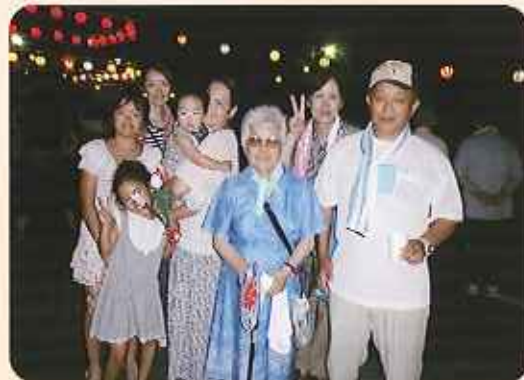
▲みんなで夏祭りを楽しんでます