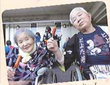
▲アランクフルトおいしいよ~!