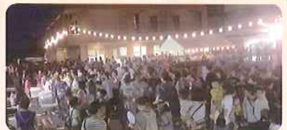
▲たくさんの方でにぎわっています