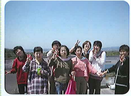
▲青空が気持ちいいね～