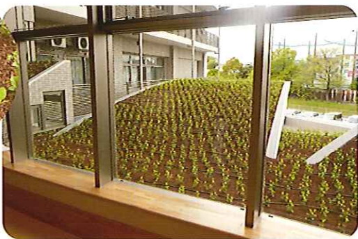
少しずつ成長していますね!!▶

大府の郷では機能訓練スペースから見える屋根で屋上緑化を行っています。利用者さんは、すくすくと大きくなる植物たちを見守りながら、機能訓練に取り組んでいます。中には、「1週間前より成長した。」と言われる利用者さんもおられ、今後の成長が楽しみです。