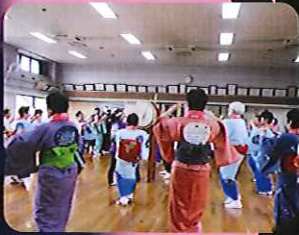
▲一緒に踊ってきました

今年は何年より早く桜が満開を迎えました。4月7日(日)に、今年も坂下公園で行われる春祭りへ行ってきました。当日は風が少し冷たく、あいにくの曇り空での開催となりましたが利用者さんと一緒に風情ある「花見」を楽しみました。