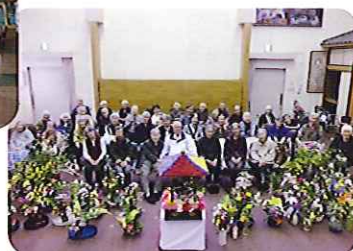
▲きれいなお花の前で記念撮影