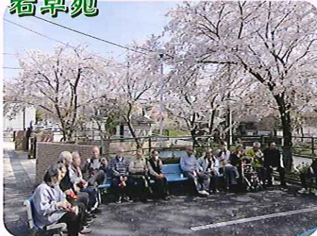
▶天気もよく桜の下で心が和むねえ