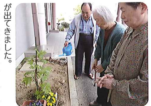
▲どんな花が咲くかなあ?

「今年は何が咲くかな?」と、利用者さんは訪れるたびに観察し、楽しみにされています。