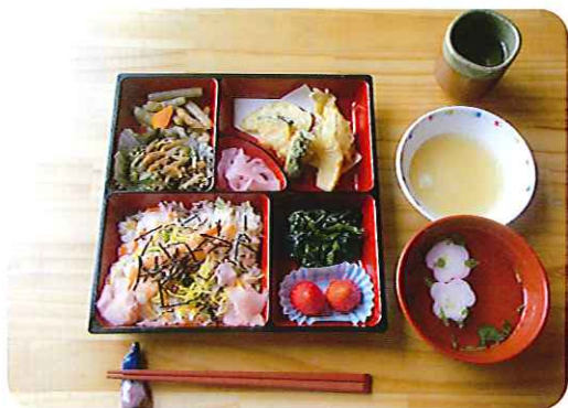
豪華なお花見弁当です!

4月2日(火)の昼食に「お花見弁当」を行事食としてみなさんに食べていただきました。お弁当の中身は、ちらし寿し、てんぷら、菜の花のお浸し、ふきの煮物など春の食材をふんだんに使い、見た目にも楽しめるお弁当にしました。