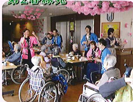
▲苑内のお花見会でも大盛り上がり!