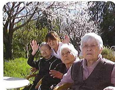
▲とても良い陽気で気持ちいいですよ