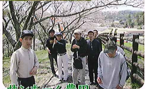
▶桜並木の散歩は気持ちいいね