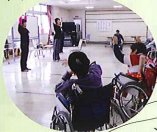
▲先生の動きに合わせて☆