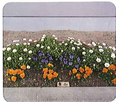
▲きれいな花が咲いています

東山の花だんには、色とりどりの花が咲き、昨年の春に植えた「カシワバあじさい」の新芽