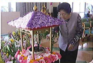
甘茶をかけてのお参りです