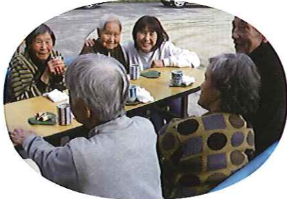
▲利用者さんも施設長も桜の美しさにニコリ!

若草苑の桜は、見事な花を咲かせて、毎年、利用者さんの目を楽ませてくれます。春風に舞う桜の花びらを「本当に、きれいだね。」と利用者さんは眺めていらつしやいました。お花見にちなんで、桜色あんまきを作り、大変好評でした。「来年の桜も、みなさんと一緒に見られるようにと一本締めで」お花見会を終えました。