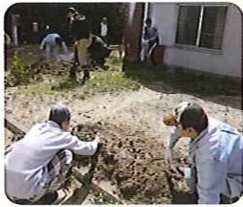
まずは「土づくり」から...力仕事です

4月20日(土)には、野菜の苗を植え付け、ボランティアさんと利用者さんが真剣に、「間はどうのくらい空けるのかな?」「どのくらい土をかぶせたから良いか...」まずは「土づくり」から