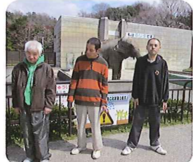
▲象って大きいね～、なかなか見応えがありますね!

3月28日(木)、利用者さん3名と職員2名で、岡崎市にある岡崎東公園へ行ってきました。