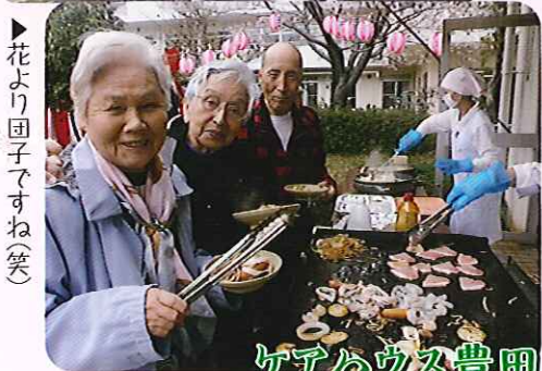
▶花より団子ですね(笑)