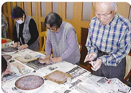
「みなさん真剣で会話はなそうですわね(笑)」