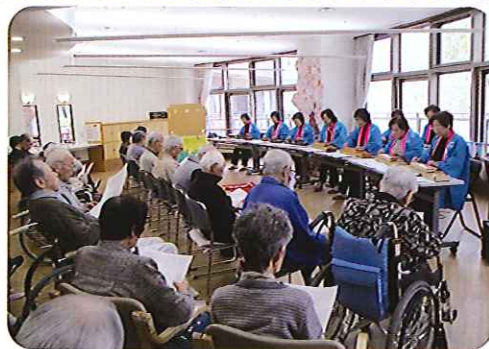
▲きれいな音色で心癒されます