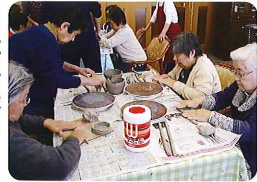
「こらやっつやるのかしら」

毎月1回、予防フロアでは陶芸教室を行っています。 4月は、いろいろな器を制作する」というテーマで、利用者みなさんは粘土を使って一生懸命に取り組まれていました。 「私はサラダを入れるお皿が欲しいの。」「私はお茶碗にするわ。」と、それぞれ思い思いの器を、ろくろの上で力強く粘土をこね、形を整えておられました。 「しっかりと焼けるかな。」「完了」