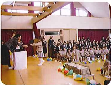
卒園式では園長から一人ずつ卒業証書が渡っていき、立派に育っていきなさいね

3月27日(水)の卒園式では、40名の子どもたちとの別れがあり、4月4日(木)の入園式では、45名の新入園児との出会ひがありました。