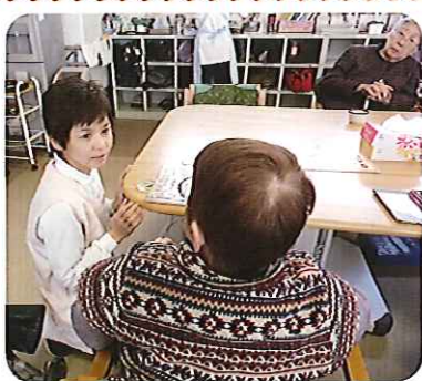
▲本施設長と談笑する利用者さん

東山デイサービスは、4月から新しい施設長でスタートしております。また、今までと違ったスタイルで事業所を盛り上げていきます。