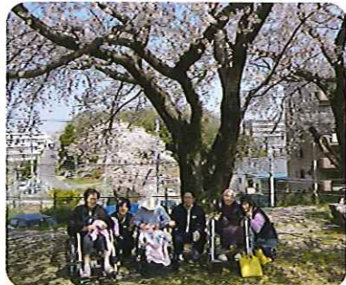
▲ゆったりと時が流れていきます 春を感じてきました

開設したばかりの施設ですが、利用者さんが毎日を楽しんで過ごしていただけるよう、職員一丸となって頑張っていきます。