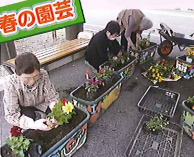
▲色とりどりの花が元気をくわめますね