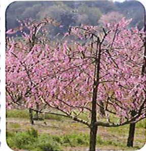
▲きれいな桃の花がいっぱいです

利用者さんたちは、「今度は実がなっている時に来たいなあ」と、早くも来年に期待を寄せていました。