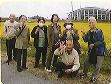
▲菜の花畑とスタジアムを背景に「ハイタッチス!」

月2回の「買いものデー」。今回は、見事に黄色に埋めつくされた、豊田スタジアムの東側の菜の花畑に寄り道をしました。車から降りて、花の香りが漂い癒しのひとときを