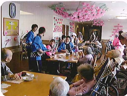
▲キレイな音色が施設内に響き渡ります!!