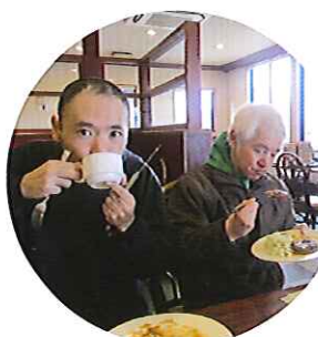
▲とってもおいしいよ～☆