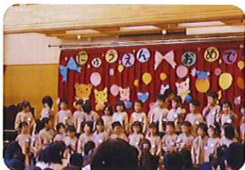
▲入園あめどう、仲良くしようね、園証書をもらい、先生や在園児に見送られ、就学に胸を膨らませ、子どもたちは元気に巣立っていました。

そして、入園式では、新年長児の子どもたちと一緒に歌を歌ったり、手遊びをしたりして楽しみました。