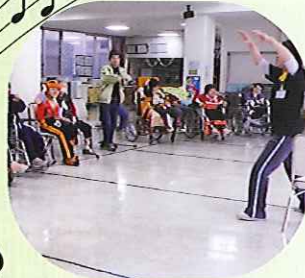
▲みなさん体操の時間が大好きです!