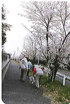
▲みんなが使いやすい道だからね

きれいにしないとね。道だか作業をするのができました。緑道がきれいになるにつれ、吹き渡る風が一段と清々しく感じられました。