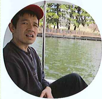
▲のんびり、ゆったりだね～

歩くことにより、様々なものを見たり触れたりすることができ、利用者さんたちは特別な感触を得たことでしょう。