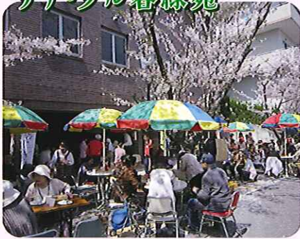
▲本当に今日はお花見日和だねえ～