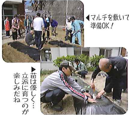
▲苗は優しく...立派に育つのが楽しみだね