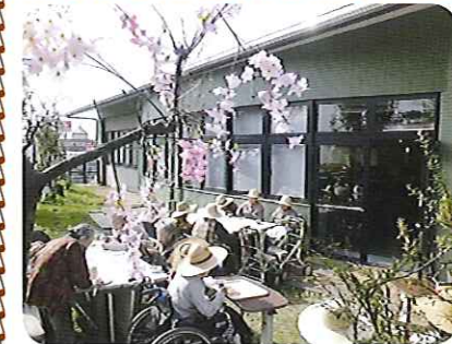
▲天気も良く、ポカポカ陽気で気持ちいいね!

天気にも恵まれ、職員の手作り焼きそばをお庭で食べていただきました。外で食べるいつもの違った雰囲気、みなさん、「おいしい。」と頬張られ、いつもより食欲旺盛でした。春を満喫していただけた一日となりました。