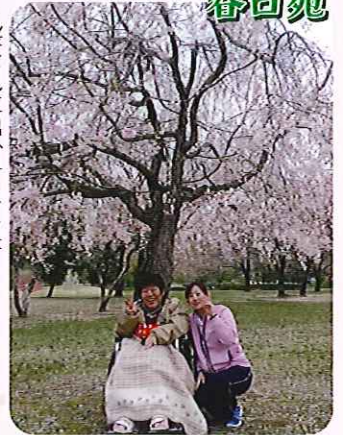
▶桜を見に出かけました