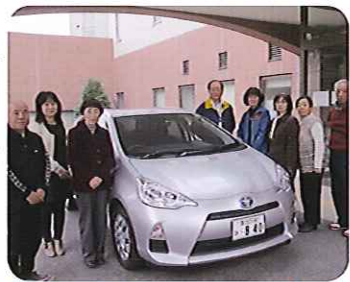
▲人気のアクアです!

公用車をリボンで装い、保護者の方々にお披露目をしました。ハイブリッドカーなので、環境にも配慮しています。