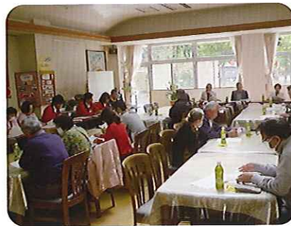
▲5つの議案について審議中... 異議なく可決承認されました

4月13日(土)、「平成25年度家族会総会」が、多くのご家族の出席を得て開催されました。