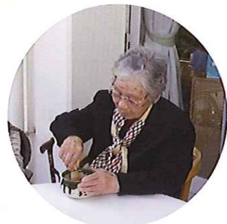
▲いいお味に仕上がるかしら!?

4月1日(月)から1週間、デイサービスの庭の桜の木の下で野点を行いました。利用者さんは満開の桜を見ながら、昔を思い出されています。ご自身で点てたお茶は格別とあって、満面の笑みがこぼれていました。