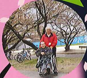
▲今年の開花は早かった

今年は何年より早く桜が満開を迎えました。4月7日(日)に、今年も坂下公園で行われる春祭りへ行ってきました。当日は風が少し冷たく、あいにくの曇り空での開催となりましたが利用者さんと一緒に風情ある「花見」を楽しみました。