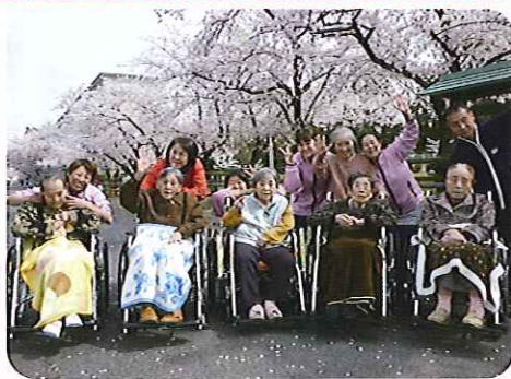
▲桜を背景に、ハイチーズ!