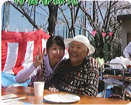
▲桜よりも笑顔がすてきですね!!