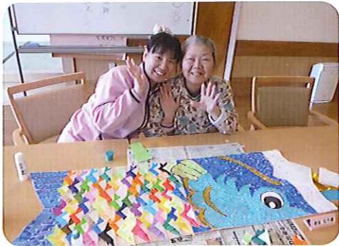
▲すてきな作品の完成ですね!