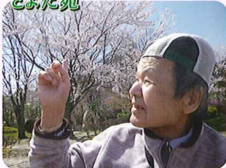
▶桜が届きそうです