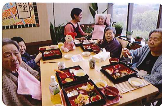
▲なかなかのお味だね!!