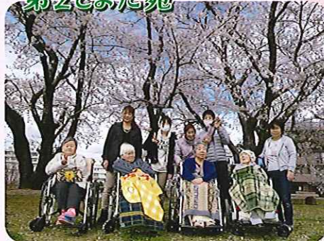
▶桜の下でハイタッチス!!