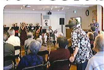
▲盛大に盛り上がりました