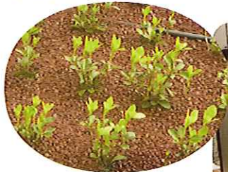
▲どのようにっていくのか楽しみです!

ぎやかになってきました。私たち職員は、入所者の「この施設に入れてとてもうれしい。」「きれいな施設で来てよかった。」という声は何よりの活力になっています。初めてのことがばかりで、まだまだこれからの大府の郷ですが職員一丸となって施設を盛り上げていきます。