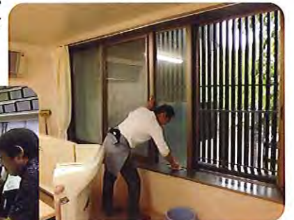
▲隅々までキレイにしないとね