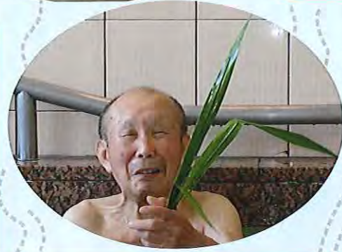
▲いい匂いだね！自然と笑顔があふれます