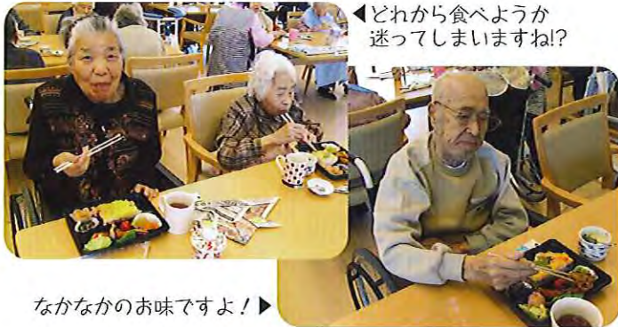
▲どれから食べようか迷ってしまいますね！