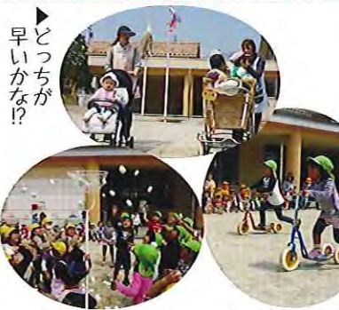
▲たくさん入れえ〜 ▲負けないぞ!

次に幼児組全員で玉入れを行い、1回戦は白組、2回戦は紅組が勝ち、引き分けの勝負となりました。 こののぼりが元気に泳ぐ中、楽しい時間を過ごすことができました。