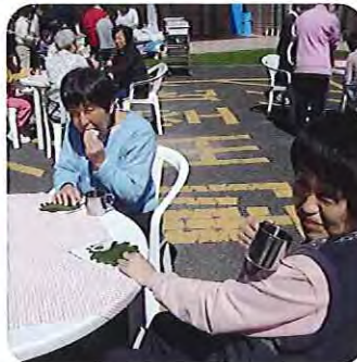
▲外でのお茶会、気持ちいいね♡

5月2日（木）、一足早く、端午の節句を祝いました。今年はお茶会を企画し、柏もちとほうじ茶を楽しんでいただきました。晴天に恵まれ、このほりがさわやかな風の中を泳ぐ様子を見ながら、みなさんのんびりとお茶会を楽しんでおられました。