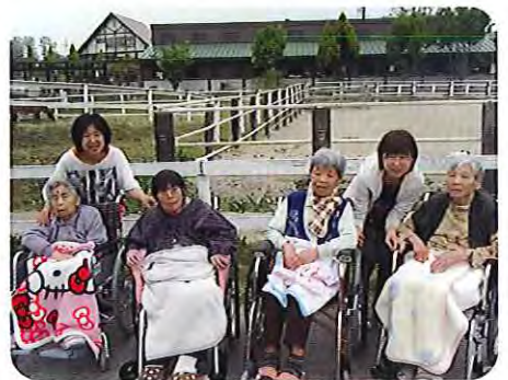
▲気分転換になりました

古いモデルの車いすだったため、部品を取り寄せるのに少し時間がかかってしまい、結局、