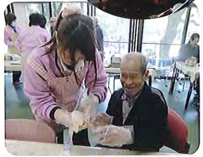
▲しっかりつけてくださいね。おいしくできるかな？

焼いた味噌の香ばしいにおいが漂う中、利用者さんたちは、熱々の五平もちを頬張り「お替りが欲しいな。」とみなさんたいへん喜んでおられました。