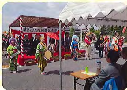
殿姫チンドンさんが第2とよた苑にやってきました。

当日は、風が強く肌寒い中での記念祭になりましたが、天気は良く大盛り上がりでの記念祭となりました。 開設して早くも6年目を迎えました。職員一同再度初心に返り、利用者さん、利用者家族、地域の方々に信頼される施設づくりを目指していきます。 今後とも、よろしくお願ひ致します。