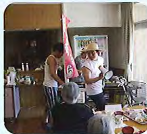
▲わらび~もち~! おいしいよ~!!

リハビリを兼ね、歌に合わせて「こいのぼり体操」や「節句体操」を行い、慣れないながらもみなさん元気に体を動かしておられました。 体操の後は、「あつちいけゲーム」を行い、風船をこいのぼりにみたくてうちわで扇ぎ、相手の陣地に追いやるゲームで盛り上がりました。終了の笛の合図に気が付かないほどの盛り上がりでした。 気持ち良さそうに泳ぐこいのぼりを眺め、楽しい一日を過ごされておりました。