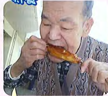
やわらかくておいしいね!