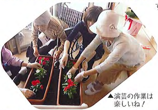
▲演芸の作業は楽しいね！

ユニットから出る機会が少なく、他のユニットのみなさんと食事をすることができ、「ここにはたくさんの方がいたんだね。隣はどんな感じなんだろう。」と、新たにお友達を増やしていくごと、期待に胸をふくらませる利用者さんもおられました。楽しく、おいしい端午の節句会となりました。