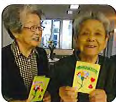
▲ありがとうメッセージマ 笑顔がこぼれます!!

5月10日(金)、朝食時のテ ーブルに、職員からのメッセー ジカードを置いたところ、「私 にピッタリの 言葉がありが とつ、大切に とっておきま す。」と言わ れ、心が温か くなりまし た。