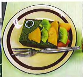
おいしそう！鯉に見えるかな？