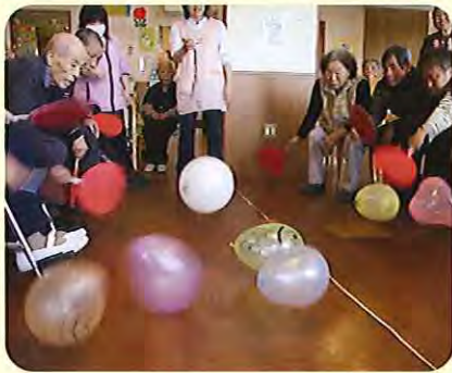
▲みなさん真剣です!