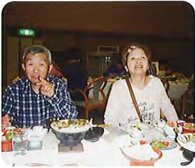
▲豪華な昼食を食べました

その後、昼食をとり、ゆつくりと温泉に入ったり、浜名湖パルパルでゴーカートやジェットコースターなどのアトラクションに乗ったりと、それぞれに楽しんで過ごされておりました。 帰りのバスの中では、「イチゴ甘かったね。」「また行きたいね。」「などと言っていました。年に一度のバスハイクを存分に楽しんでおられました。