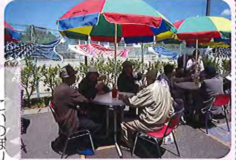
▲こいのぼりに、乾杯~!

こいのぼりが泳ぐ中、5月2日(木)に、特養・デイサービス・グループホーム・ケアハウス・シヨートステイで端午の節句野外食を行いました。 できたてのおいしいご馳走に、お腹も笑顔もいっぱいになりました。 天候も快晴に恵まれ、利用者さんは楽しいひとときを過ごされていました。