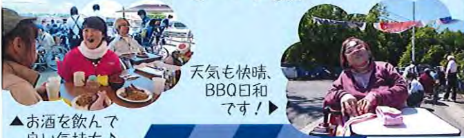
天気も快晴、BBQ日和です！