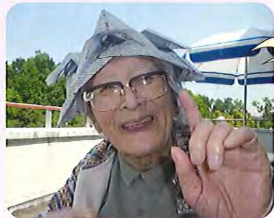
私にも五平もち1本 くださいな。