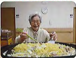
できたてはおいしいよ。なかなかのお味だね!

目の前で焼く焼きそばとたこ焼きはおいしさ倍増!利用者さんはたいへん満足されていました。