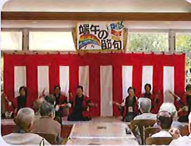
すてきな演芸会でした