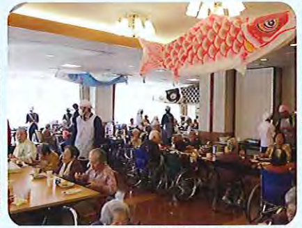
▲こいのぼりが気持ち良さそうに泳いでいます