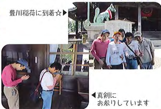
▲真剣にお参りしています