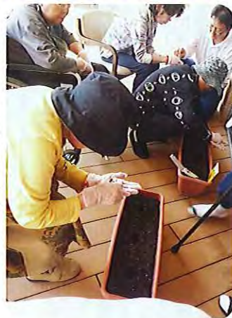
▶種をまくのも上手にまかないとね

よ。」と言われる利用者さんもおられました。フロアからの見晴らしに、「まるでどこかのレストランみたいだね。おいしさ倍増だよ。」と、喜びの声も聞くことができました。