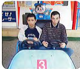
▲ドライブに行ってきたーす

狩りでは、ハウスの中に入ると、大きくて甘いイチゴがたくさんあっており、みなさん夢中で食べていました。