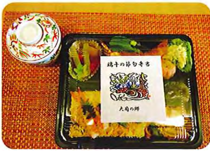
▲端午の節句弁当！ 茶わんむしも添えて

野外食を計画しておりましたが、この日は、とても風が強かったため、各フロアの共用スペースでの会食となりました。利用者さんと一緒に作った新聞紙でのかぶとや折り紙での箸ケースなどを用意し、会に花を添え