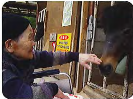
▲なかなか利口そうな馬だね! 動物とのふれあいにニコリ!!