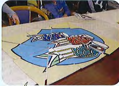
手作りバスル対決!!