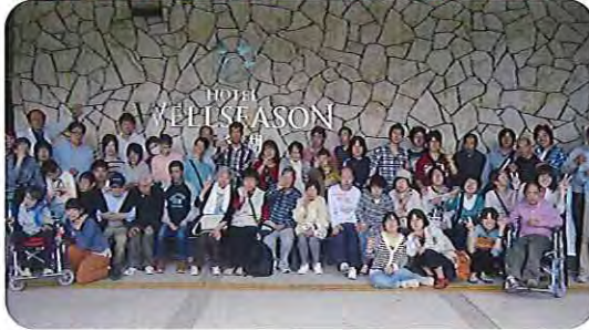
▲みんなで記念写真☆

狩りでは、ハウスの中に入ると、大きくて甘いイチゴがたくさんあっており、みなさん夢中で食べていました。