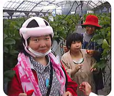
▲イチゴ甘くておいしいね!