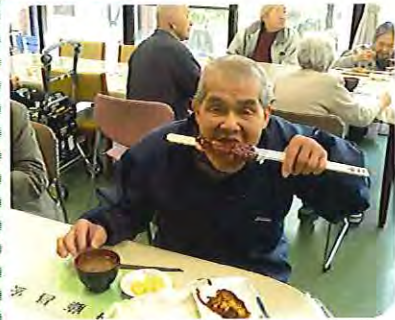
▲これは、うまい！自分で作ると格別だね!!

夏野菜作りに挑戦している利用者さんがおられます。ミニトマトをプランターに大玉スイカの種を畑に植え付けました。去年に引き続いての挑戦です。大きな真っ赤なスイカとおいしいミニトマトができるのが楽しみです。みなさんで見守っていききたいと思えます。