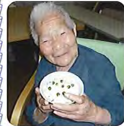
▲みなさんと一緒につくった 豆ごはんの味は格別です☆