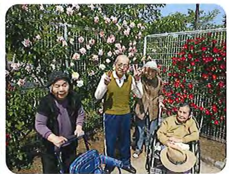
▲バラがとてもお似合いですね!!