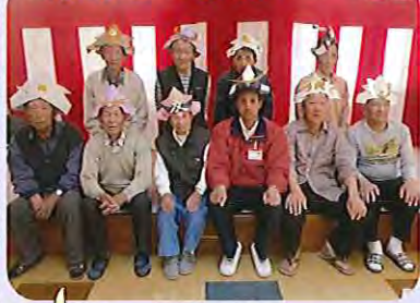
かぶとをかぶって記念撮影! 武将みたいでかっこいいでしょ!!