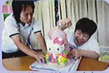
▲シャリシャリしています。食べるのがとっても楽しみです。

7月23日（火）、かき氷を利用者さんと一緒に作りました。みなさん上手にレバーを回してかき氷を作られており、とてもおいしそうですね。