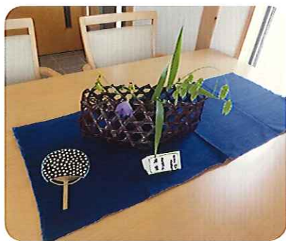
▲すてきな飾り物です

7月31日(水)、抹茶の先生に慰問に来ていただき、隣接する東屋を利用して行いました。