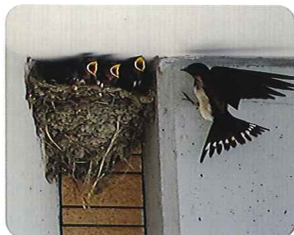
▲お腹を空かせて雛たちが待っています

日が経つにつれて、巣も立派なものになり、しばらくすると、鳴き声が聞こえてきました。かわいい雛たちが、顔を見せてくれます。利用者さんは散歩のときには必ず立ち寄り、眺めています。