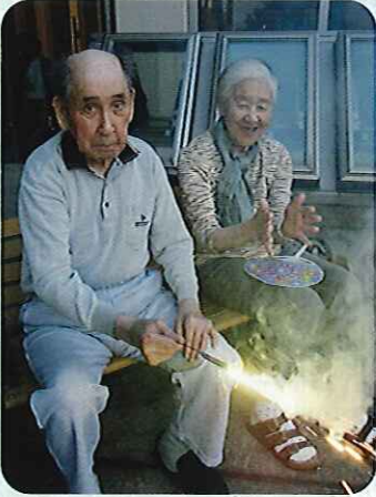
きれいな花火だよ！

7月30日(火)、保見・猿投ユニットで花火大会を行いました。 久しぶりに花火をする利用者さんが多く、みなさん始まる前から「楽しみだね。」という声がたくさん聞こえてきました。 いざ、花火に火がつくと、歓声とともに、童心に帰ったような笑顔が印象的で、みなさん夏のイベントを楽しんでおられました。