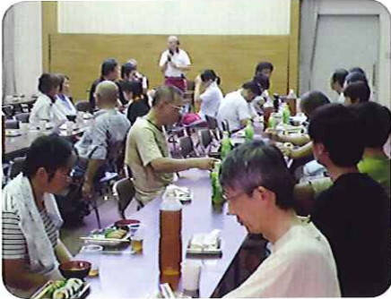
▲たくさんのご家族に協力していただきました

「油から出すのが早いんじゃないの。」という声も聞こえてきました。おもしろい香りが出てくると、みなさん食べるのを待ち遠しそうにされておられました。揚げたてパリパリに仕上がったその日のおやつは、大好評で、みなさん満足そうに食べておられました。