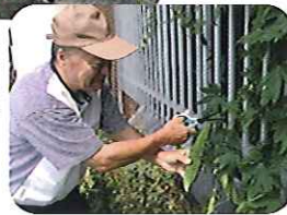
▲そろそろ食べときかな！