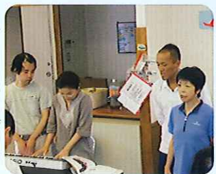
▶楽しい音楽の時間♪