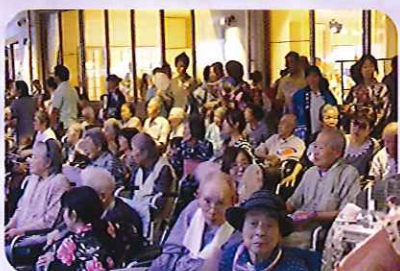
▶たくさんの方でにぎわっています

利用者さんも一緒に楽しそうに踊っていました。たくさんの方に参加していただき、地域の皆様、ボランティアの方々のおかげで、大府の郷初めてとなる夏祭りを盛大に行うことができました。皆様の温かみを感じる一日となりました。たくさんのご参加ありがとうございました。