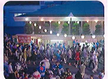
▲模擬店は大勢のお客様で大盛況!

さくら太鼓 様 (太鼓演奏) ちひろ会 様 (盆踊り) 豊愛会 様 (盆踊り) たかなみ会 様 (盆踊り) 豊鼓君 様 (盆踊り)