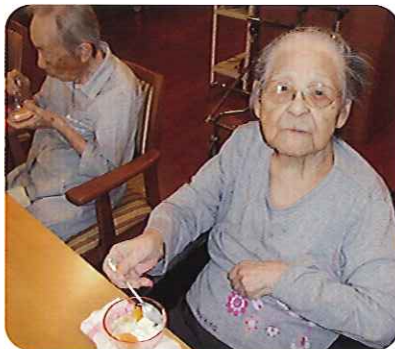
▲おかわりしたくなりますね！

すると、経験のある人だけでなく、興味を感じて「やってみたい」という利用者さんもおり、一緒に参加して、和気あいあいな雰囲気の中で書道を楽しみました。