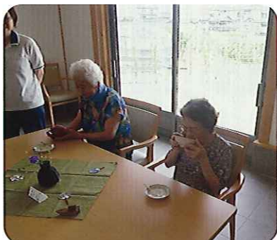
▲なかなかのお味ですね

先生に花や花器、茶わん、掛け軸や香呂まで、東屋内を小物で飾っていただき、茶屋の雰囲気満点でした。利用者さんも普段と違った空間でお茶を楽しまれ、笑顔がこぼれていました。