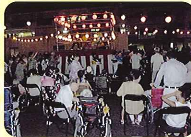
▲やぐらの周りは踊り子さんでいっぱいです

当日は、天候に恵まれ、合同夏祭りを開催することができました。久しぶりに浴衣を着る利用者さんは、「昔はよく、盆踊りをしたものよ。」と楽しそうに話され、元気に踊っておられました。やぐらの上で、ボランティアさんが太鼓をたたき、太鼓の音に合