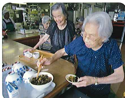
▲どんな味に仕上がったかしら？