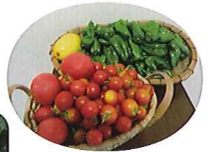
▲新鮮な野菜で、おいしいそうです

真つ赤に育ったトマト、太陽に照らされ光り輝いているピーマン、大きく育ったナス、きゅうりを葉の間からたくさん見ることができます。利用者さんが水をまいたり、草取りをしたり、成長に合わせてわき芽を取るなど、日々世話をしてくださったおかげで、たくさん野菜を収穫することができました。