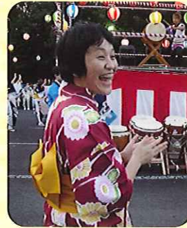
▲夏祭りを満喫！すてきな笑顔ですね！！

わけて手拍子やリズムをとられる利用者さんもおられ、みなさん素敵な表情をみせてくださいました。みなさんの楽しそうな表情で夏の暑さも心地よく感じられ、ちようちんの優しい灯りで、夏を身近に感じる事ができました。