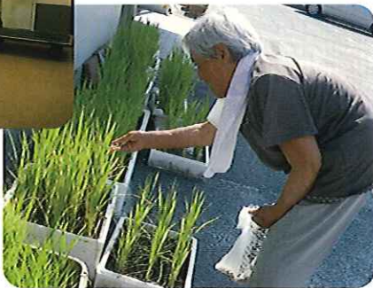
肥やしが欲しいよね！！