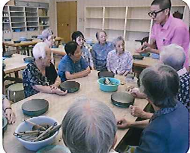
▲11名の利用者さんが参加されました

コーヒーマグ、小鉢、お皿など必死に制作される姿はとても素敵で印象的でした。焼き上がりがとても楽しみです。