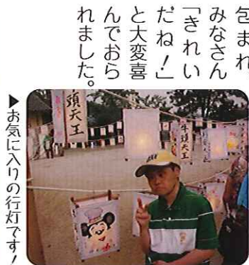
▶お気に入りの行灯です！