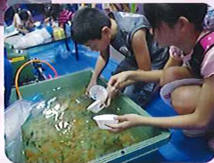
うまくすくえるかな?▶