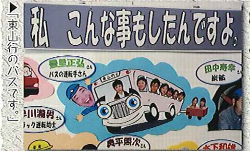
▶「東山行のバスです。」