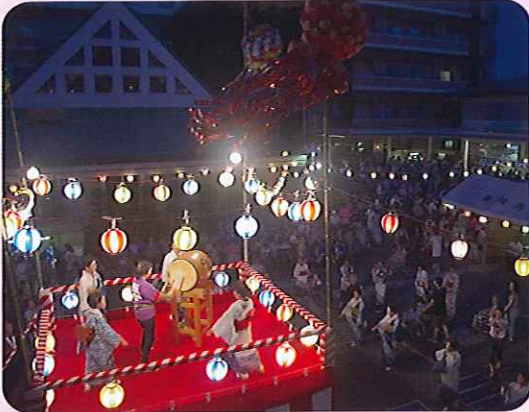
▲太鼓の音に合わせ、みなさん踊っています