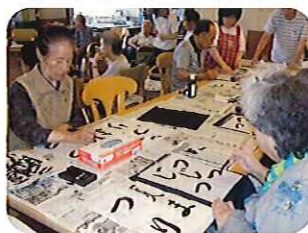
▶上手に書けました!!

先生になられた利用者さんも、とても励みになったようで、表情が生き生きと輝いていました。