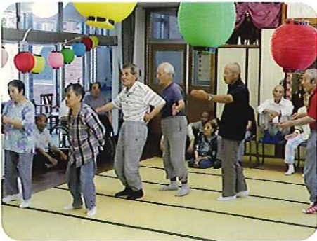
▲練習の成果もあり、みなさんお上手です！

7月24日(水)に盆踊り大会を開催する予定でしたが、悪天候のため中止となってしまいました。