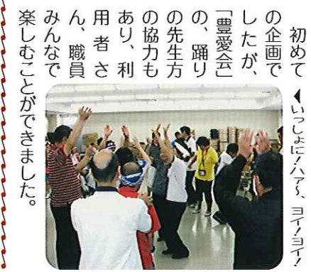
初めての企画でしたが、「豊愛会」の、踊りの先生方の協力もあり、利用者さん、職員みんなで楽しむことができました。

7月17日（水）、昼休みの時間を利用して、ワーカー鷹来施設内で夏祭りを行いました。2階作業室にスペースを作り、盆踊りを行いました。「炭坑節」や「ドッコイセ春日井」など、一度は耳にした曲を中心に踊り、大いに盛り上がりました。