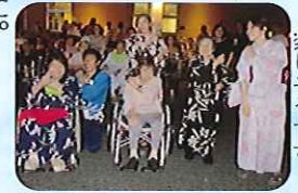
▶みなさんとても楽しそうです

当日は、天候に恵まれ、合同夏祭りを開催することができました。今年、大勢の子どもたちにも参加していただき、夏祭りを盛り上げていただきました。浄水小学校和太鼓クラブによる勇ましい太鼓演奏で夏祭りがスタートし、踊り子さんによる盆踊りや子どもたちの元気いっぴいな踊りなど、にぎやかな夏祭りとなりました。