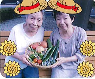
▲愛情と栄養たっぷり

今年もケアハウスの畑でたくさん夏の野菜が収穫できました。新鮮なきゅうりをビール漬けにして食べていただいたところ「これだけでもご飯がすすむね。」と大好評でした。