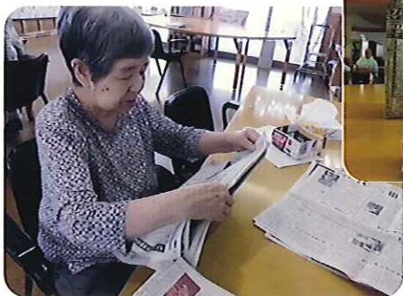
▶エコバッグ作りに一生懸命です