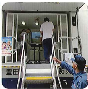
▲地震の揺れを体験！

7月24日（水）、今年も豊田市消防本部の方に協力いただき、防災指導車「防サイ君」がやってきました。