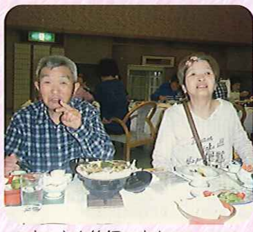
▲すてきな笑顔です☆

清掃を行ったりしています。そんな元気いっぱい二人は、これからも他の利用者さんや職員を笑顔にさせてくれることでしょう。