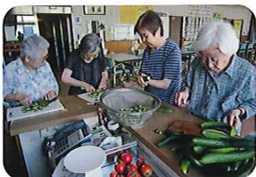
腕の見せどころですね!!