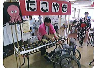
「たこ焼き」くださ〜い!