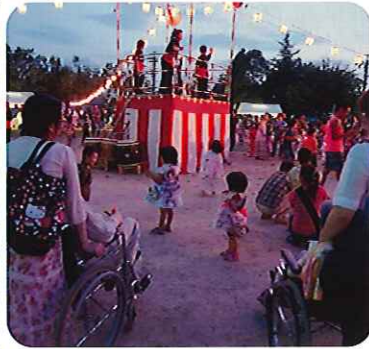
▲みなさんとても満喫されておりました

踊りに誘うと、「恥ずかしい」と言って遠慮がちだった利用者さんも、出店を見ると「何があの？」と目を輝かせておられました。心地よい風が吹く中で、いつもと違った雰囲気を楽しみることができました。