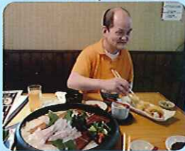
▲こりゃとえりやうまいぞ。お前さんも食うてみて。