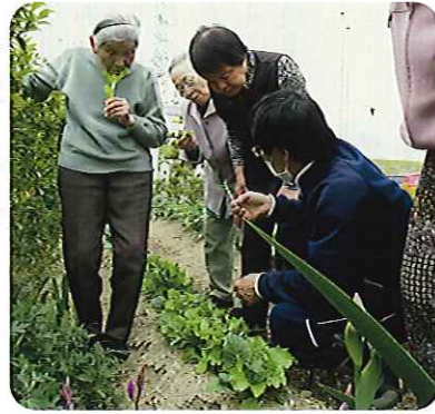
春に植えた野菜が…