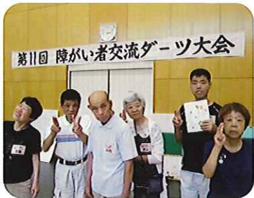
▲ダーツ楽しかったね◎

と上達し、全部の矢的に当たられるようになった利用者さんもおられました。残念ながら、団体戦で、1回戦で負けてしまいました。楽しく体を動かすことができました。日となりました。