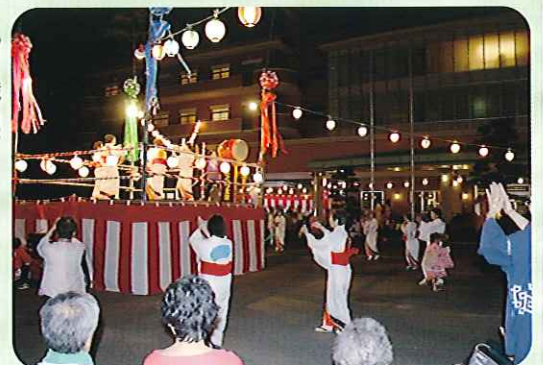
▲夏祭りムード! 最高潮に!!

当日は天候が心配されましたが、みなさんの熱い思いが通じたおかげで、無事に夏祭りを開催することができました。日本の夏をイメージするわらびもち、かき氷やねぎま、焼きそばなど香ばしいにおいが夏祭り会場に漂い、模擬店にはたくさんの列が並び、大いににぎわいをみせていました。