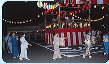
▶いろいろな方が踊りに参加してくれました

た。今後、地域とのつながりを大切にしていきたいと思っております。たくさんのご参加ありがとうございます。