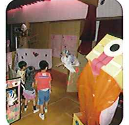
▲こわくない◎こわくない◎