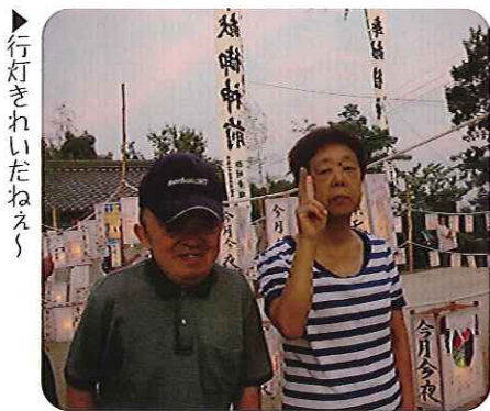
▶行灯きれいだねえ！