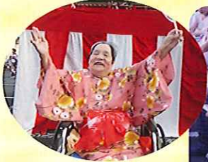
▲私の浴衣姿どうですか？