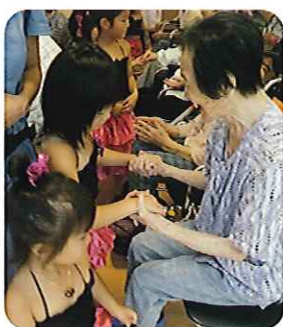
▲優しい笑顔がたくさん見ることができました