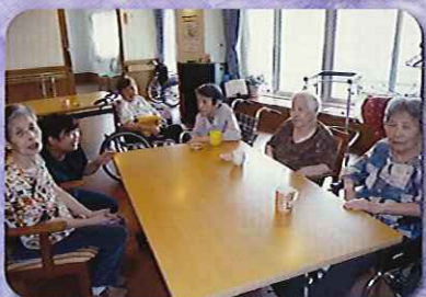
▲談笑中！お話が盛り上がっております！！

ユニットの特徴は、利用者さん同士の仲が良いことです。リハビリ体操を行った後は、好きな飲み物を飲まれながら談笑されています。このユニットは、紙工作ボランティアの会場にもなっており、利用者さんが季節の作品を作られると、「きれいにできたわ。」とお互い笑顔で見せ合いながら作品作りを楽しまれています。