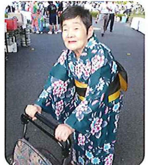
▲今から夏まつりに行ってきます

合うでしょ。」と話され、夏祭りの前に浴衣自慢大会が始まりました。 「みなさん、それぞれに個性がでて、すてきな浴衣でしたよ。」