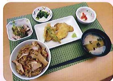
9月のベストメニュー 松茸ご飯