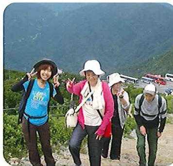
▲ハイキング楽しい☆

晴天時は近くの自然観察の森や玉滝溪谷に散策に行き、雨天時はホールで筋力トレーニング