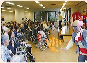
▲楽しくみんな踊りました

午前中は荒れ模様の天候でしたが、午後からは窓を開けると心地よい風が吹き、さわやかな風が吹くなかでの敬老会となりました。