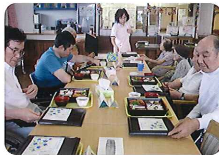
▲これは、うまそうだ!!

中には、この日を楽しみに利用されている利用者さんもいます。今後、さらに工夫をし、利用者さんに楽しんでいただける企画をしていきます。