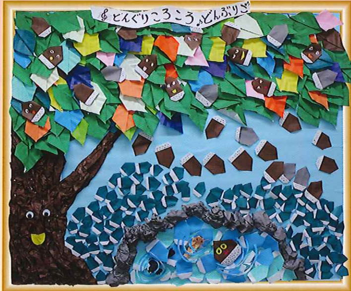
「どんぐりころころ」