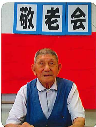
▶これからも元気でいてくださいね!