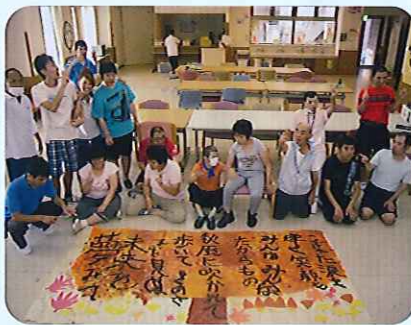
▲大作がで上がりました

をして体力づくりをしています。目標は富士山登頂!先日は伊吹山の登頂に成功しました。山頂からの景色は最高でみなさん達成感に満ち溢れていました。