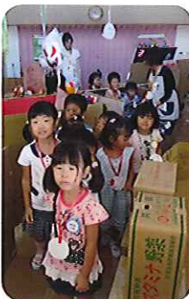
▲あと少しでゴール!