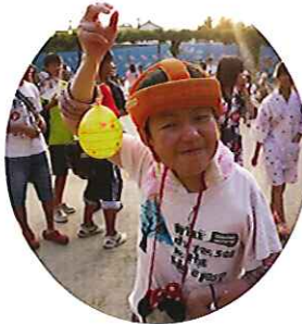
▲水風船を釣って、暑さを忘れました。笑顔がこぼれます。

夏祭りを存分に楽しみ、ふと空を見上げたところ、青空にうろこ雲を見つけ、夏の終わりとともに秋の気配を感じる一日となりました。