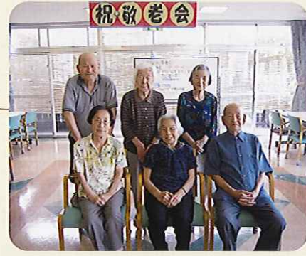
◀90歳代のみなさんです!お寿司もいっぱい食べました(ケアハウス)