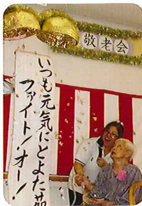
くす玉割りでお祝い。(デイサービス)