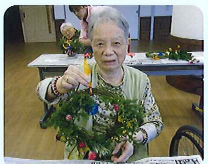
▲生花クラブで、すてきな作品をいつも作られます

ないほどだそうです。愛媛県で 過ごした生活が何よりも楽しい 思い出として残っているそう で、今でも「愛媛に行きたいな あ。」と、故郷を懐かしんでお られました。