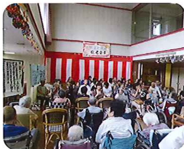
大勢の方が集まってくれました。敬老会の始まりです。(特養)