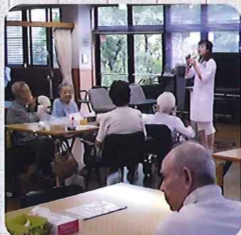
▲みなさん真剣に聞いています

8月26日(月)、歯科衛生士の方に来ていただき、歯やお口の健康についてわかりやすく説明していただきました。健康の源は「食を食べること」だそうで、みなさんとても熱心にお話を聞かれており、関心を持って参加しておられました。歯を大切に、いつまでも健康でお過ごしください。