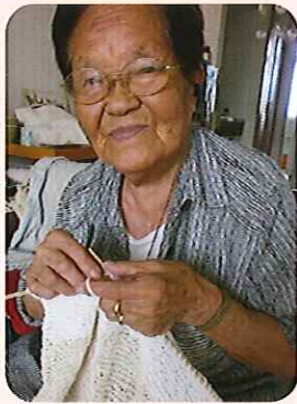
▶今も、大好きな手編を楽しんでいます