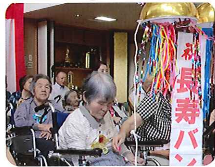
とよた苑のNo.1長寿！おめでとうございます!!(特養)