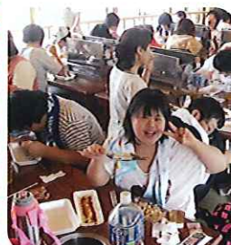
▲とってもおいしいよ~!

8月8日(木)、今年も春日井市遊技業組合様の招待をいただき、板取川の洞戸観光ヤナへ行っ