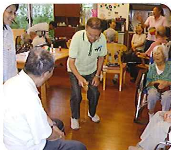
▲腕の見せどころです

これからも多くのイベントを企画し、利用者さんの笑顔を多く見られるように取り組んでいきます。