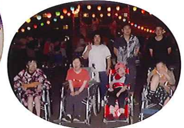
▲ちようちゃんの明りが暑さを和らげ、夏の風情を感じました。