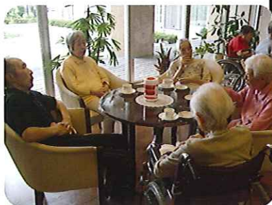
▲のんびりとした時間が流れます