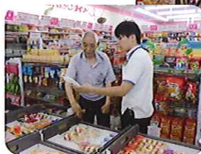
◀これはどうですか?