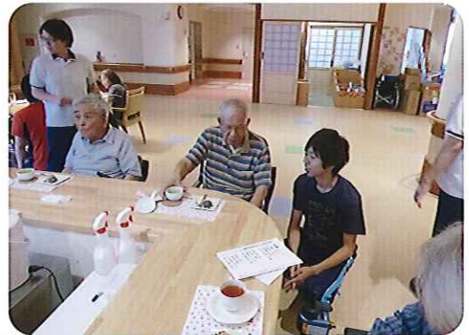
▲楽しく学生交流することができました

入社してもう半年ほど経ちます。まだまだ力不足な点ばかりですが、先輩から仕事を任せられるような介護士を目指します。