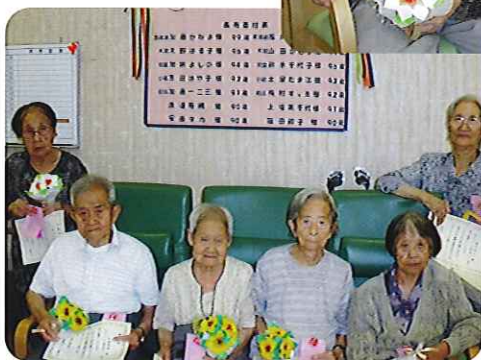
▲みなさん、いつまでもすてきな笑顔でいてくださいね!