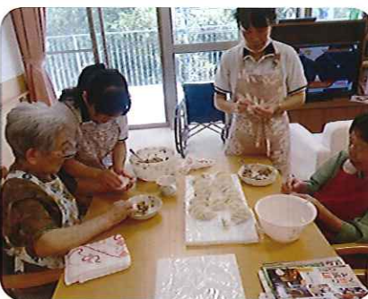
▲悪戦苦闘しながらも、みなさん楽しそうです！

餃子のあんを皮で包むのに悪戦苦闘していましたが、次第に慣れ、あつという間に100個の餃子を包むことができました。利用者さんの目の前で焼き、香ばしい匂いに食欲もそられ、利用者さんからは「8個食べた。」と笑顔で話してくださいました。これからも、楽しい食事を提供していきます。