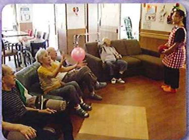
▲活気あふれるユニットです！