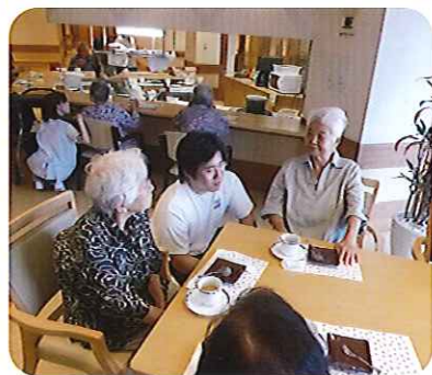
▲利用者さんも徐々に慣れてきました

若い男子学生さんに利用者さんも初めは少し緊張しておられました。すぐに打ち解けられ、会話も弾んでおりました。利用者さんの笑顔も多く見られ、有意義な一日となりました。学生さんにはここでの体験を活かして、今後の介護に役立てていただきたいと思います。