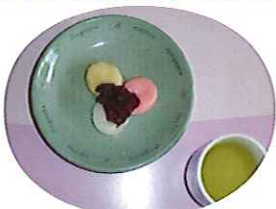
▲おいしいそうな紅白の白玉だんごです!

煙道体験では、「体を低くして、口にタオルやハンカチを当てて出口に向かってください。」との説明を受け、部屋に煙を充満させました。煙の中を通り、出てこられた利用者さんからは、「暗くて、怖かった。」と言われ、貴重な体験をすることができました。