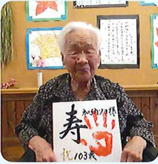
▲103歳 おめでとうございます