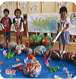
▶どの魚を釣ろうかなあ?