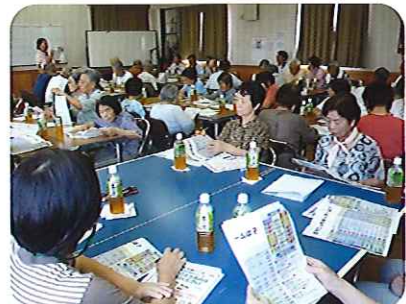
▲講義続きだったので、疲れた頭をほぐすためのパズルも行われました