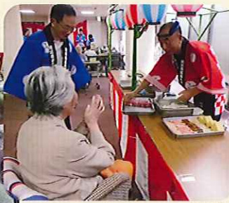
▲へい!いらっしやい!!(特養)

午後から、夢絃塾さんが慰問に来てくださり、三味線演奏を披露してくださいました。会場全体に響き渡る音色に大歓声が上がリ、笑顔いっぱいの日となりました。