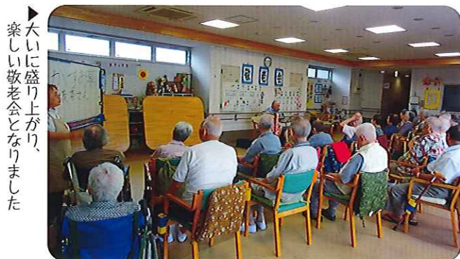
▶大いに盛り上がり、楽しい敬老会となりました

れます。買い物を終えた利用者さんは、とても楽しそうにされており、笑顔がこぼれていました。※百均：百円均一の略称