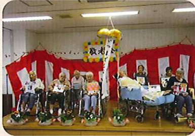
▲くす玉でお祝いです！