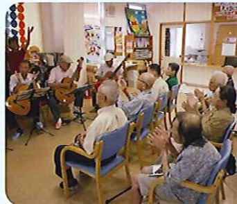
▲みんなさんノリノリです!

ボランテイアの方に来ていただき、「赤とんぼ」や「古里」などの懐かしい曲を、ギターやバイオリン、ハーモニカなどで演奏していただきました。演奏に合わせて、利用者さんたちも一緒に歌っていました。利用者さんからアンコールもあがり、たいへん盛り上がりしました。