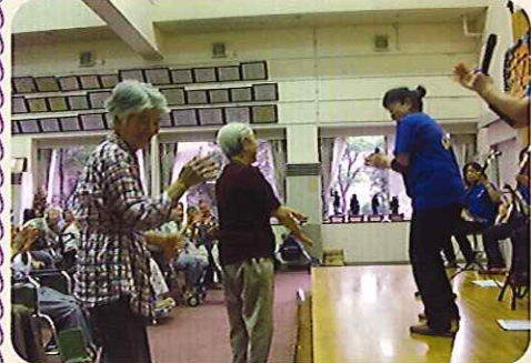
▲グループホームの利用者さんが飛び入り参加で曲に合わせて踊っています