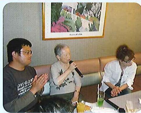
▶カラオケで大熱唱!

学生時代は、本を読むことが 好きだったようで、暇さえあれ ば本を読んでいたそうです。読 んだ本も何冊読んだか数えきれ