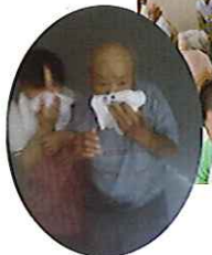
▲「ほとんど何も見えない!?!」

煙道体験では、「体を低くして、口にタオルやハンカチを当てて出口に向かってください。」との説明を受け、部屋に煙を充満させました。煙の中を通り、出てこられた利用者さんからは、「暗くて、怖かった。」と言われ、貴重な体験をすることができました。