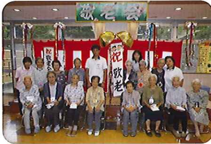
これからも元気に、長生きしてくださいね。(ケアハウス)