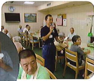
▲非常に参考になりました

消防署員による火災報知器設置の話があり、絵を使い、分かりやすく説明してくださいまし