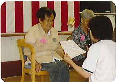
節目の歳に賞状をいただきました。(デイサービス)