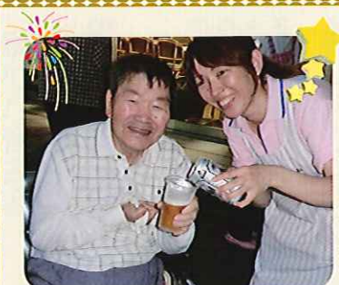
▲ほろ酔い気分で最高な笑顔ですね!

8月23日(金)、とよた苑にてビアガーデンを行いました。夏の夜空の下、大好きなビールを注いでもらって自然と笑みがこぼれます。これからもその笑顔をとよた苑の利用者さんや職員に見せてくださいね♪