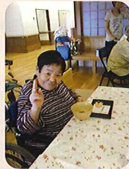
▲結構なお点前でした