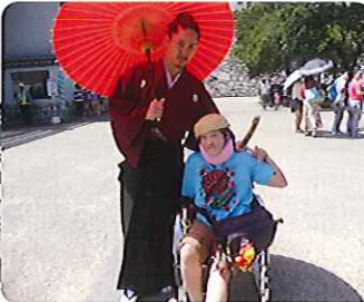
▲ハイタッチス!! 思い出になりました!!