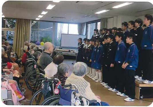
▶息の合った合唱、すてきな歌声です

最後は合唱で「ふるさと」を歌っていたとき、元気な中学生とのふれあいを楽しんでおられました。