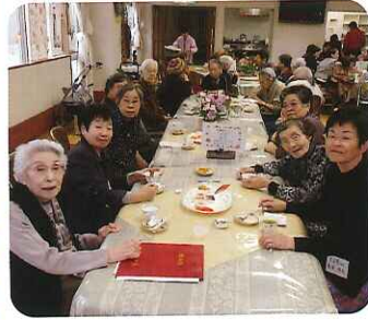
▲笑顔あふれる一日となりました