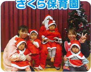
▲かわいいちびサンタがいっぱいます