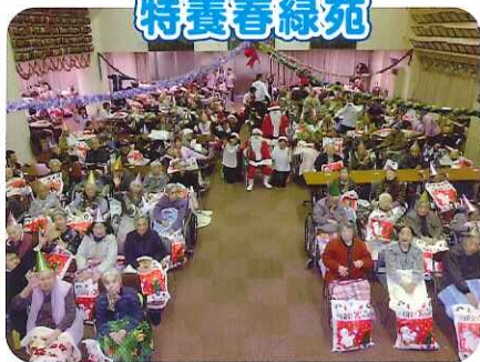
▲プレゼントもらったよ～