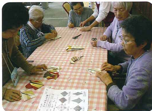
意外に難しいなあ

歌舞伎などで馴染みのある連 獅子と、今年の干支である馬を 折り紙で作成しました。 複数の高級和紙を組み合わ せ、いつもよりも難易度の