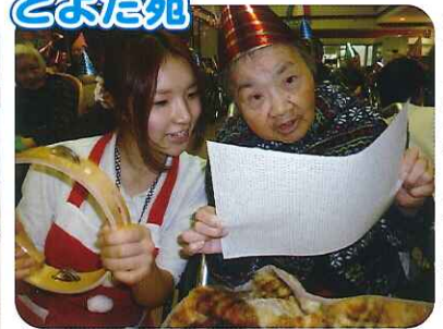
▲クリスマスソングを大熱唱！