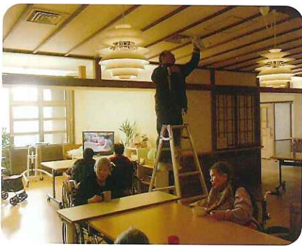
▲きれいにしないとね！

冬の期間中は、定期的に鍋料理を行い、みなさんに喜んでいただけるよう味つけなど工夫をしていきたいと考えています。鍋料理を食べて、みなさん心も体も温まってくたさいね。