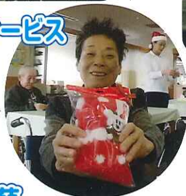
▲こんな温かい靴下もらったよ～