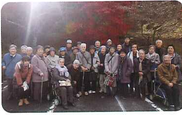
▶秀敵な紅葉に癒されました

天候にも恵まれ、絶好の行楽日和となり、五平もちやおしるこなどを食べながら、紅葉と四季桜の景観を楽しみました。