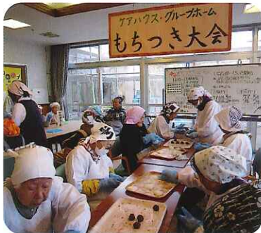
▲みなさん慣れた手つきで次々に作っています

「よいしょ、よいしょ」と掛け声を出し、ついたおもちはとてもおいしく格別で、それぞれ好みのトッピングで味わっていただきました。大福作り、