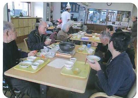
▲やっぱり、冬は鍋だね！

これからは、利用者さんの環境や身体状況だけではなく、心も理解してケアプランを作っていくと考えています。