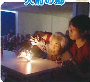
▲キャンドルに灯りがともりました