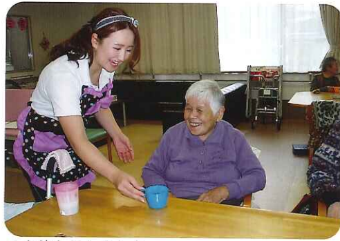
▲お待たせしました

11月より、午後のティータイムを楽しんでいたところ、東山デイサービスに珈琲屋さんオープンしました。