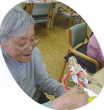
▶上手にできるかな?

利用者さんは、慣れた手つきでわらを編んでいき、それを丸く結んで、水引の鶴・竹・梅などの飾りをつけ、立派なしめ縄が完成しました。