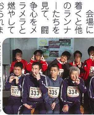
▶完走目指して頑張つて走りました。