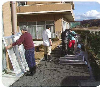
▶ご協力ありがとうございました