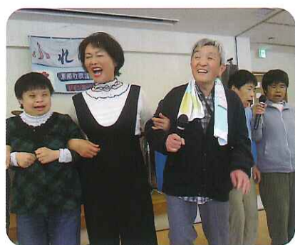
▲「幸せは～歩いてこない♪」