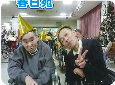
▲楽しいクリスマス会だったよあ～