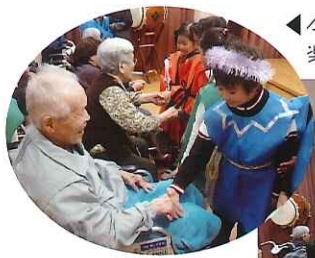
◀今日はありがとう 楽しかったよ!

利用者さんはこの日をとても楽しみにしておられ「本当に良かった。感動したよ。」と、たいへん喜ばれ、中には、その姿を見て涙を流される利用者さんもおられました。