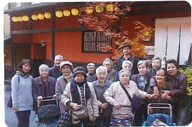
▶おいしい釜飯料理をお腹一杯食べました

利用者さんからは、「もみじが真っ赤できれいだね」と、紅葉がきれいで、たいへん喜んでおられました。