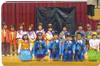
▼すてきな衣装を着た、演技派の子どもたち

リング・アキユラシーなど、いろんな方が参加でき、楽しめる内容となっております。大会終盤にはパン食い競走もあり、参加者全員がパンに目掛けて走っている姿が印象的で、とても楽しいスポーツ大会となりました。