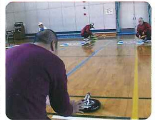
▶狙いを定めて、ソレ!

※カローリング氷上ではなく室内でカローリングを行うこと。アキユラシーフリスピのコントロールの正確さを競う競技。