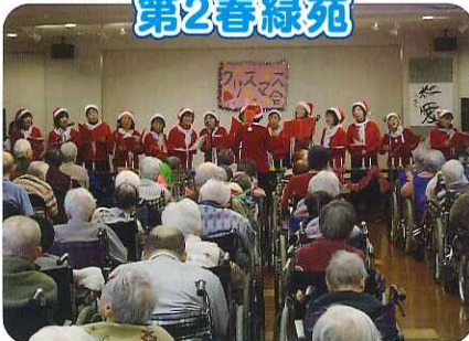
▲ボランティアさんによるクリスマスソングの合唱です