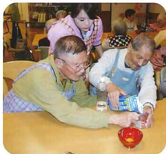
▲男でもやれますよ!

の時間に、みなさんと一緒に作ったおやつを食べています。次回は何を作ろうか?乞うご期待!