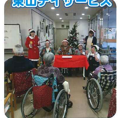
▲利用者さんと職員によるハンドベル演奏をお聞かせください