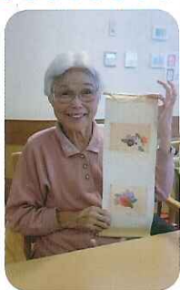
▲こんな感じに仕上がりました

ピンセットを使う細かい作業に取り組まれ、思い思いに作成しておられました。花の配置に悩まされながらも、できあがった作品はどれもすてきで、完成した作品を見てみなさんすてきな笑顔をしておられました。