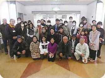
▲家族会のみなさん、ありがとうございました

大掃除終了後に、家族会のみなさんで撮った一枚です。今年もみなさん一丸となつてとよた苑を盛り上げていきましょう！