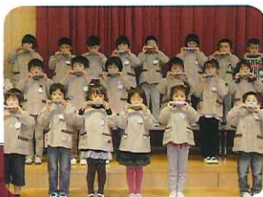
▲心に響くハーモニカの音色

幼児組は合奏・歌・劇を発表しました。舞台上上がった子どもたちは、たくさんの人に緊張した表情でしたが、元気いっぴいの歌や役になりきった姿を披露しました。みなさんからたくさん拍手を