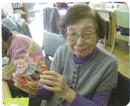
▶良い年を迎えられそうたわ😊