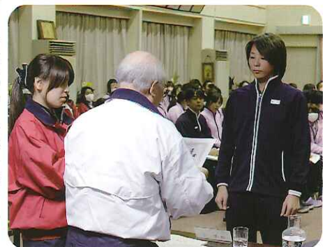
最優秀賞 おめでとうございます

サービス が提供で きるシス テムの構 築を目指 した成果 を発表し ました。 その中で も、入居 施設とい う環境下 で、利用者自身の意思と力で生活をする こと、「自活」とも言える暮らし作りを 目指すことに取り組んだ「特別養護老人 ホーム春緑苑」の「Mr.布袋」サークルが 最優秀賞を受賞しました。