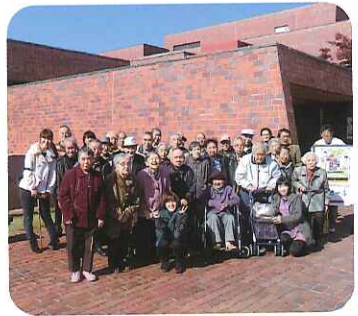
▲みなさん笑って、ハイチーズ!