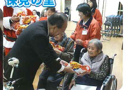
▲倉知会長よりクリスマスプレゼントをうけとり、にっこり！