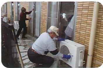
▶ピカピカになりました

皆様のおかげで、新年を気持ち良く迎えることができました。ご家族の皆様、ありがとうございました。