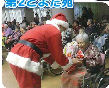
▲サンタクロースからステキなプレゼント！笑顔いっぱいです！！