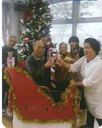
▲メリークリスマス！かんぱい！！