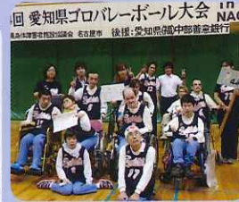
▲次こそは、優勝目指して頑張ります!

惜しくも優勝を逃し3位という結果になってしまいました。ただ、みなさんの表情はとても晴れやかで、充実感に満ちあふれていました。