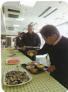
▲どれくらい食べられるかな?

バイキングということで、味の辛さ、「ツナ」「コーン」「きのこ」「なす」「ウインナー」などといった8種類の様々な具材を選ぶことができ、利用者さん