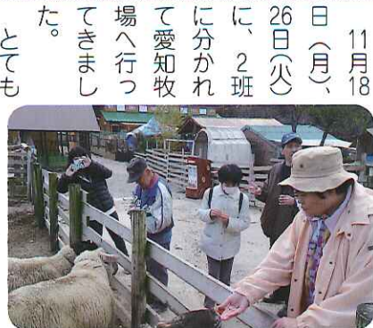
▶モコモコ気持ちいいね!

11月18日(月)、26日(火)に分かれて愛知牧場へ行ってきました。とても気持ちがいい天気です。動物たちものびのびとしており、馬や牛、羊などのたくさんの動物の背中をなでたり、エサをあげたりして楽しんでおられました。動物たちと間近でふれあい、驚くこともありました。ユーモラスな表情、かわいらしい仕草をする動物たちに癒された一日となりました。