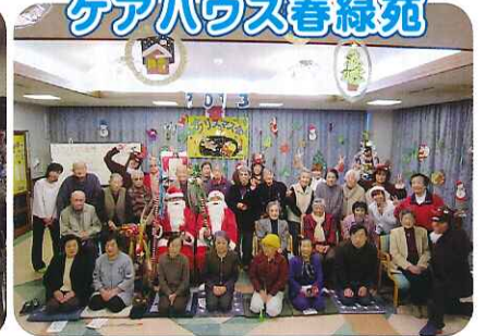
▲メリークリスマス