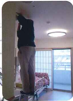
隅々まできれいにしないとね!