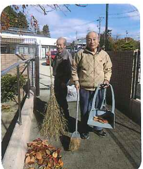
▲早く、葉っぱ落ちないかな?

桜の葉がいつぱい落ちてきていると、「掃き掃除するか?」と言って、いつも二人で落ち葉の掃き掃除をしてくださり、とても助かっています。