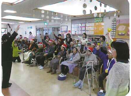
▲とてもきれいな音を奏でていました

デイサービスでは毎月第3木曜・金曜日に、ボランティアさんに来ていただき、ハンドベルクラブを開いています。クリスマス会での演奏発表会を目標に、みなさん必死に頑張っていました。