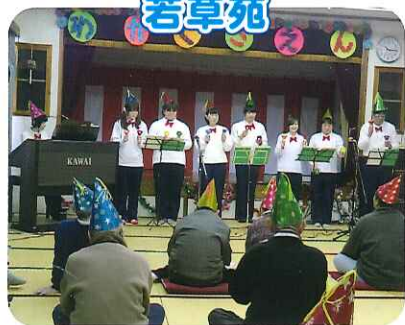
▲職員による演奏会は、大いに盛り上がりました