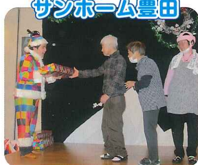
▲クリスマスプレゼントもらったよ～