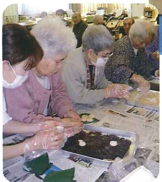
◀なかなかいい「あんこ」だね