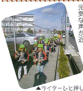
▲ライターひと押し火事の元!

年長組の子どもたちが保育園周辺を防火啓発巡回しました。「火の用心! マッチ一本火事の元!!」と拍子木に合わせた元気な声が近