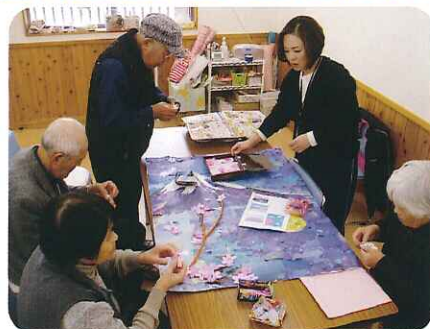
▲細かい作業も頑張りました! もうすぐ富士山が完成します!!