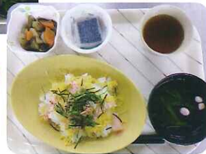
かにちらしと筑前煮