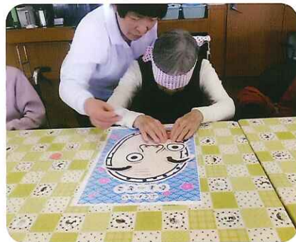
面白い顔ができ上がりそうです

新年を迎え、お正月遊びを懐かしんでいたと、デイサービスでは「福笑い」「双六」を行いました。