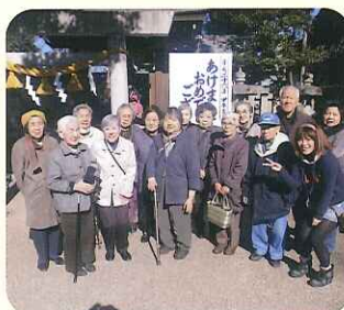
▲今年も良い事がたくさんありますように...

1月6日(月)、13名の利用者さんと初詣に行つて来ました。本殿での参拝の後、おみくじを引き、今年の運勢を占ったり、古いお札を返されたりと、思い思いに過ごしておられました。