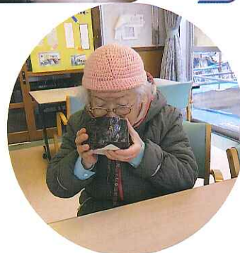
▲香りも味も抜群ね!!