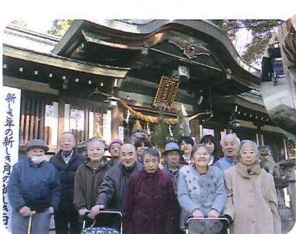
▲みなさん今年も元気でいてくださいね!