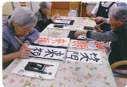
みなさんお上手ですね!