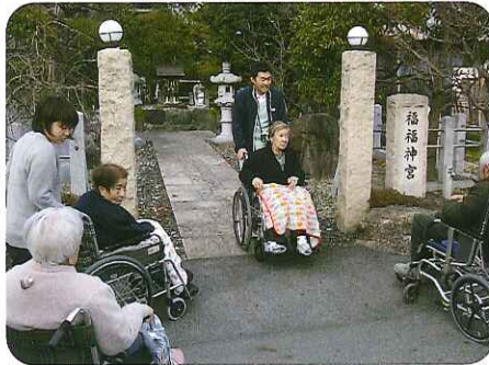
今年も良い年でありますように

もちつきのスタートです。「よいしょっ」のかけ声に合わせて、力強くもちをついていただきました。