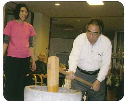
腰が入っています!

つきたてのおもちは、女性利用者さんが中心となり、慣れた手つきで丸められ、あんこ・きな粉・大根おろしもちなどにして召し上がっていただきました。できたてのおもちは、やはり格別だったようです。