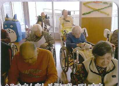
みなさん楽しそうにしています

ご紹介するユニットは4丁目2番地です。4丁目2番地は明るくにぎやかなユニットです。週に1回のリズム体操を楽しみにしておられ、声をお掛けするとすぐに会場へ向かわれます。歌を唄いタンバリンなどの楽器を使い、とても盛り上がっています。いつも楽しい歌声が聞こえ、職員も毎日が楽しみです。