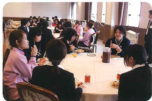
▲和やかな雰囲気の中、食事が行われました