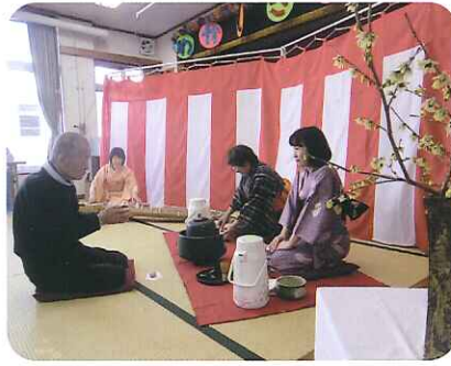
▲なかなかのお点前です

琴の生演奏、ロウバイの香り漂う中、新年らしい華やかな雰囲気味わっていただき、お抹茶をいただきました。