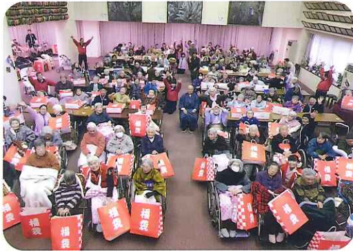
福袋もらったよあ