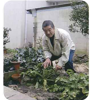
▲収穫が楽しみだね