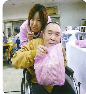
▲袋の中身は??おたのしみ(^.^)