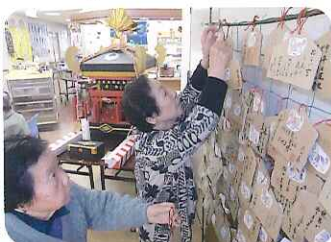
▲願い事が叶うといふですね!