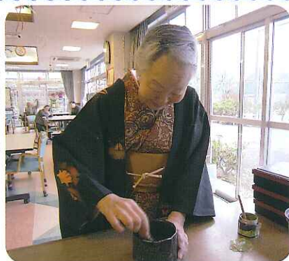
日本の伝統ですね!

1月1日(水)、食堂にて利用者さんにお抹茶を点ていただき、素敵なおもてなしで新しい1年を迎えることができました。