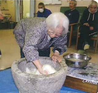
▲おいしいおもちができそうだね!!