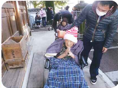
▲願い事が叶いますように!

神社の参拝にみなさん大喜び。笑顔で鳥居をくぐり、手を清めてからおさい銭を投げて願い事をしました。中には、声に出して願い事をする利用者さんもおられました。みなさん今年も元気で健康に過ごしましょうね。