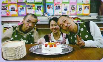
▲上手にケーキが作れたよ