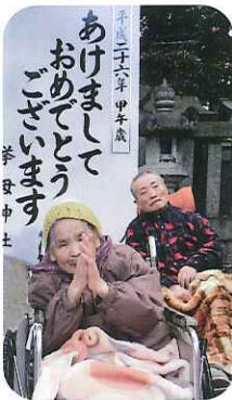
▲今年もみなさんで良い年にしましょうね