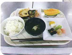
五目ごはん 松風焼き