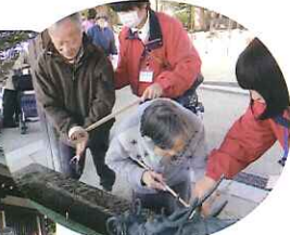
▲まずは、手を清めてから...

一年の無事を祈願し、おみくじを引いたり、お守りを購入したりしてお正月気分を楽しんでおられました。