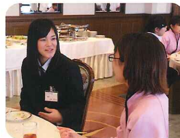
みなさん、先輩職員からいろいろなお話を聞きましたか? 😊