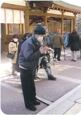
▶「今年一年、良い年でありますように...」