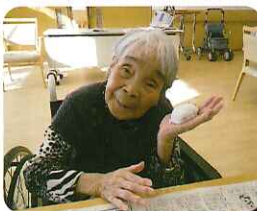
みなさん真剣です▶