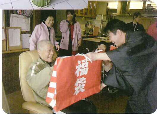
▶何が入っているか開けてのお楽しみです!