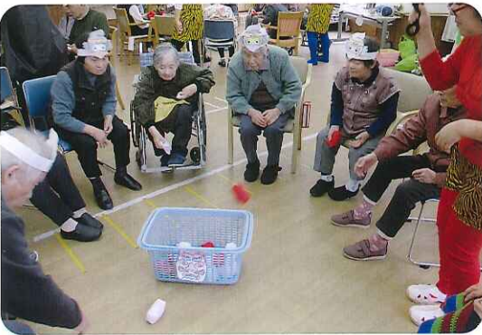
▶白熱した勝負でした

っこう難しいね。」などと、真剣な表情で挑戦し、とても楽しんでおられました。「スマイル9」の皆様、今後ともよろしくお願いいたします。