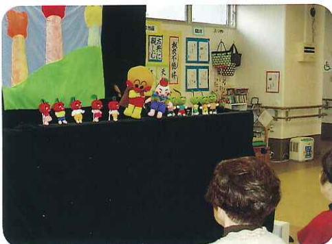
▶人気者のキャラクターも登場しました!