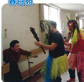
▲利用者さんは、とても楽しそうです!