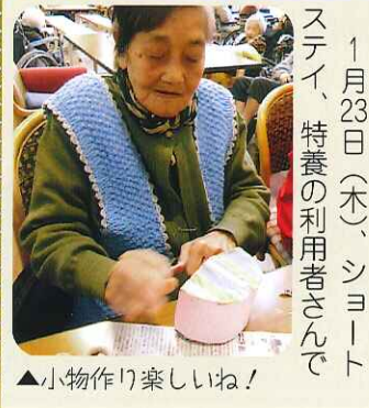
▲小物作り楽しいね!