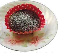
▲ふくらみできました き、愛情こもったチョコ蒸しパンは格別でした。