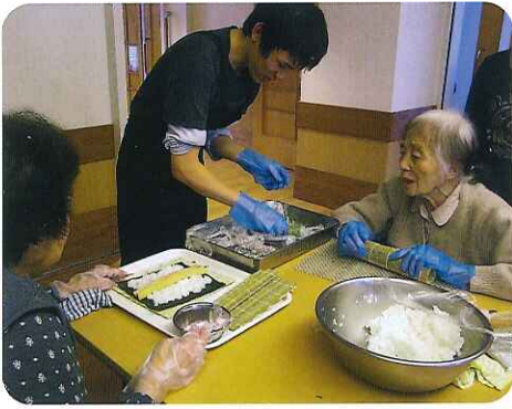
▶どんな具材を入れようかしら?