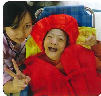
▲祝 これからもずっと笑顔です