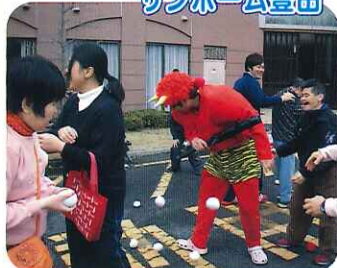
▲鬼は外で退治しないとね!