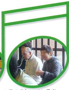
▲この曲知っている!!

みなさん心をこめて縫った花ふきんは、保護者の方やボランティアさんにも好評をいただいています。