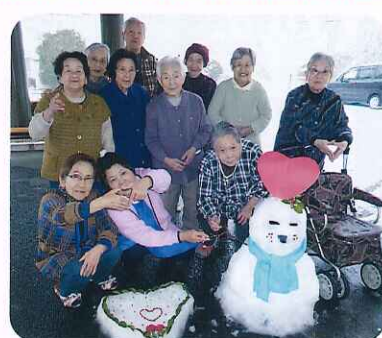
▲こんな感じの雪だるまが完成しました

2月14日(金)、雪景色を見に来た利用者さんと一緒に雪だるまを作りました。「雪ってこんなに冷たかったのね。」とこんなと降る雪にワクワクしておられました。バレンタインデーということもあり、雪だるまの頭にはハートを飾り、かわいらしい雪だるまが完成しました。