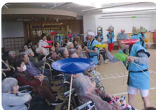
▶みなさん、なかなかお上手ですね!

っこう難しいね。」などと、真剣な表情で挑戦し、とても楽しんでおられました。「スマイル9」の皆様、今後ともよろしくお願いいたします。