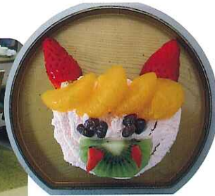
▲名付けて「鬼ロール」

ンパンマンとリンゴの国」という人形劇を披露してくださいました。 お二人で何役もこなし、BGMや台詞も臨場感たっぷり。利用者さんは童心にかえり、とても楽しんでおられました。また、来てくださるのを楽しみにしております。