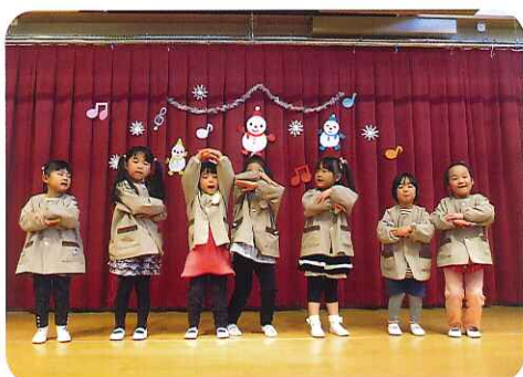
▲歌って、踊って高得点!

他にもあんパンなど、定番の商品も多数取り揃えております。是非、ご賞味ください。 けるのはキャラクターに扮した3人の審査員。優勝チームにはミッキーマウスに扮した園長先生から賞状をもらい、楽しい「ちびっ子のど自慢大会」となりました。