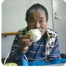
▶肉まん、おいしいよ!

今回のおすすすめは「肉まん」!! お菓子とは違いますが、肉まんを手にとり、利用者さんは満面の笑顔をしておられました。 今後喫茶クラブを盛り上げていきます。 ▶肉まん、おいしいよ!