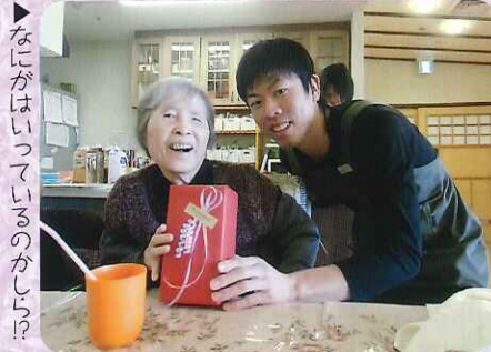
▶なにがはいつているのかしら!?