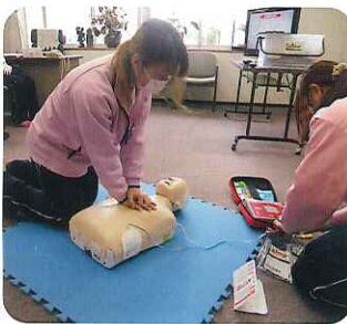
▲とても勉強になりました

2月6日(木)、豊田市消防本部の救急隊員の方に来ていただき、職員を対象に救命講習をしていただきました。 心肺蘇生法やAEDの使用方法について学ぶことができ、有意義な時間となりました。