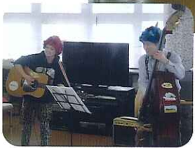
「ほっこりス」が節分を盛り上げてくださいました