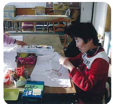
▲何色にしようかな~