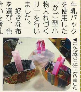
▲こんな感じに作りました

牛乳パックを使用した「かご型小物入れづくり」を行いました。 好きな布を選び、色合いを考えながら牛乳パックに布を貼っていきましました。とても楽しんで作成しており、一つ完成すると「もう一つ作りたい。」と小物入れづくりに熱中されている方が多くおられました。 次回は、違う作品づくりに挑戦しましょうね!!