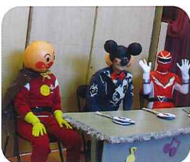
▲キャラクターの審査員に子どもたちは大喜び

0歳・1歳児の子どもたちは音楽に合わせて踊り、2歳から5歳児の子どもたちはグループに分かれ、得意な曲を元気いっぱい歌いました。