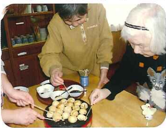
▶みなさんひっくり返すの上手ですね!

以前から、「やりたい!」という声が多く上がっており、日程が決まり当日になると、準備を始める前から、なんだかみなさん落ち着かない様子でした。キャベツやタコなど様々な具材を入れ、たご焼きの焼き具合を確認し、たご焼きをひっくり返したりして、みなさんとても楽しそうでした。