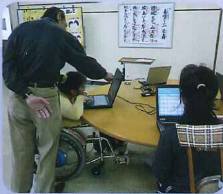
▲昨年は年賀状をパソコンで作りました。今年は何に挑戦しようかな。

春日苑ではボランティアの先生の協力のもと、様々な活動が行われています。今回は毎月1回日曜日に行われているパソコン教室を取り挙げました。パソコン教室に参加されている利用者さんは、毎回とても真剣な表情で取り組まれています。