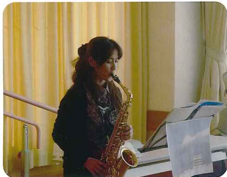
▶素敵な音色が苑内に響き渡ります

有名なジャズの曲を演奏していただいたときは、みなさん体が自然と揺れており、音に合わせてリズムをとられていました。とても有意義な一日となりました。