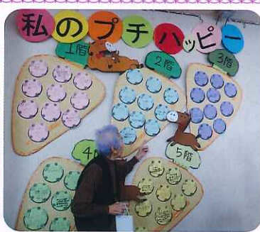
▲みなさん楽しそうに書いていました

「私のプチハッピー」と題し、利用者さんに去年楽しかったこと、うれしかったことを書いていただきました。日帰りバスツアーへ出かけたことや1年間健康に過ごせたことを感謝する言葉が多くみられました。 今年も職員一同、利用者さんにより多くのプチハッピーを感じて生活していただけるよう頑張っていきます。