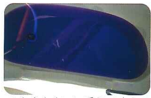
▲なかなかいい香りですよ!

ラベンダーには、鎮静・リラックス効果が あり、最高入浴を提案させていただきます。 ぜひ一度みなさんも至福のひとつきを過ごしませんか?