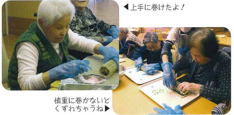
慎重に巻かないとくずれちゃうね▶

ワシの頭と柎 つらね を飾っていたね。「恵方巻きの具材は卵焼き、甘く煮た干びょう、キュウリ、でんぶ、シイタケ、煮た魚だね。でんぶは多く入っていた方がおいしい。」などといった味自慢をされる利用者さんもおられました。