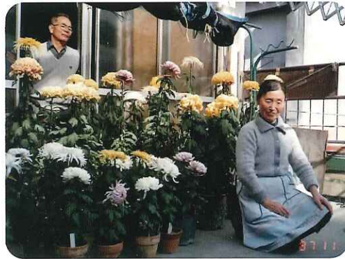
▲奥様との思い出がいっぱいです

「26歳で嫁さんをもら ったこと。」と即答されました。 とても仲の良かった夫婦だった そうで、奥様との思い出は言葉 では言い表すことができないほ どたくさんあるそうです。