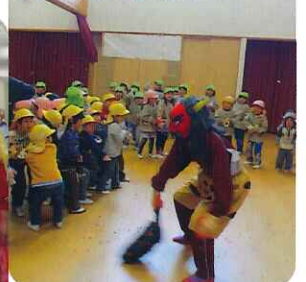
▲子どもたちは必死に鬼退治!