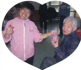
▲いつもありがとう!!

女性利用者さんからお菓子をプレゼントされた男性利用者さんは、みんな大喜び。お菓子よりも、もっともっと、あまーいひと時となりました。