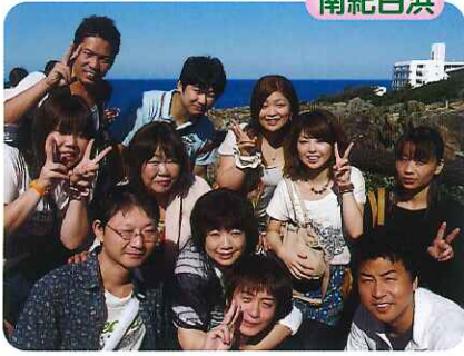
▲みなさん、とても楽しそうです