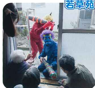
▲鬼は内には入らんぞ!