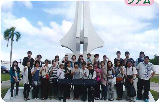
▲とてもいい天気ですね!