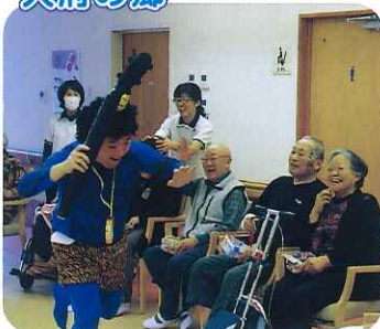
▲利用者さんの笑顔がすてきですね