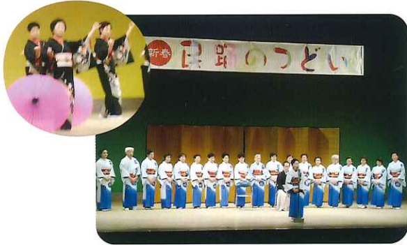
▲とっても華やかでした