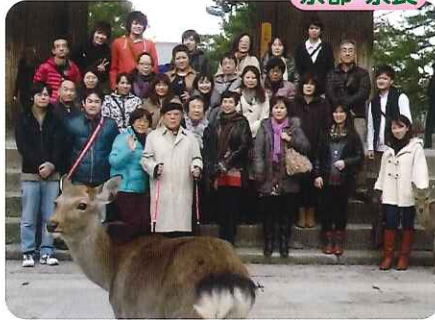
▲シカと一緒にハイチーズ!