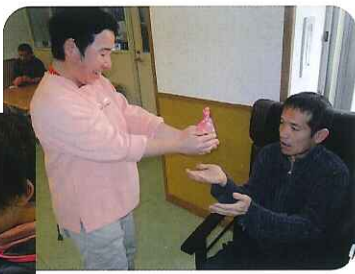
←さっそく食べてね♪

今年プレゼントするお菓子は、ガトーショコラです。大量の材料を混ぜるのには苦労しましたが、男性利用者さんの喜んでる姿を思い浮かべながら、心を込めて作りました。できあがったお菓子はきれいにラッピングし、お店のお菓子に負けな