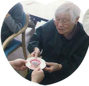
▲義理チョコじゃないよ♡