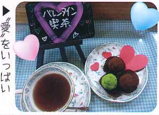
▶愛をいっぱい詰めこみました

ラベンダーには、鎮静・リラックス効果が あり、最高入浴を提案させていただきます。 ぜひ一度みなさんも至福のひとつきを過ごしませんか?