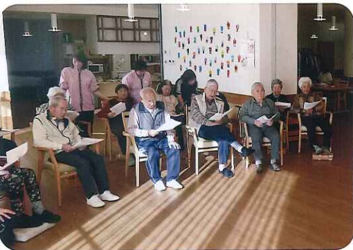
▲みなさんの歌声もなかなかです!