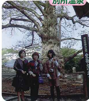
▲指定文化財の前で記念撮影