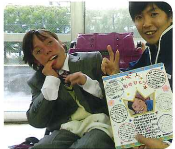
▲祝 大人への仲間入りです

いをし、花束と手紙を贈りました。昼食ではお赤飯、天ぷら、ぜんざいを食べ、みなさんでおいをしました。