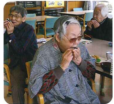
▲あれ?今年の恵方はどっちだっけ～?!

職員扮する鬼が会場に入ってくる、みなさん豆をぶつけて応戦していました。「鬼は外!」と元気いっぱい全力で豆をぶつける利用者さんいれば、「鬼さんも一生懸命生きとるでな。」と優しく豆を投げる利用者さんもおられ、笑いにつつまれた楽しい節分会となりました。