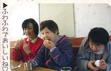
▶ふわふわおいしいね♡

早くも来月のスイーツを楽しみにしている利用者さんもおられ、毎月楽しい喫茶の時間を過ごせます。