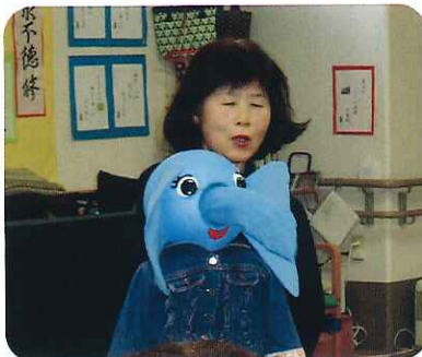
▲飛び出したゾウの鼻にみなさん大爆笑