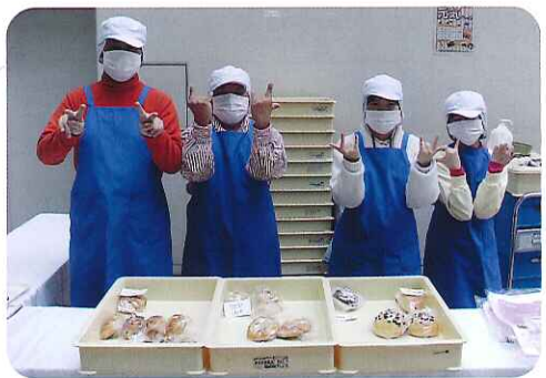
▲新作パンが増えました～