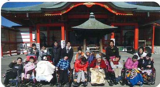
▲今年の抱負をみんなて報告しました

利用者さんと一緒に、成田山へ行って来ました。当日は快晴で、上から見る景色は壮観でした。参拝後は、みんな中華料理を食べ、心もお腹も満たされたりとなりました。