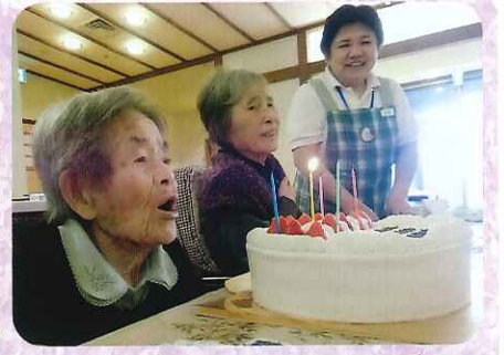
▲ハッピーバースデートゥーユー月

毎月各ユニットで誕生日会を行っています。今回は加茂・旭ユニットの誕生日会の様子をお伝えします。1月が誕生日の利用者さんは2名おり、プレゼントとケーキを用意してお祝いしました。プレゼントをもらい、ケーキを食べた。ニコリされ、皆さんの笑顔を見ることができました。いつまでもお元気でいてください。