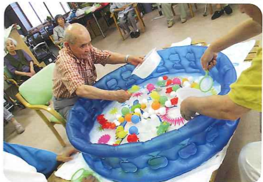
▲どれだけすくえるかな？

夏といえば夏祭り！7月31日(木)から8月3日(日)までの4日間、夏祭りを行いました。昔とった杵柄でバチを振るう利用者さんや、歌いながら太鼓をたたいた利用者さん。鳴子を鳴らしながら、太鼓の音に合わせて、みんなで盆踊りを楽しみました。威勢よく鳴子を鳴らしていたため、曲が終わっているのに気付かない利用者さんの中にはおられました。盆踊りを踊った後は、金魚す