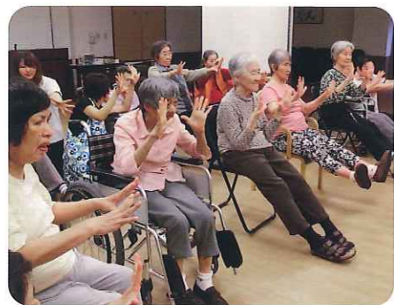
▲今日も一日元気に過ごしましょう

7月13日(日)、愛知医科大学の学生さんがボランティアに来てくださり、コンサートを開いてくれました。バイオリンにフルート、サクソにトランペットといった様々な楽器から聞こえてくる音