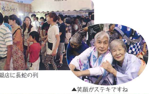
▲模擬店に長蛇の列 ▲笑顔がステキですね