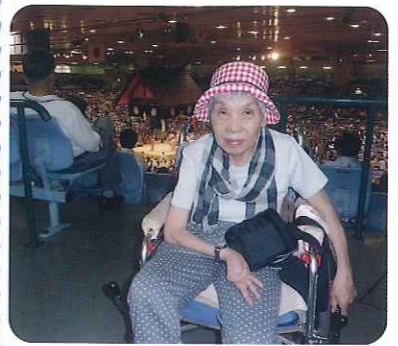
▲実は豪栄道の大ファンなんです！