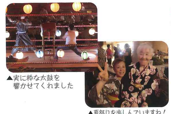
▲実際に粋な太鼓を響かせてくれました ▲夏祭りを楽しんでいますね!