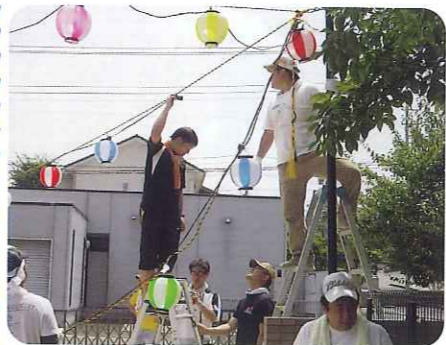
▲高さはこれくらいかな？

準備をするにあたり、職員だけでは手が足りず、トヨタSXC会のみなさんや利用者のみなさん