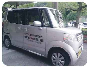
▲利用者さんより、新車のN-BOXを寄贈していただきました。大切にさせていただきます。

7月24日(木)、一宮市の真清田神社「七夕祭り」へ利用者さんと一緒に行ってきました。利用者さんは楽しそうに「七夕祭り」を満喫していました。ちなみに「一宮市」という名前の由来は尾張国一宮「真清田神社」に由来するそうです。