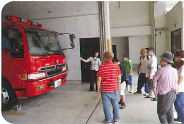
▲消防車って大きいな

体験中は表情や体をこわばらせていました。体験が終わった後は「怖かった」という感想が出るなど、災害の恐ろしさや身の守り方をしっかりと学ぶ貴重な経験となりました。