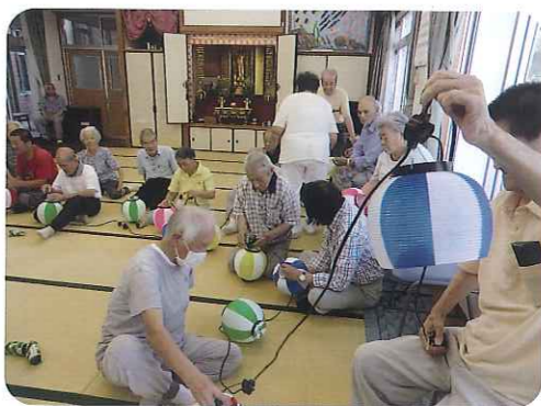
▲ちよちゃんの準備は大変だね