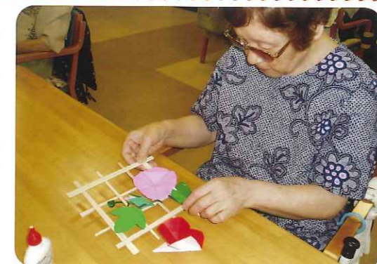
▲どこにつけようかな？

くいや射的などを行い、童心に返って夢中になって楽しんでおられました。「みたらし団子」「たご焼き」「チョコバナナ」といったデザートも食べていただき、利用者さんの頬がゆるんでいました。夏祭り気分を存分に味わっていただくことができました。