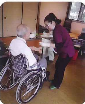
▲口の中を見させていただきますね

歯科協会のみなさんは様々な相談に応じてくださり、とても参考になりました。利用者さんは口腔の問題や正しいケアの仕方を教わり、「早速、今日教わったことを実践するわ。」と、とても有意義な時間を過ごしておられました。