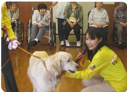
▲かしくって、利口だね!

7月24日(木)、桜木工房様のご協力をいただき、地域交流センターにおいて「アニマルセラピー」を開催しました。 小さな犬から大きな犬まで5頭のよく訓練された犬たちが集まり、利用者さんは犬と触れ合っていました。 大好きでない利用者さんは、最初は恐る恐る犬と接していましたが、慣れてくるにつれ、たくさんの方の笑顔を見せてくださり、優しい犬たちに癒され、和やかな時間を過ごすことができました。