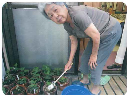
▲毎日の水やりは、日課です

利用者さんと一緒に大菊作りに挑戦しています。 講習を受けた職員や菊作りに詳しい利用者さんが中心となり、鉢に苗を植え、毎日水やりをし、愛情込めて育てています。それぞれの鉢に利用者さんの名前を書いているため、自分の鉢に話しかける利用者さんの姿も見られます。 これからの成長がとても楽しみです。大きな菊が咲いた頃、また、みなさんにお知らせしますね。