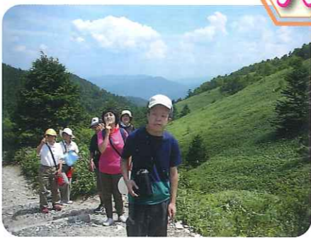
さあ、気合を入れて登るぞ！

ロープウェイとリフトを乗り継ぎ、バスで登山口を目指します。リフトに乗るときは、こわばった表情をしていた利用者さんも、いざ乗ってみると「ヤツホ