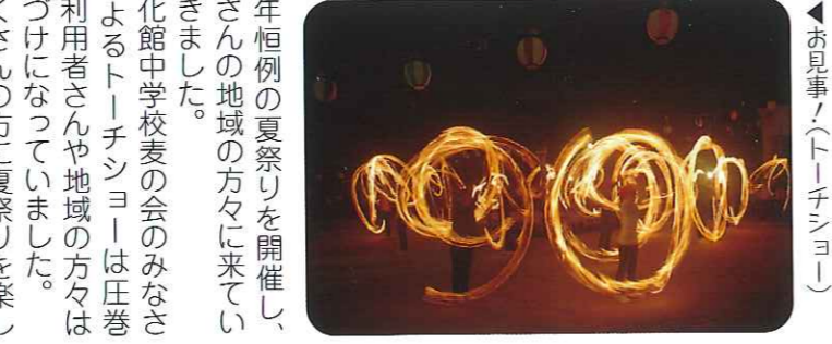
▲お見事！(トーチショー)

毎年恒例の夏祭りを開催し、たくさんの方々に来ていただきました。崇化館中学校麦の会のみならず、利用者さんや地域の方々もたくさん参加してくれました。たくさんの方に夏祭りを楽しんでいただき、盛会のうちに終わることができ、地域の皆様を支えられていることを改めて実感した夏祭りとなりました。