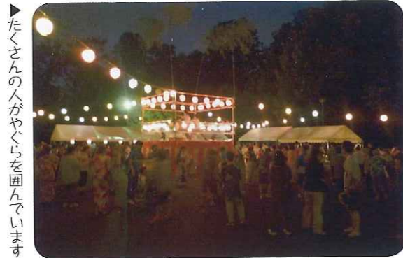
▲たくさんの方がやぐらを囲んでいます