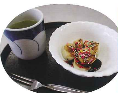
▲色とりきれいなチョコバナナ

くいや射的などを行い、童心に返って夢中になって楽しんでおられました。「みたらし団子」「たご焼き」「チョコバナナ」といったデザートも食べていただき、利用者さんの頬がゆるんでいました。夏祭り気分を存分に味わっていただくことができました。