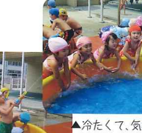
▲冷たくて、気持ちいい! 狙いを定めて...それっ!

カラフルな水着に着替えた園児たち。準備体操をしっかり行い、シャワーを浴び、プールの周りに整列し、水をかけて、いよいよプール遊びの始まりです。