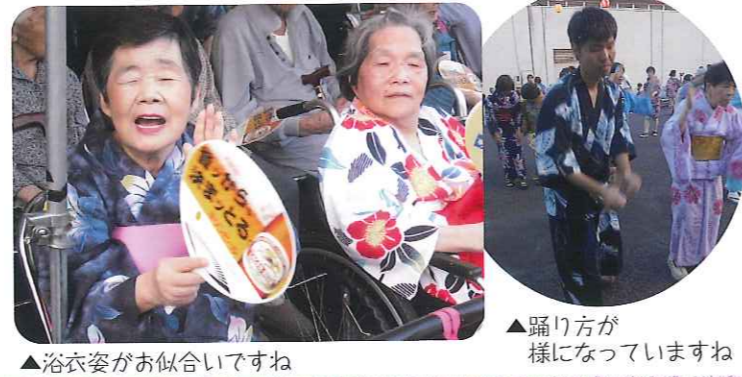
▲浴衣姿がお似合いですね ▲踊り方が様になっていますね

当日は、天候が心配されましたが、心地よい風が吹く中、無事、合同夏祭りを開催することができました。夏祭りを満喫されている利用者さんの表情はとても明るく、ちょうどうちの灯りが利用者さんを優しくつつんでいました。やぐらの上では、ポランティアさんが太鼓をたたき、やぐらの周りには、踊り子さんや利用者さんが楽しく踊り、夏を身近に感じることができました。