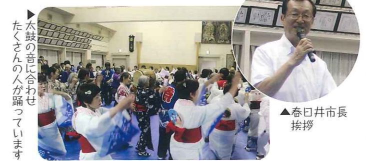
▲太鼓の音に合わせたくさんの方が踊っています ▲春日井市長挨拶

夏の風物詩といえば夏祭り。しかし、当日はあいにくの雨模様。足場のわるいなかにもかかわらず、1,000人を超える方々が来場され、夏祭りは大いに盛り上がりしました。さくら太鼓様による太鼓演奏で、踊り子さんや利用者さん、地域の方々などが「春日井よいこ」「郡上節」などの曲に合わせて楽しそうに踊り、模擬店では、香ばしい香りにたくさんの方々が並び、大いに盛り上がっていました。