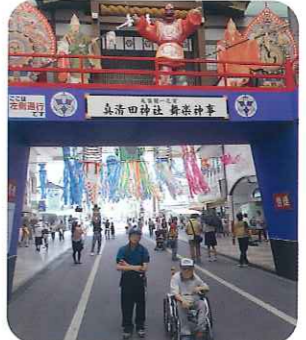
▲楽しい1日になりますように！

熱気がすこく、関取がぶつかり合う迫力に利用者さんは大興奮！楽しいひとときを過ごしておられました。