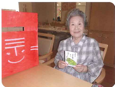
▲こんな感じに仕上がりました

完成した絵手紙は、職員手作りのオリジナル切手を貼り、デイサービスお手製のポストに投函。みなさんの大切な人へ、夏を彩る素敵な暑中見舞いが届いたことでしょう! 受け取られた方の笑顔が浮かびますね。