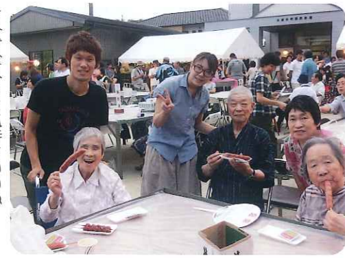
▲外で食べると気持ちいいね

今後とも地域とのつながりを大切にし、地域のイベント等利用者さんとの参加を増やしていきます。