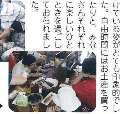
▲とれるかな? おいしい~

まずは、名物の鮎を使った昼食をおいしくいただき、旬の味を堪能しておられました。毎年、利用者さんが一番楽しみにしている鮎の掴み取りでは、必死に鮎を掴もうと追いかけている姿がとても印象的でした。自由時間にはお土産を買ったりと、みなさんそれぞれに楽しいひとときを過ごしておられました。