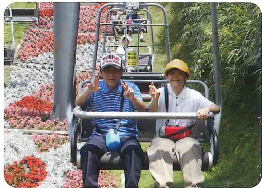
天気良くて、気持ちいいね！

ー！と叫び、すっかり笑顔が戻っていました。山頂までの道は険しかったですが、みなさん無事に登頂。今年の夏の最高の思い出になりました。