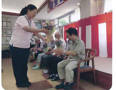
▲おめでとうございます

7月は8名の利用者さんが誕生日を迎えました。平均年齢85.1歳。まだまだ、みなさんお元気です。昼食に「うなぎの長焼き」を食べ、みなさん「おいしい。」と大満足。いつまでもお元気でいてください。