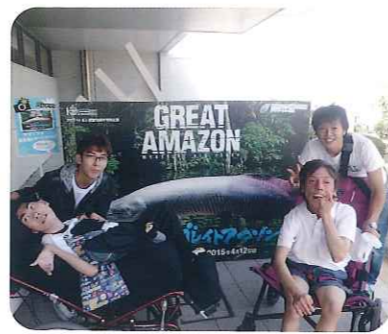
▲なかなかの迫力でした☆

7月23日(水)、「アクア・トト岐阜」に行ってきました。アマゾン展が開催されており、アマゾンの淡水生物の迫力に圧倒されました。