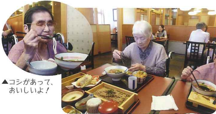
▲コシがあって、おいしいよ!