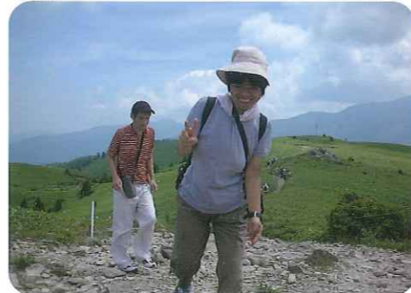
▲山頂まであと少し!!

ー！と叫び、すっかり笑顔が戻っていました。山頂までの道は険しかったですが、みなさん無事に登頂。今年の夏の最高の思い出になりました。