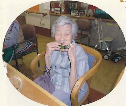
▲スイカをがぶりっ!

夏といえばスイカ。夏の風物詩をみなさんに味わっていただくこと、おやつにスイカを食べていたかったです。「甘かったわ!」「もっと食べたい!!」など、利用者さんから