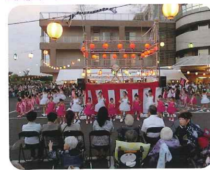
▲子どもたちの元気なおいでん踊り