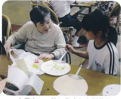
▲中学生と一緒にうちわを製作中