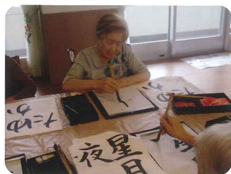
▲みなさん、真剣そのものです

利用者さんの希望で、一緒にうどんやそばを食べに行っていました。 麺類が大の好物という利用者さんが参加され、中でも、おそばが大好きという利用者さんは、「長野県 さくらんぼ の更科そばが一番最高」とおっしゃっていました。 みなさん麺類の中でも好物はそれぞれ違いますが、おいしそうにうどんやそばを食べている姿は、とても幸せそうでした。