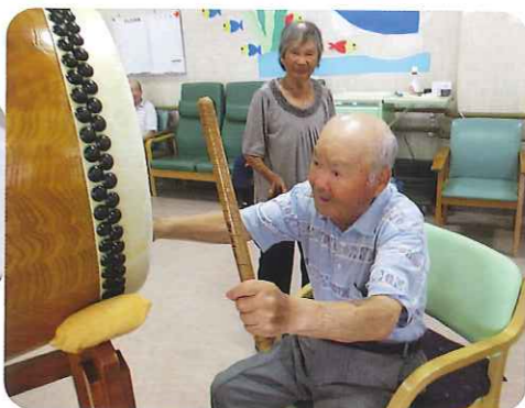
▲太鼓に合わせて踊ろう！