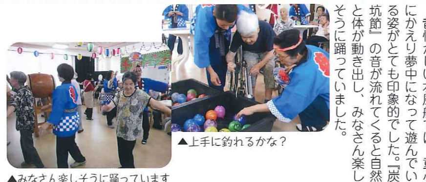
▲みなさん楽しそうに踊っています

デイサービス 笑顔に包まれた納涼祭り 8月5日(火)・6日(水)、「納涼祭り」を開催しました。他にも水風船釣りやビンゴ大会などで利用者さんに楽しんでいただき、模擬店では、焼きそば、フランクフルト、わらびもち、アイスなどたくさんのお店が並び、盛りだくさんの内容でした。昔懐かしい水風船では、童心にかえり夢中になって遊んでいる姿がとて印象的でした。「炭坑節」の音が流れてくると自然と体が動き出し、みなさん楽しんで踊っていました。