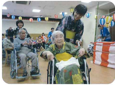
▲踊りもみなさんお上手ですね！

夏祭りと言えば、欠かせないのが模擬店。焼きそばや助六、竹寒天などを用意し、心もお腹も満たしていただきました。利用者さんはとびっきりの笑顔で、「今日はとても楽しかったです。」と、言っておられました。初めての夏祭りでしたが、大いに盛り上がった夏祭りとなりました。