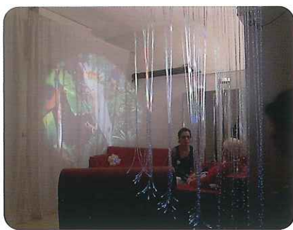
▲スヌースレンセラピーを受けている利用者さん

フランスの施設では、身体的な介助と入居者のQOL(生活の質)向上を目的とした「アクティビティ」が重要視されていました。各種レクリエーション、小集団活動(編物など)、児童や地域住民との交流、各種セラピーが週間プログラムとして組まれ、そのなかでもセラピーでは、五感を刺激するスヌースレンセラピーや浴槽セラピー、庭セラピー等が行われていました。