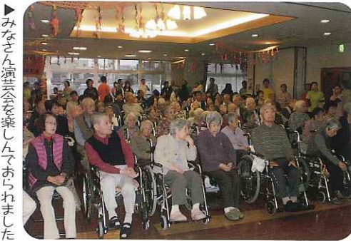
▶みなさん演芸会を楽しんでおられました

1年間の写真や展示物、「食のタイムトラベル」と題して、大正から平成にかけての懐かしい食べ物を模擬店にて提供し、楽しんでいただきました。また、演芸会では、和太鼓の演奏や腹話術、踊りや歌などをご覧いただき、大いに盛り上がった文化祭となりました。