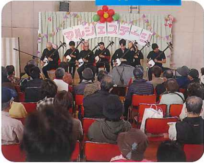
▶三味線の演奏を楽しんでいます