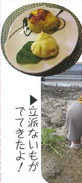
▶立派ないもがマてきたよ!

土を掘ってみると、大きく育つたいもが顔を出し、ていねいに掘り出し、みなさん大喜び。27日(月)には、収穫したいもを使っておやつを作りました。「自分たちが育てたおいしいもはおいしいね。また、手作りのおやつもなかなかいいね。」と、みなさん、笑みを浮かべながらおいしそうに食べておられました。来年の収穫祭も楽しみです。