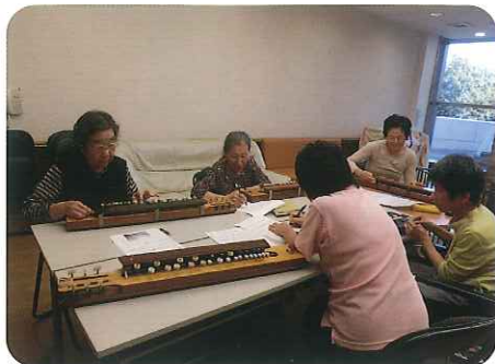
▲みなさん、一生懸命練習に励んでいます

見たことのある楽器とはいえ、いざ演奏となるとみなさん悪戦苦闘しておられ、弦を弾くのも一苦労でした。しかし、先生の上手なご指導により、少しずつ馴染みのあるメロディーが弾けるようになると、みなさんから笑顔がこぼれていました。耳慣れた歌を口ずさみながら大正琴に触れ、充実した時間を過ごしておられました。いつかみなさんで、一曲奏でられるといいですね。