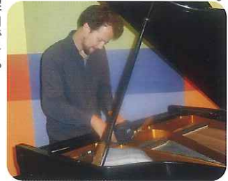
視覚障がいをもつ調律師

されておりました。このセンターを卒業して働いている人にも会えたことも印象に残っているひとつの理由です。 ②日本の福祉との違いは？ 日本の福祉は障がい者の中でも、法体系で区分や対象者など細かく分かれておりますが、デンマークでは、何らかの保障を必要とするすべての人が対象になっており、細かく区分されていませんでした。 イギリスでは、日常生活を送ることを阻む重大で長期的な身体的、精神的な障がいを持つ人が対象となっていました。 ③日本の施設との食事の違いは？ 施設によってはお弁当を温めて利用者さんに提供していることに驚きました。 ④日本と比較し、地域の伝統や風習の違いは？ デンマークでは、18時ごろまでしかお店は開いておらず、「働くときは働く、休むときは休む」といった体制がしっかり確立されておりました。介護の現場でも、労働時間については、しっかりされておりました。 ⑤一番印象に残った観光地は？ 場所…大英博物館(イギリス)