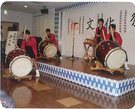
▲迫力のある太鼓演奏