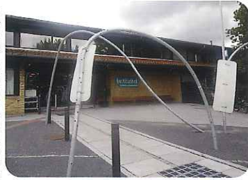
視覚障がい者のための訓練施設

デンマークでは、個々の持っている障がいによって通う施設が決まっており、異なった種類の施設の多さに驚きました。そのなかで、自閉症の子どもが通う学校と視