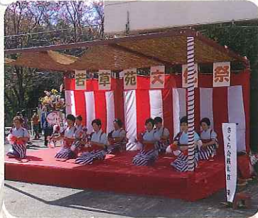
▲さくら会銭太鼓様