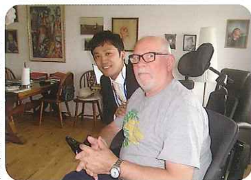
▶利用者さんと記念撮影

③日本の施設との食事の違いは? 訪問先の施設では、ナイフとフォークがテーブルにセッティングされており、コース料理のように外食気分を味わえるような食事形態となっております。また、施設内に厨房を持っている施設は少なく、外部委託をしている施設がほとんどでした。