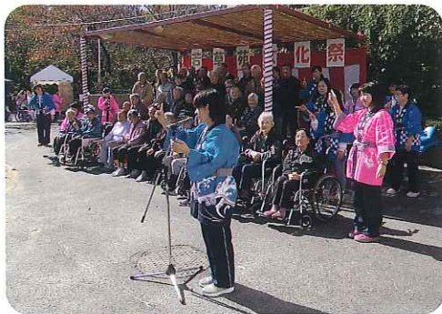
▲みなさん緊張しながらも上手に歌いぎりました

「6」さんによる歌のパフォーマンスや「愛知県立豊田高等学校」さんによる歌のパフォーマンス、さくら会銭太鼓さん、「豊田殿姫チンドン」さんのパフォーマンスで大いに盛り上がりました。今後、地域に根ざした開かれた施設を目指していきます。たくさんのご参加ありがとうございました。