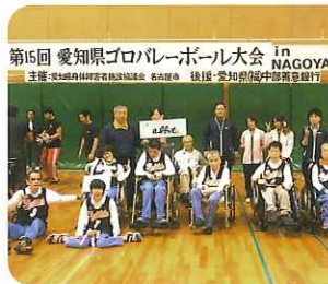
▲何はともあれお疲れ様でした

「ツの秋」ということでボウリン グを行い、白熱した戦いが繰り 広げられ、たくさんの笑顔を見 ることができました。 突如現れた「謎のコスプレさ ん」。利用者さん共々一同大笑 いで、たいへん盛り上がった一 日となりました。