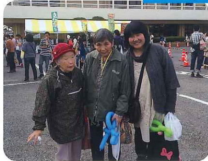
▶ケアハウスグループホームの利用者さんと一緒に記念撮影、ハイタッチス！