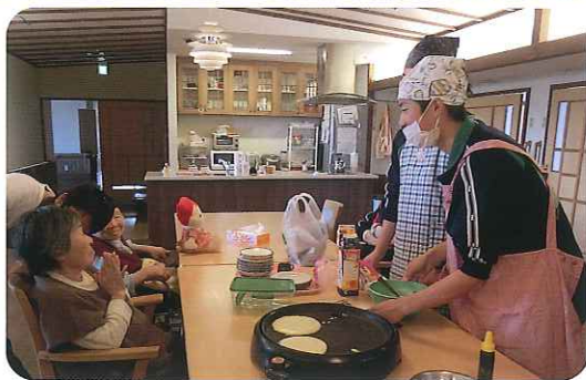
▲おいしく作りますね!

11月11日(月)、トヨタ工業学園の学生さん24名が交流事業の一環として来苑されました。