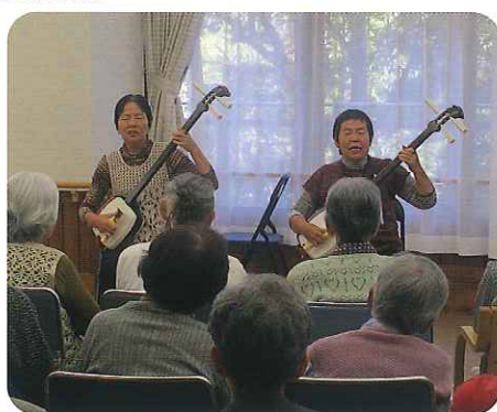
▶演奏にも迫力がありますね

大きな声で一緒に楽しく歌っておられました。「げんきの会」の方々からパワーをもらい、笑顔あふれる一日となりました。