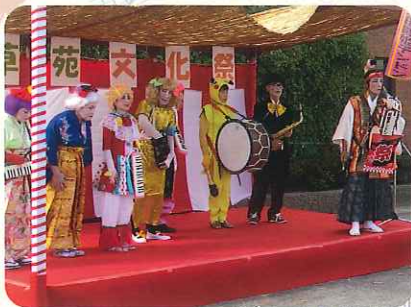
▲豊田殿姫チンドン様