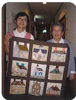
▲仕上がりパッチリです

利用者さんと一緒にパッチワークのタペストリーを作りました。小さな布を丁寧に縫い合わせピースを作り、そのピースを9つ合わせて大きな作品にします。その後、芯と裏布を付けてキルティングして完成です。シックな色合いの作品の出来栄えにみなさん大満足。とても