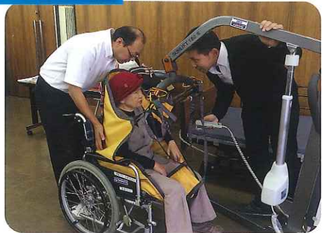
▶緊張しながらも疑似体験

演芸会を見たり、介助犬との触れ合い、疑似体験など積極的に挑戦、楽しみながらも色々な知識を得ることができました。利用者さん同士の交流も深めることができ、有意義な一日となりました。