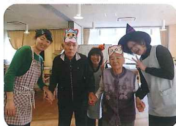
▶みなさん、仮装姿もなかなかです◎

10月の最終週にハロウィンパーティーを開催しました。利用者さんは手作りのお面を被り、職員は仮装をし、ハロウィンパーティーは大盛り上がり。ゲームでは、見つけたかぼちゃの番号札で、すてきなプレゼントがもらえるという宝探しを開催。みなさん、宝探しに熱が入り、必死にお宝を探していました。