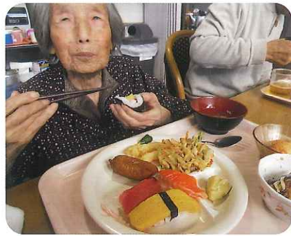
▲待った分、おいしいね!

今回も恒例のバイキング料理を行いました。料理は、握り寿司に天ぷらなど品数豊富で、おいしそうな料理を前に「まだか、まだか」と楽しみに待たれている利用者さん。人気の料理はもちろ握り寿司。とよた苑の畑で収穫したさつまいもも天ぷらでお出しし、利用者さんに大好評でした。食事をしているときの利用者さんの笑顔がとても印象的でした。