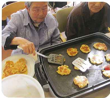
▲焼き加減はそろそろかな?