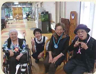
▲みなさん、とても楽しそうですね◎