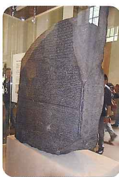
▲ロゼッタストーン

理由…たくさんさんの歴史的な物が展示されており、入館料が無料で気軽に入れるようになっておりました。 博物館のなかで、展示物の絵を描くことや写真撮影をすることも認められており、様々な時代の歴史的な物を見ることができ、過去に生きた人々の生活や技術、思いを知る事ができました。そのなかでも、ロゼッタストーンを見る事ができたことに感動しました。