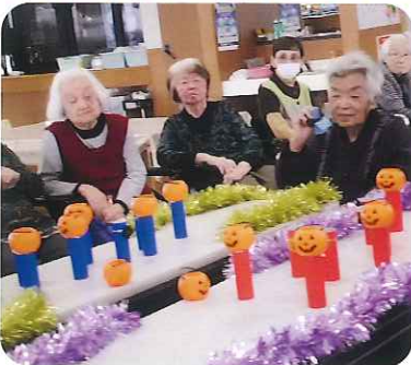
▲みなさん、楽しく参加していました

10月に八回ワインパーティーを行いました。利用者さんには、あまり馴染みのない八回ワインですが、この時期に外国で行われる収穫のお祭りであることや、子どもたちにお菓子を配る習慣があることなどを説明するうちに、「外国にも収穫を祝うお祭りがあるのね。」など、すっかり外国のお祭りに親近感をもたれた様子でした。