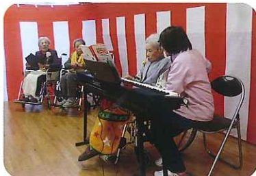
緊張しながらも上手に弾くことができました

初めてとなる文化祭でしたが、利用者さんやご家族など数多くの「笑顔」を見ることができました。緊張しながらも上手に弾くことができました。