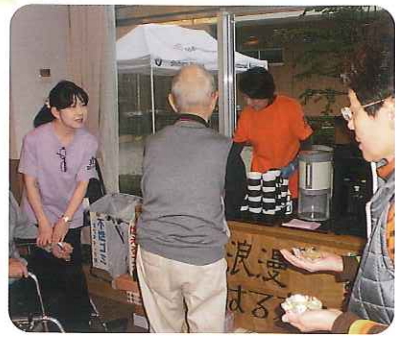
▲いらっしゃいませ!

11月1日(月)、「文化祭」を開催しました。今年の特テーマは「食」。利用者さんやそのご家族様など、400名余の方が参加してください、この日のために準備した各階の