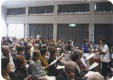
▲みなさん真剣に聞かれていました