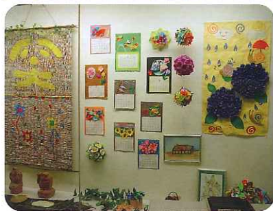
▲数多くの作品を展示させていただきました