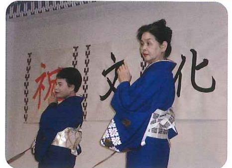
▲すてきな踊りにみなさん魅了されていました

11月1日(月)、「文化祭」を開催しました。今年の特テーマは「食」。利用者さんやそのご家族様など、400名余の方が参加してください、この日のために準備した各階の