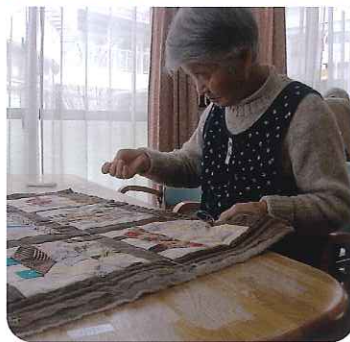
▲集中して取り組まれています

利用者さんと一緒にパッチワークのタペストリーを作りました。小さな布を丁寧に縫い合わせピースを作り、そのピースを9つ合わせて大きな作品にします。その後、芯と裏布を付けてキルティングして完成です。シックな色合いの作品の出来栄えにみなさん大満足。とても