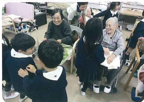
▲いい子だねえ。元気だねえ。