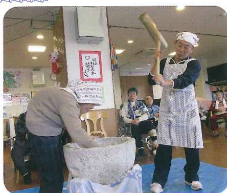
▶返しが大事なのよ!