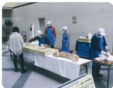
▲おいしいパンがいっぱいですよ〜