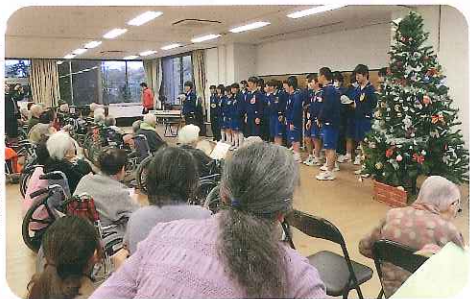
▶子どもたちが施設に遊びに来てくれました

もちろん、みなさんに来ていただくだけでなく、地域行事などにも積極的に利用者さんと一緒に参