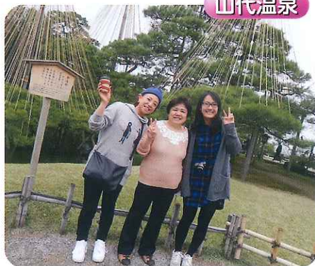
▲さすが、文化財指定庭園兼六園！すばらしかったです!!