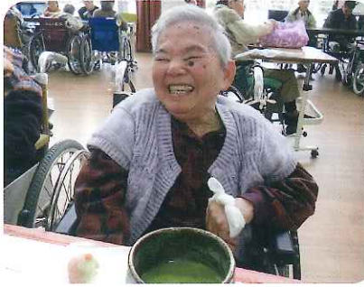
▲すてきな笑顔ですね！