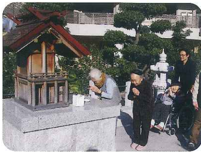
▲今年も一年、良い年でありますように...