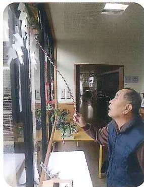
▶これを鳴らせばいいのかなー?

鐘を鳴らして参拝し、絵馬に願い事を書いて、お正月気分を存分に感じていただきました。背筋を伸ばしてお参りされる利用者さんの姿に、新しい一年への決意が感じられ、たいへん清々しいひとときでした。