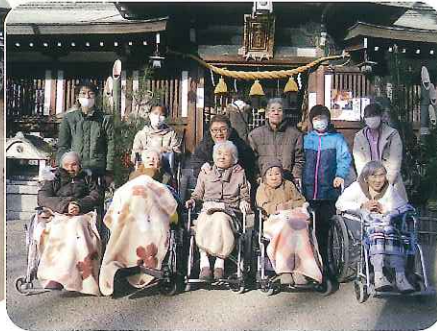
▲今年もよろしくお祈りします

新年の挨拶から始まり、お楽しみの福袋配り、書初めに初がま、初詣とお正月行事満載でした。