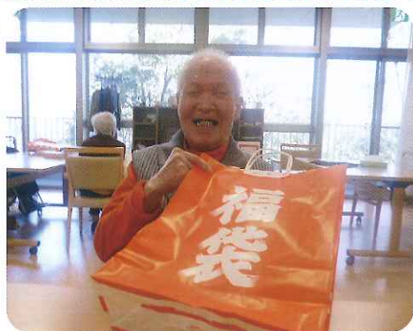
▶福袋もらったよ！ありがとう!!