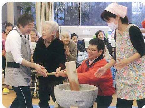
▲もちをつくときは、こうやってつくんですよ！