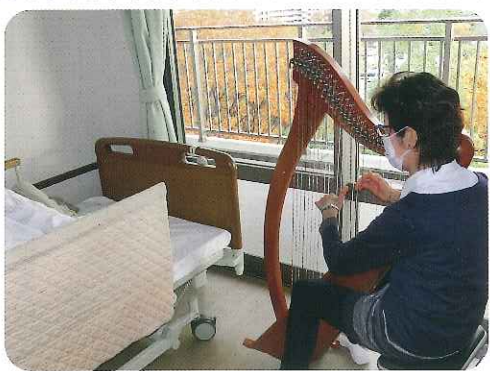
▶心地良い気分になさてくれます。

利用者さんからも、「とてもいい音色だね。」「体がすごく楽になったよ。」「たいへん喜ばれています。ハーブによる音楽は、紀元前の昔から「癒しの薬」として用いられており、失われていた伝統が蘇ったとも言えます。