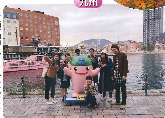
▶北九州市門司区のマスコットキャラクター「じゅも」と記念撮影! みなさん笑顔がスニキですね!!