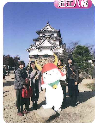
▲彦根城をバックにひこにゃんと記念撮影!