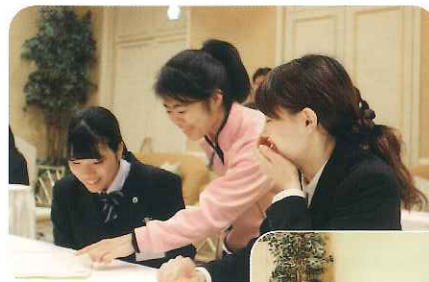
みなさん、とても楽しそうですね😊