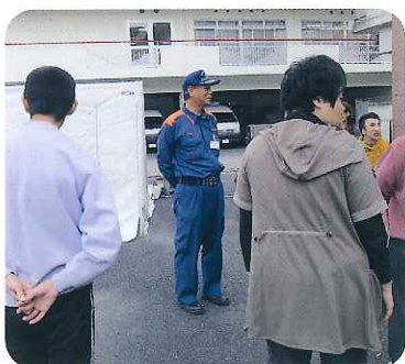
▲しっかり話を聞けば大丈夫!