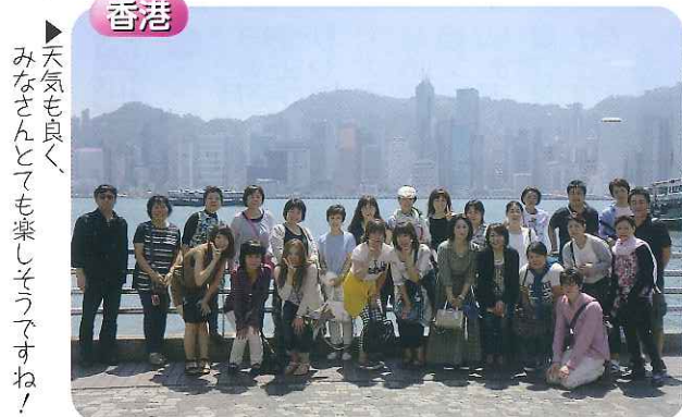
▶天気も良く、みなさんとても楽しそうですね!