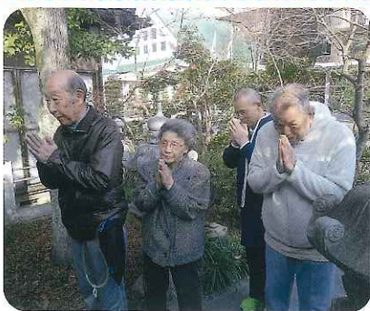
▲今年は何をお願いされましたか?