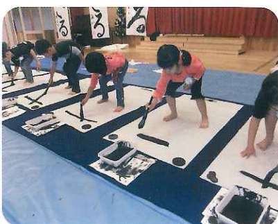
▲ダイナミックに書いています!

で「ばん」とかけ声をかけながら、床に広げた全紙に今年の干支「さる」と力強く書きました。飾られた作品はどれも芸術的で、「上手に書けた。」と満足気な園児達。「書道を親しむきっかけになってほしい。」という講師の願いは園児達に届いたようです。