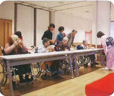
▲なかなかのお点前で...