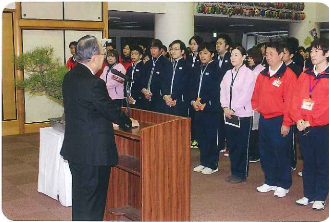
▶みなさん心をひとつにしています

福祉の役割をどう果たしていけばいいのかが、地域の方々に信頼される「福祉の道」を進んでいただきたい。『福祉の道』を歩むためには、まず、職員が健康でなければなりません。健康でなければ利用者さんが満足できる介護もできませんし、喜びを分かち合うこともできません。自分の体は自分で守り、職員一同、思いを一つにして『福祉の道』を究めていただきたい。