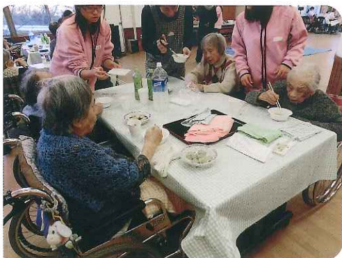
▶みなさん、お腹いっぱいになります。食べられました。

そして、素朴な即興演奏やゲレゴリオ聖歌など、聴き手が予測できない音楽を用いることで、「聴く」という行為から解放し、言葉や記憶を超えた領域で、音と音楽の力に心身をゆたねることを目指しています。