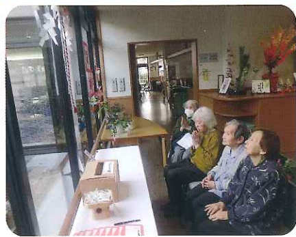
▲どんなお願いをされましたか?