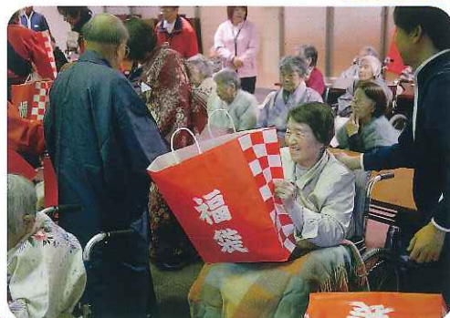
▲何が入っているのか楽しみだな!