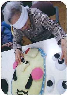
▲どんな顔になるかな？(笑)

フェルトや綿を使った福笑いで、みなさんと一緒に楽しみました。「そっちじゃないよ。」「そこだ！そこ!!」とたくさんの方が飛び交い、フロア内は笑いの渦に包まれました。