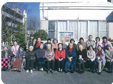
▶今年もよろしくお祈りします