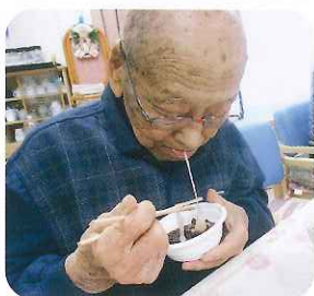
▲つきたては、やっぱりうまい!

ますように「...」と願いを込めて参拝し、新年に向けての新たなスタートをきることができました。 初詣のあとは、ぜんざい作り。おもちゃをつき、時間と愛情をこめて作った小豆たっぶりの手作りぜんざい。参拝後の利用者さんの冷えた体を、ぼかぼかに温めてくれました。