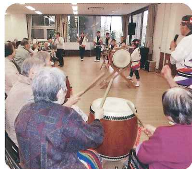
▲太鼓を通して心をつなげていました

「早川流やぐら太鼓の会」のみなさん総勢15名が来苑され、力強い太鼓演奏で盛り上がりました。