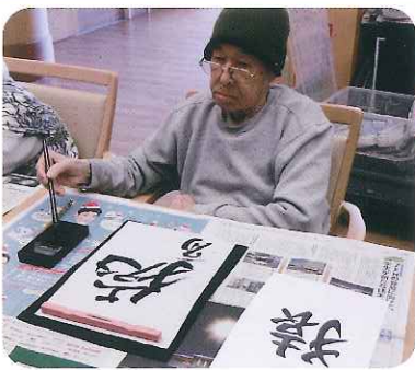
▲まるで書道家のようです！