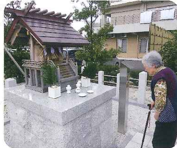
▲今年は何をお願いしようかな？