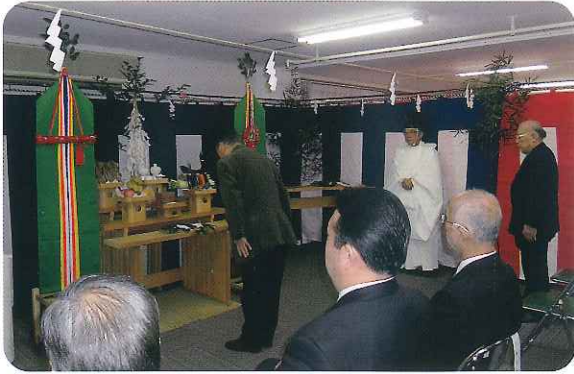
▶末永く建物が安定するように祈願しました

利用者さんはきれいになった施設で快適に過ごされています。新しくなった施設で介護サービスの質の向上を目指し、職員一同頑張っていきます。