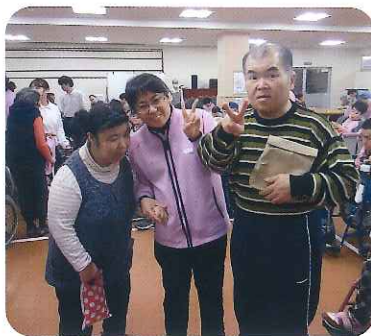
▲賞品ゲットしたよ!

毎年恒例の「レクの日・ビンゴ大会」を開催しました。たくさんの方の景品を目の前にワクワク、ドキドキの利用者さん。スクリーンに映し出されたルーレットにみなさん注目。職員も利用者さんと一緒に参加し、自分も持っているカードの数字が呼ばれるたびに会場は盛り上がり、「ビンゴ!」というかけ声に大歓声がわき起こりました。