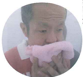
▲何も見えない!? でもこれで安心!!

真っ白な煙の中を歩くということもあって、ドキドキしながら緊張している利用者さんでしたが、消防隊員の方の説明をしっかりと聞き、行動をとったおかげで無事に避難することができました。