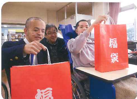
▲早くあけたいなあ〜!

1月1日、利用者さんに「福袋」を配りました。会場となった食堂では、お正月らしい音楽が流れ、厨房からは、おせち料理のおいしそうな