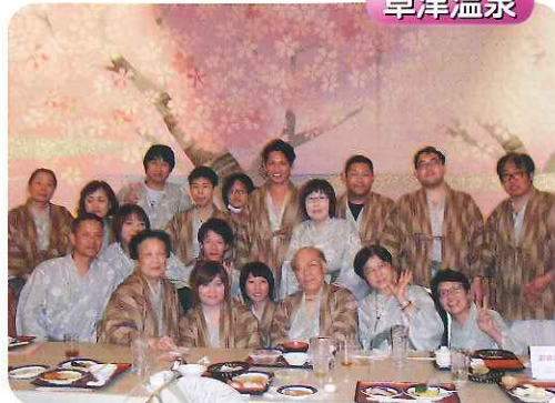
▲みなさん、とてもリラックスしていますね!