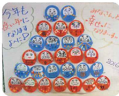
▲個性がでてますね

「今年も良い年になりますように...」と、利用者さん一人ひとりがそんな願いを込めて、だるまの飾りを作成しました。だるまと言えば、本来は願いが叶ったあとに目を描きいれませんが、そこはデイサービス流にアレンジ。利用者のみなさんが思い思いの表情に仕上げ、個性あふれるかわいらしいだるまが完成しました。これで願いが叶うこと間違いなし。