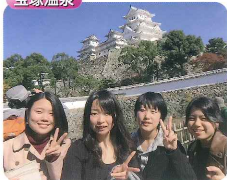
▲さすが、世界遺産！真っ白な姫路城!!