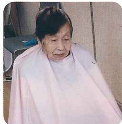
▶いつもありがとう!

美容師さんと楽しくお話ししている姿はとても印象的で、すてきな髪型をみて、いづも大満足の様子です。