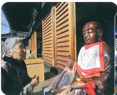
▲日頃の感謝の気持ちも込めて...