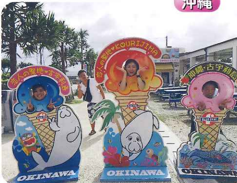
▲恋人の聖地！いいことはありましたか? ☺