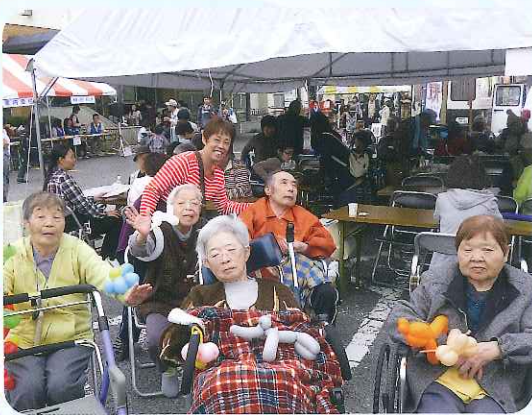
▲地域との交流は利用者さんの楽しみの一つです

ランテアさんに来ていただき、新しいことにチャレンジしていただけるよう、地域の方々と一緒にデイサービスを盛り上げています。