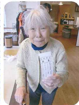
▲大喜だよ！いいことあるかしら！