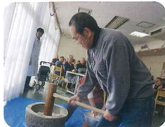
▶腰が入っていますね!

みなさんの「ソーレ!」「よいしょ」というかけ声でももちをつきました。つきたてのおもちを食べるのを楽しみにして