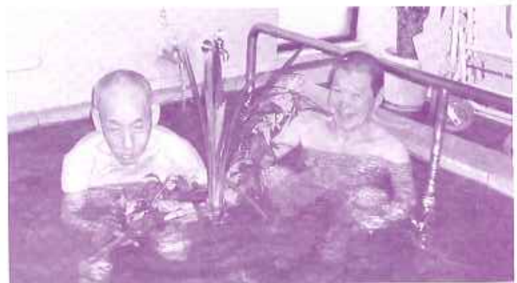
「まだまだ成長したい！」と菖蒲を片手にニコリ

また、当日のお風呂には東にした菖蒲 しょうぶ を浮かべ菖蒲湯 しょうぶゆ にしました。菖蒲の良い香りと青々とした緑が新緑の季節を感じさせてくれました。普段はからすの行水 ゆすい の利用者さんも、この日はかわはゆっくりと菖蒲湯 しょうぶゆ に浸かっていました。