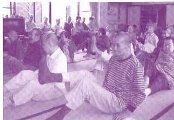
下半身の運動をしている利用者さん