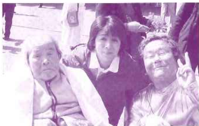
人気タレントと一緒にパチリ!

いよいよ愛知万博が三月二十五日から開催されるのに先立ち、特養(デイサービス含む)では、一部の利