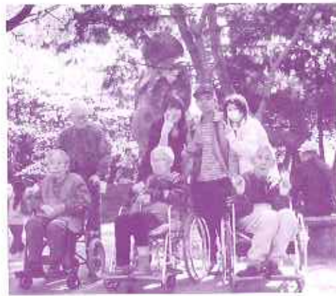
ほぼ満開の桜の下で

散策の後は、食後間もなくではありましたが花見団子を多くの方は、「花より団子」と言わんばかりに満面の笑みで食されていました。また来年も、一味二味も違う楽しいお花見にし、利用者の皆さんの元気の源となるようにしたいと思います。大山公園の桜さん、来年もよろしく。