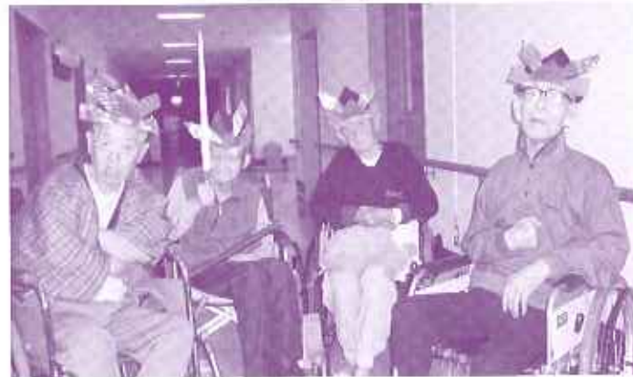
われら若葉の四銃士なり

写真では判りづらいのですが、少し光っている部分は金紙を貼りました。上の写真は和紙を貼って下さっている短期入所のご利用者様です。そして出来上がった「かぶと」をかぶっていたのが右の写真です。当日は柏餅も食べ健康を祈願しました。