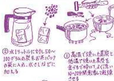
炭で水をおいしくする方法

② 水1リットルに対し50～100グラムの炭をお茶パックの袋に入れ、水出しなどで加える