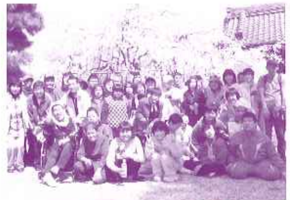
専修坊のしだれ桜にみんな感激!