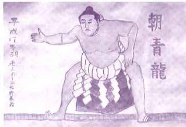
北野 春義 作