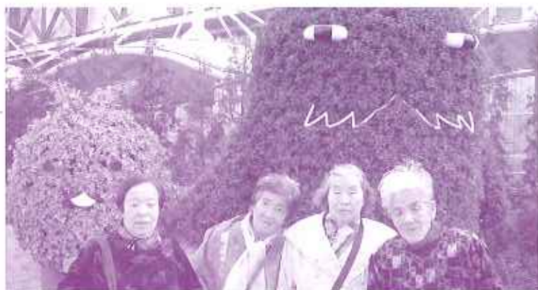
トピアリー(刈り込んだ樹木)のキッコロとモリゾーの前にて

昨夏から、ずーと心待ちにしていた愛・地球博内覧会長久手会場へ、一般客より一足先の三月十八日に行ってきました。目指すはグローバルハウスのマシンモスラポと名古屋市パピオン大地の塔です。