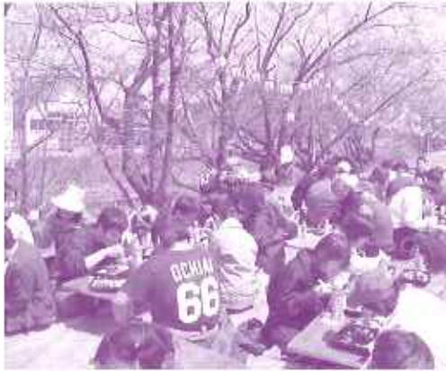
青空の下で食べるお弁当は美味しい!

色付いた桜の木の下で弁当と花見団子を食べ、食後は近くにある「専修坊」というお寺の名物のしだれ桜を見物に行きました。