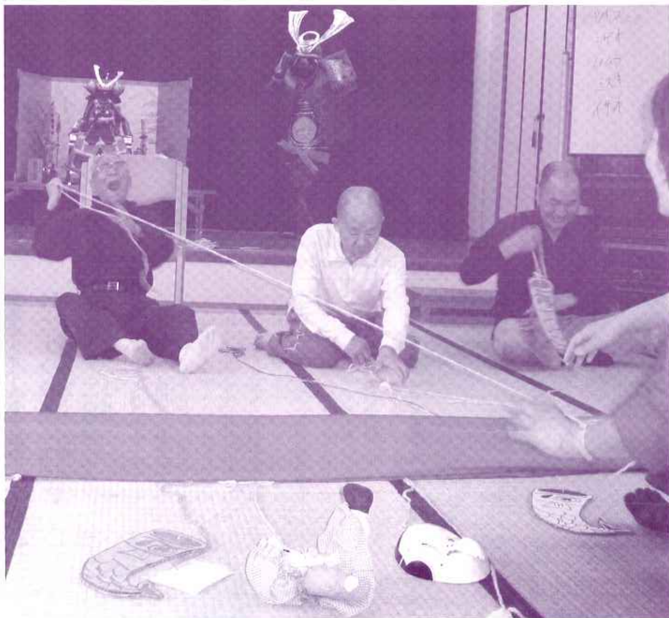
紐の先には鯉のぼりではなく職員だった！(笑) (養護老人ホーム高浜安立)