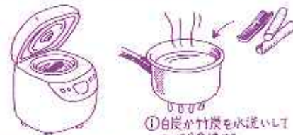
炭を使ったおいしいごはんの炊き方