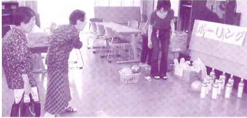
ボーリングゲームで景品をねらう入居者

五月二日、ケアハウスでは端午の節句にちなんだ『さつきまつり』を開催しました。初めての試みだったので、職員も企画に思いを巡らせましたが、その甲斐あってか好評で、三十八名