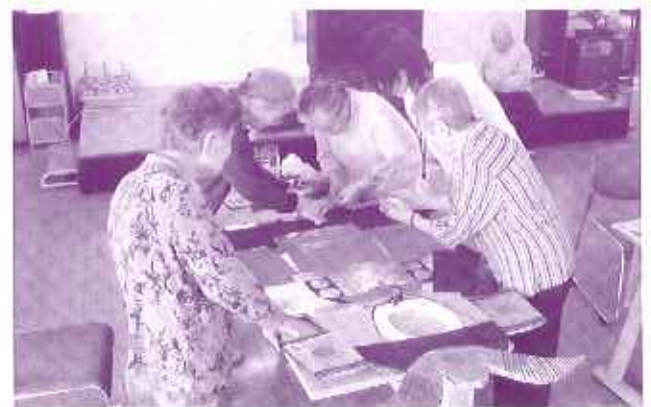
写真撮影用の五月人形作成中

節句のお祝いに欠かせないのが「五月飾り」。これには「鯉のぼり」や「武者職（のぼり）」といった「外飾り」と、「鯉（よるい）兜（かぶと）」や「大将飾り」といった「内飾り」があります。前者は大空に掲げること子ども立身出世を願う意味が、後者は武家時代の身を守る武具などを飾ることで、子どもの無事と成長を願う意味があります。息子さんがいらっしゃる家庭では、