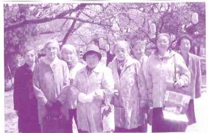
わずかに色づいている桜の前で

になく開花が遅く、ピンクの提灯ばかりが目立つ状況でした。それでも十名の参加者は桜が咲いている木を見つけては写真撮影をしながら、公園内を周りました。昼食は、花見弁当を持参し、ビールやジュースを飲みながら参加者全員でいただきました。途中、入居者の歌も入り、とても賑やかな宴会になりました。飲みすぎや食べすぎの