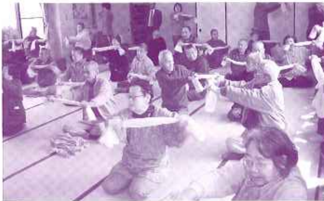
上半身の運動をしている利用者さん