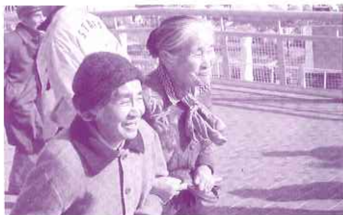
寒さの中、笑顔で歩く入居者

この日はとても寒い日で、歩くだけでも大変な一日でしたが、参加者は、「万博に来ただけでも幸甚だ。」「ゴンドラに乗れてよかった。」と、とても嬉しそうに話してくれました。婦りのバスの中は、入居者の笑顔とお土産でいっぱいでした。