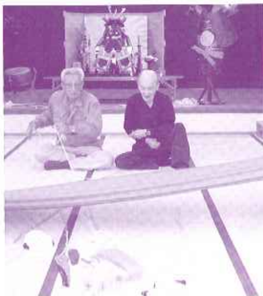
紐の先は鯉のぼりかな？それっ！

五月六日、端午の節句にちなみ、手作りの鯉のぼりを誰が一番先に引き当てるかというゲームを行いました。当たりの鯉のぼり、外れのお面やパンツをそれぞれ紐で結び、紐の途中を見えないように布で隠し、利用者さんに紐の先だけを渡します。一番に鯉のぼりを受けようとする利用者さんの目は、手元の紐と鯉のぼりが結んである紐をなんとかつなげようと必死で見つめます。この日はやはり勝負師の目になって威厳すら感じられました。