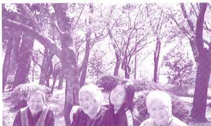
桜の木の下で話が弾む利用者さん

にも伝わってきました。大山公園では、太陽の陽射しの下、手作りのお弁当を食べました。「外で食べるのは美味しいね」、「みんなと一緒に外で食べると、いつもよりたくさん食べられるわ」と会話が弾みます。お腹がいっぱいになった利用者さんは、桜の木の下で横になったり、楽しくおしゃべりをされたり、ゆっくりとした時間を過ごされました。