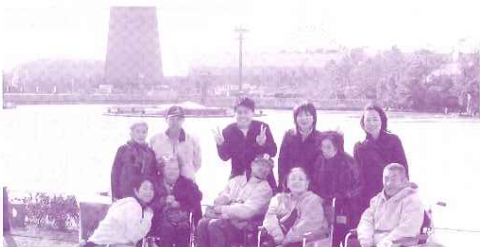
大地の塔と観覧車とこいの池をバックに

大さに驚き、万葉鏡内部では刻々と変化しつづける光の表情に驚き、利用者さんの口は終始開きっぱなしでした。過去、大阪万博に行かれた利用者さんは「愛知万博は想像していたより緑が残されている。いいことだね」と目を細めていました。