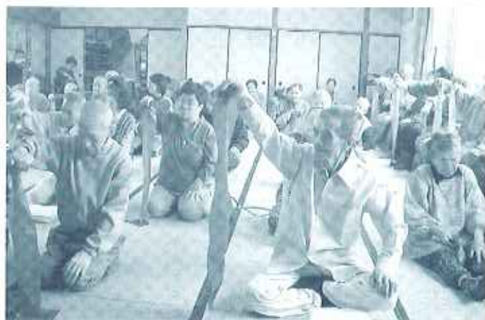
「簡単なようで、なかなか難しいよ」

現在、介護予防体操を毎朝行っていますが、四月から段階的抵抗運道具（商品名セラバンド等）という道具を使って新しい体操にチャレンジしています。 セラバンドとは、幅約十四センチ、長さ約百二十センチのゴム製で、伸び縮みすることを利用して筋力をつけるものです。十分程度の体操ですが、楽しみながら