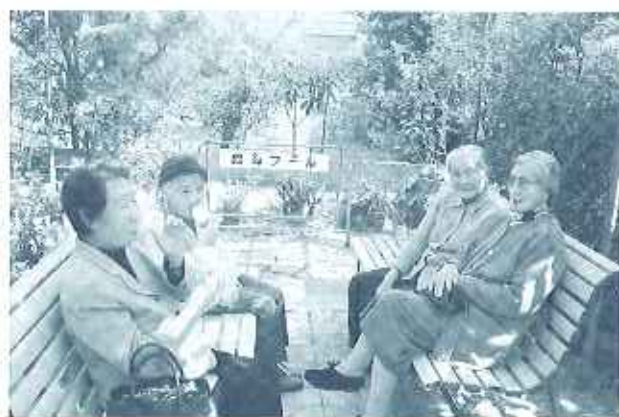
藤棚の下でアイスクリームを食べながら 会話がはずみます

「ひろの長藤」の開花はまだ早かったのですが、白い花と短い房の『だるま藤』は美しく咲いていて、藤棚の下は花の香り