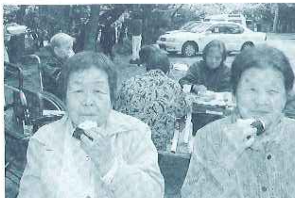
桜とおにぎりを味わっています!!

来年も桜の下で利用者の皆さ んとお弁当を囲んで、お花見が 出来ることを楽しみにしていま す。