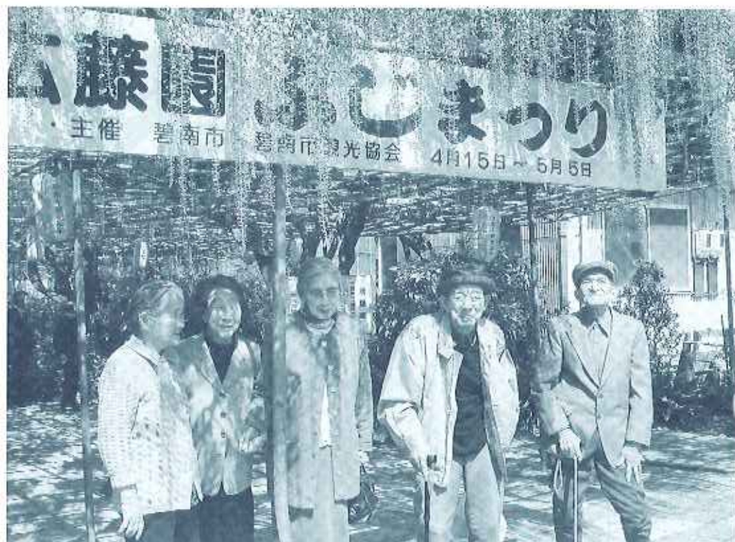
多くの観光客が訪れる広藤園 入り口にある「ひろの長藤」の前で記念撮影 「藤まつり」開催期間中にもかかわらず花は3分咲き しかし、入居者の笑顔は満開でした

四月二十八日、風もなく、とても穏やかな春の陽気となりました。ケアハウスでは今年初めて「藤まつり」を企画し、碧南市の「広藤園」に出かけました。近年、外出行事の参加者は減少傾向にあったのですが、今回は入居者の半数近い二十名が参加しました。