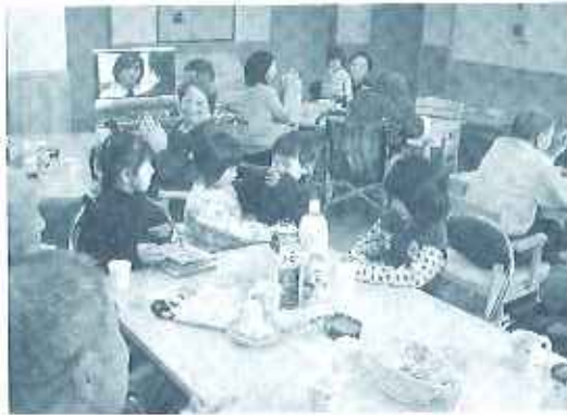
たくさんの人の前で自己紹介 少し照れますね