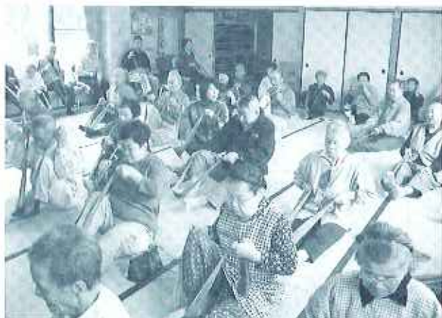
「太ももを鍛えれば転びにくくなるわ」

二、肘と腕の運動 セラバンドを首にかけ、両手で肘が伸びるまで引っ張ります。 三、内股の筋肉を鍛える運動 セラバンドを二つ折にし、膝に挟み両手で引っ張ります。 四、足の運動 両手でセラバンドの端をそれぞれもち、中央を足底にかけ、膝の曲げ伸ばしをします。 セラバンドでの体操は以上ですが、知らないうちに随分と力を使っています。 この体操で注意しなければいけないことは、無理は禁物ということです。普段よりほんの少しというくらいが、ちょうどよいのかも知れません。 毎朝の介護予防体操は深呼吸の練習や肛門を締める運動、タオルを使った体操なども組み合わせ