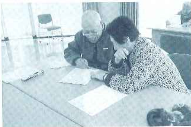
真剣に計算問題に取り組む入居者

例年、「天候に恵まれれば桜は咲いていない」「桜が咲いていると天気が悪い」で、なかなか花見を楽しむことができなかったのですが、今年は日本の春を満喫することができました。 四月七日、桜の散り際をねらって、少し遅めに花見の行事を設定しました。桜の開花状況や大候を毎日チェックした甲斐あって、当日は本当に良い天気で、時々吹く風で桜の花びらが舞い、風情が漂っていました。