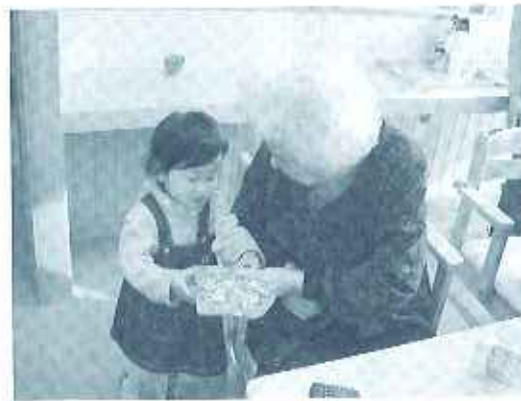
おばあちゃん、お菓子をありがとう!

う会」を開催しました。当日は 二歳から六歳の子供達九名が保 護者と共に遊びに来てくださり、 利用者さんに抱きかかえてもらっ たり、一緒におやつを食べたり、 また「まんが日本昔ばなし」の ビデオを観賞したりと、利用者 さんと子供達が自然にふれ合え