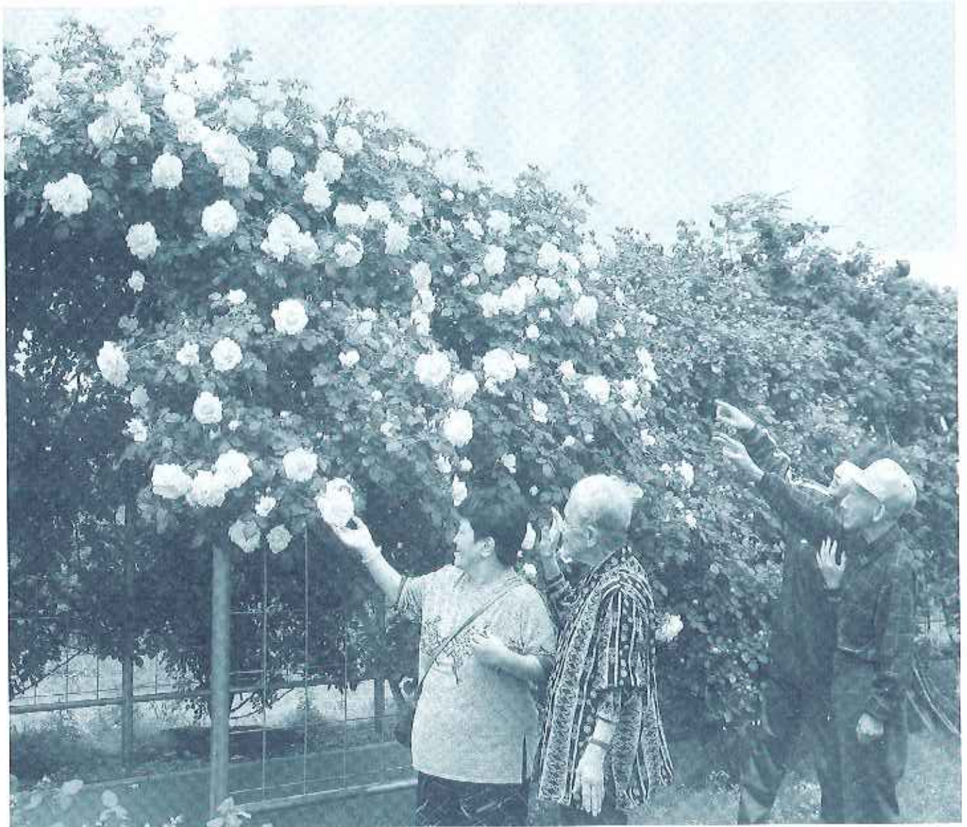
ただ今、バラのまっさかり。その美しさに見とれてしまいます。ミササガパークにて（養護老人ホーム高浜安立）