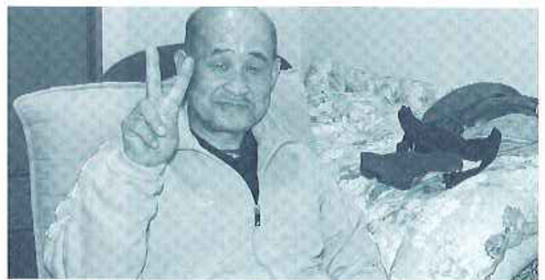
自分の部屋に大満足

と整理して棚にしまっています。好きなタバコも室内では吸わず、玄関横に置いてある灰皿を使用しています。