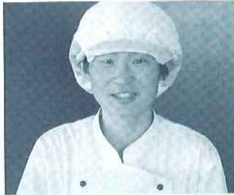
制服、似合うでしょ！

（山口さん）六時三十分に起きて、いきいき号で古浜駅へ行き、電車に乗って刈谷駅まで行きます。