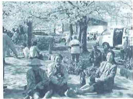
満開の桜の下で 「やっぱり桜は散り際が最高」

いつもはすぐに売店に向かう入居者も、桜のあまりの美しさに見とれてしまい、まずは全員で桜の下でのお茶会を楽しみました。時々風によって舞ってくる花びらを見て思わず「やっぱり花見は団子より花だね。」