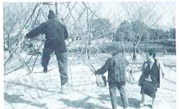
数十年ぶりに公園の遊具に挑戦