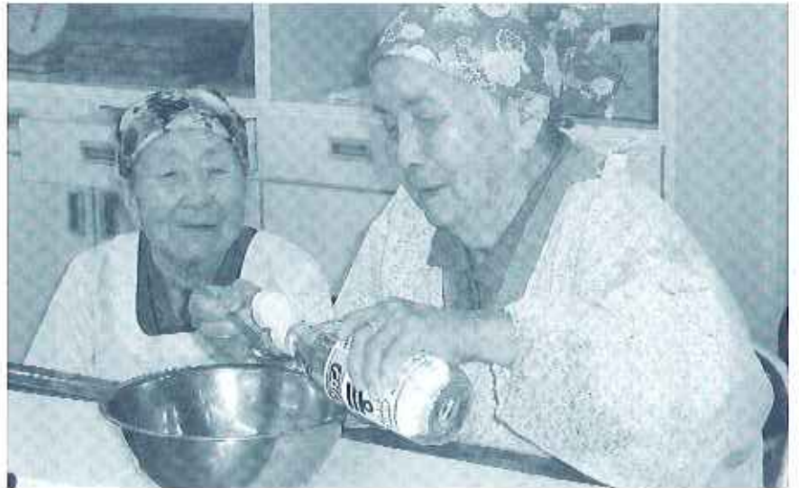
味付けは私に任せて！と自信ありげに

よほど楽しかったみたい。」という声を聞くことができました。また機会を作り皆さんとお料理を楽しみながら昔話に花を咲かせたいと思います。