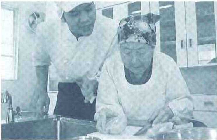
「上手に切れるかな？」

どんな料理を旨は食べたり作ったりしていたのか利用者さん達に聞き、結果メインをすいとん(団子汁)に決めました。