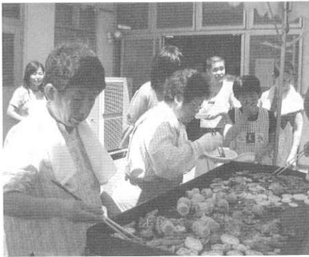
暑いテントの中、たくさんの肉・野菜！

八月十七日に保護者会主催のバーベキュー大会がありました。この日は天気も良く、駐車場内にテントを張り、その中で、肉、野菜を焼く保護者の方々には大変ご苦労さまでした。おかげで楽しいひと時が過ごせました。