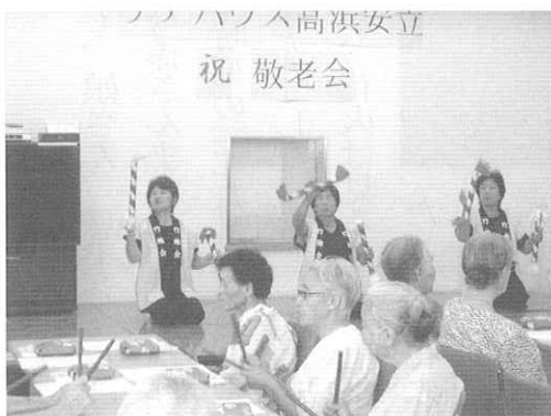
こきりこの竹を叩いて演奏に参加する入居者

全九曲の民謡を聞かせていただきました。今回は入居者も知っている民謡が多く、一緒に口ずさんだり、拍子をとったり、囃子を入れたりと様々な形で演奏に参加していました。中には故郷の民謡を聞いて懐かしさのあまり涙を流す入居者もいました。演奏の後は入居者にも協力していただきお茶会を開催しました。