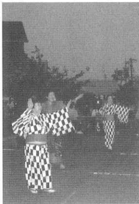
祭りといえば盆踊りですね

また昨年までは、職員がボランティアで焼きそば露天を手伝っていた授産所が今年も合同開催ということで、利用メンバーやご家族も合わせて百名近く参加されたそうで、例年以上の賑わいでした。