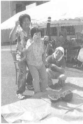
バッチリ！OKー甘そうな西瓜が割れたよ

七月の「蒲焼き」に続く、食欲モリモリ！元気で暑さを乗り切ろう！行事として八月は、一階フロアでは『納涼会』、二階フロアでは『流しそうめん』が行われました。厨房の業者さん手作りの青々とした本物の竹が