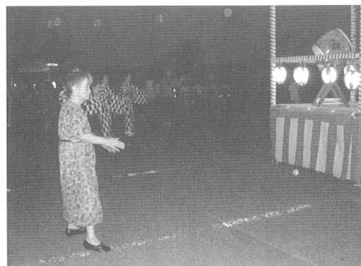
やぐらを囲んで盆踊りを披露

ができました。途中、天候が悪化して予定時刻よりも早く花火が打ち上げられました。居室に戻ろうとしていた入居者も空いっばいに広がる花火に帰る足を止め、間近で花火を見ることができました。そして、たくさんのお食べ物を両手に下げて無事帰宅しました。