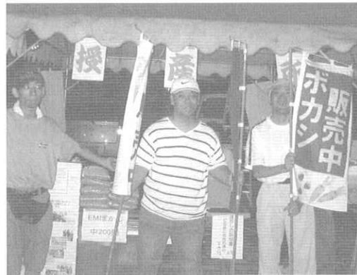
☆僕らはボカシ販売隊いらっしゃ〜い☆