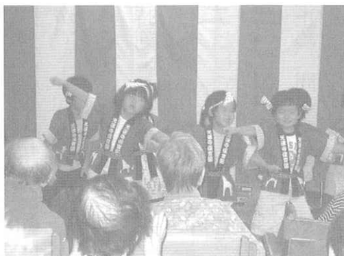
はじけるほど、元気いっぱい！

るということで、同法人内の光徳寺保育園の園児のお神輿と踊りと歌を見せていただきました。園児の元気が良すぎて少々驚かれた様子もありましたが、高齢者の顔もほころび、踊りに合わせて手拍子もあちらこちらで聞かれました。園児手作りのメダルも一人一人掛けてもらい、一緒に元気ももらった敬老会でした。