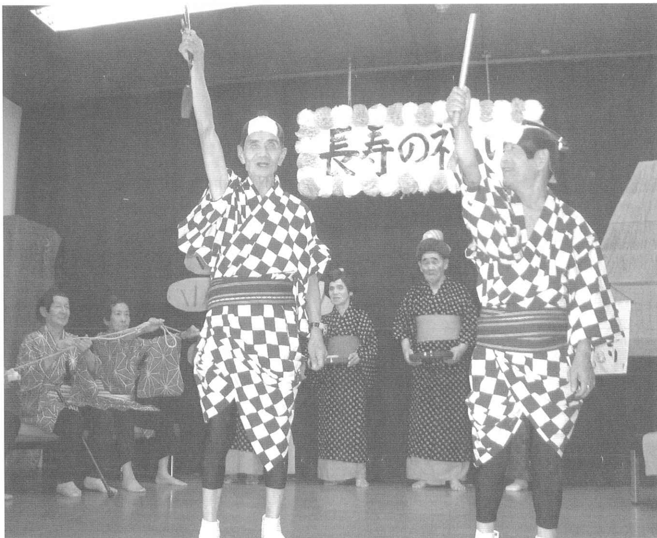
無銭飲酒の悪党を捕らえ得意気な岡っ引き（養護老人ホーム高浜安立）