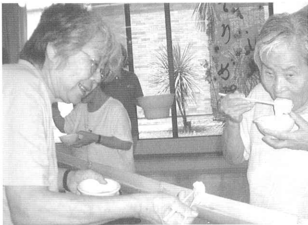
器用に流れてくるそうめんをすくう利用者さん

「我先に！」と箸を器用 に操りそうめんをすくう 方や、普段はそうめんを食 さない方も手作りの流しそ うめんなら！と口いっぱい にほおばる方など、日頃見 られない利用者さんの姿を 見ることが出来ました。「見 ているだけでも楽しいね♪」 「おなかいっぱい食べれて 幸せ♥」「本物の竹を使って