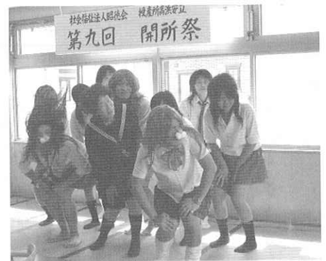
かわいい女子たちがいっぱい!?

この祭りを盛り上げてくださったのは、民生委員さん・高浜高校の生徒さん・そして何より底力を発揮してくださった保護者の方々です。