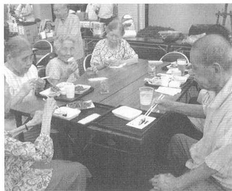
キャンドルを囲んで食事を楽しむ入居者

中でも、『揚げたて天ぷら』と『流しそうめん』は人気があり、特に『流しそうめん』では、地域の方なども参加して、時々歓声を上げながら、流れてくる素麺を必死で追いかけていました。