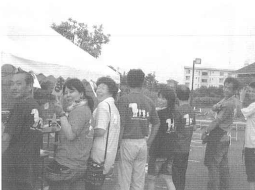
職員も気合十分!揃いの授産所Tシャツ!