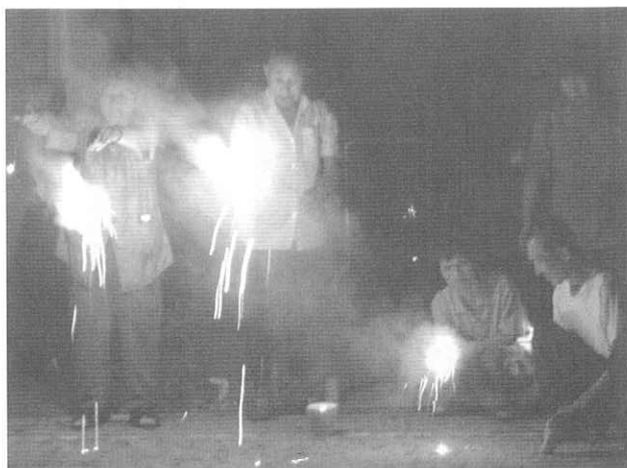
両手に手持ち花火を持つ利用者さん

「昔の線香花 火はしょぼ かったが、今 は火花が大 きくていい なあ〜」煙 のせいで(懐 かしさのあ まり)涙が出