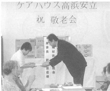
施設から感謝状を渡しました

式の後には四十五分間に亘って竹祐会の皆さんによる『民謡の集い』が開催されました。北は秋田から南は沖縄まで、