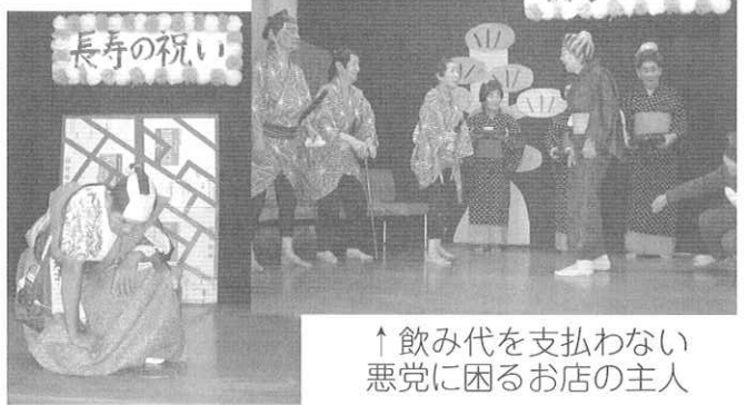
↑飲み代を支払わない悪党に困る店の主人