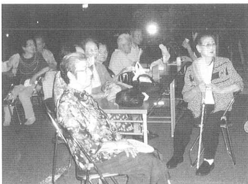
踊りを見ながら祭りを楽しむ入居者

祭りの最初のプログラムは「盆踊り」でした。日頃からクラブ等で練習をしていた入居者が少しずつ踊りの輪の中に入ってきて、がじまる会の皆さんと一緒に楽しく踊ること