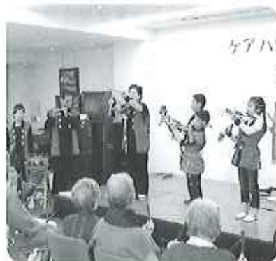
竹祐会の皆さんと一緒に懐かしい民謡を楽しみました

二月七日に、「節分会」を開催しました。今年も竹祐会の皆さんにお越しいただき、「民謡の集い」を披露していただきました。竹祐会の子供さんも来てくださり、一生懸命、太鼓を叩いている様子を見て、入居者の皆さん