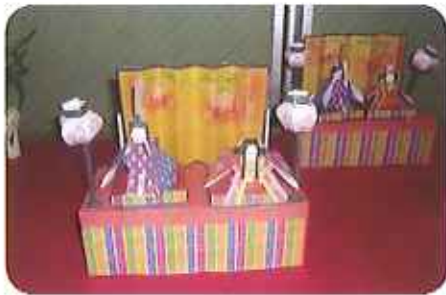
ペーパークラフト 雛人形 余暇活動にて作成