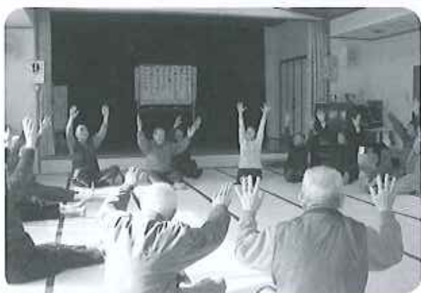
「天井に向かって両手を気持よく上げてね～」