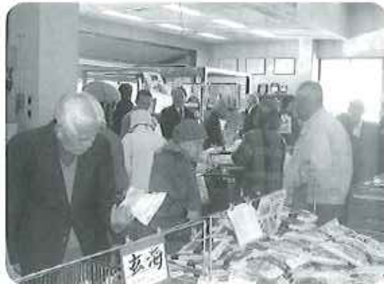
花見もいいけど、買い物も楽しいですね

ごろで嬉しい」「天気も良くて花見日和だね」「来て良かった」という声が聞かれ、春の訪れを楽しんでいました。