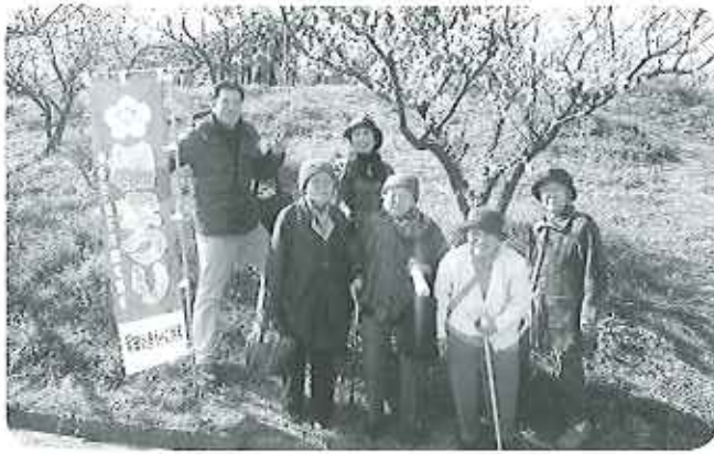
今年の梅の花は満開で、とてもきれいでした