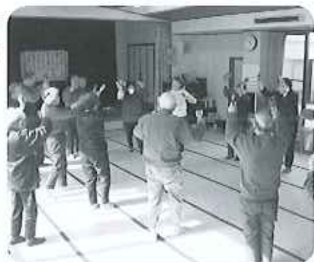
「鳴子を使って耳にも刺激をしますよ」「リズムに乗って楽しくね」

先生から「○自分のペースで体を動かしてもらえたらそれでいいですよ。年をとっても背筋をピンと伸ばし、お尻をキュッと締めて歩くのがカッコいい！」一緒に笑いながら体を動かして「丈夫な体を作りましょう！」と声をかけられ「先生が元気だから、つられて私も元気になるわ。先生に会えるのが楽しみなのよ。」「座っていても体操をした気になれるからいいのよね。」など普段あまり体を動かしたがい入所者さんも先生の動きに合わせて手足を伸ばします。元気に笑顔で長生きが目標です(養護老人ホーム高浜安立)