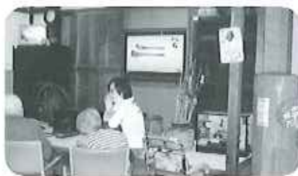
これは何だろうね??

昨年来より、昭和横丁開設と同時に Rowe かれてきている「回想法」ですが、いかに回想法を楽しんでいただけるか毎月、専門家の講師