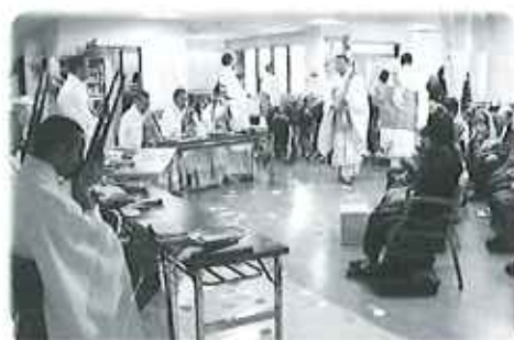
いい音にうっとり!