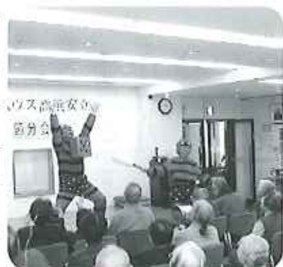
ケアハウスに福鬼？が登場！「福豆」が撒かれました

から「自分の曾孫を見ているようだ」「かわいいね」という声も聞かれ、笑顔が溢れていました。民謡を楽しんだあとは、「福鬼」が登場し、入居者の皆さんに幸せが訪れるよう「福豆」が撒かれました。