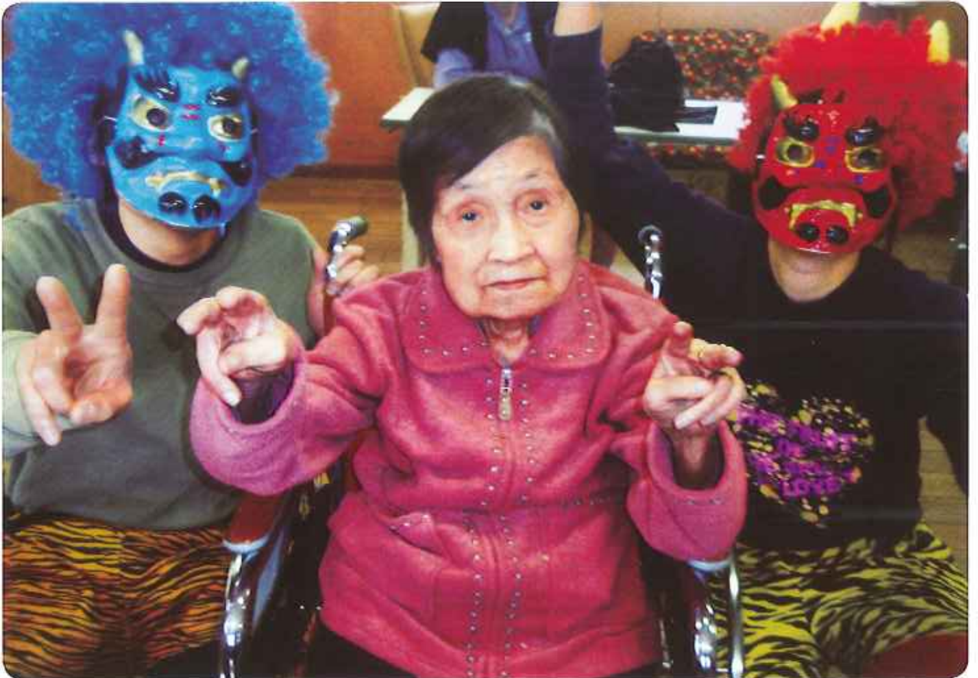
2月の行事は、節分。赤鬼・青鬼に囲まれてピース。高浜安立荘では、毎月季節を感じていただくために楽しい行事を行っています。 (特別養護老人ホーム高浜安立荘)