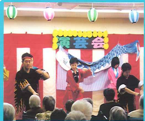
平成19年6月15日【演芸会】

「特別養護老人ホーム」は、重度の要介護状態にある高齢者が生活する介護付の入所施設です。生活援助から、受診付添や行事の企画などまでスタッフが行ないます。利用者の皆様の快適な住処を目指して全てのスタッフ頑張っています。