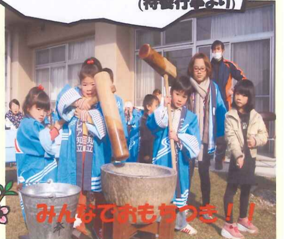
みんなでおもちつき！！

～ホットなワンショット集～ タイトル：今年の元気のみなもと！！ (特養行事より)