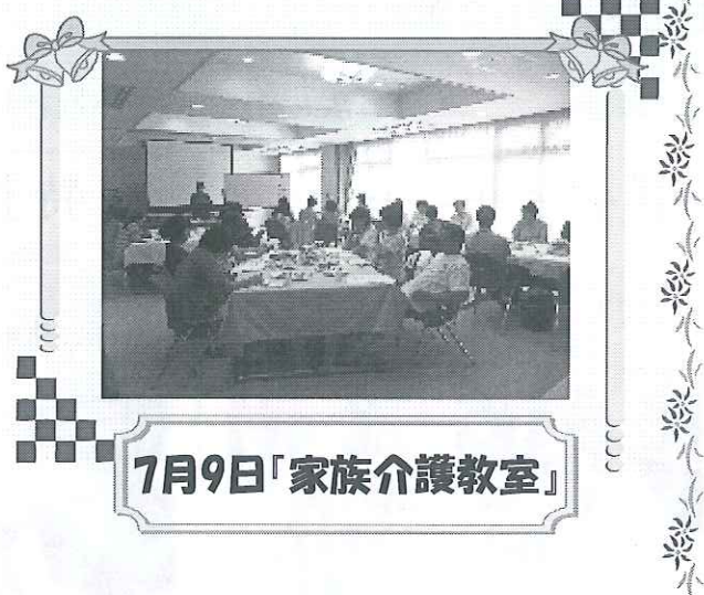
7月9日「家族介護教室」

②『知立市・認知症の家族を支える会』が今年5月に立ち上がりました。月1回福祉の里に集まり勉強や交流を深めています。同じ介護者同士「ほっとする」場所はとても大切だと思ひます。ヴィラ支援センターもお手伝いに行きます。参加者を希望される方はお知らせ下さい。