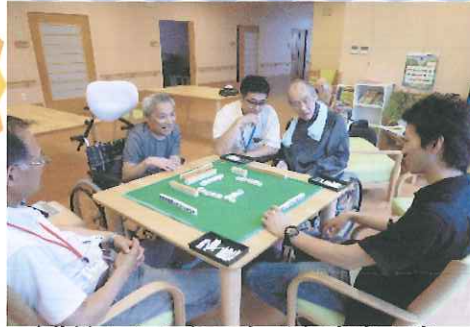
〈職員とふれあいながら麻雀を楽しんでいる様子〉

ビリヤードもコツは要りますが、球を集中してホールに入れることが出来ると、面白いと昔を思い出して楽しんでいます。