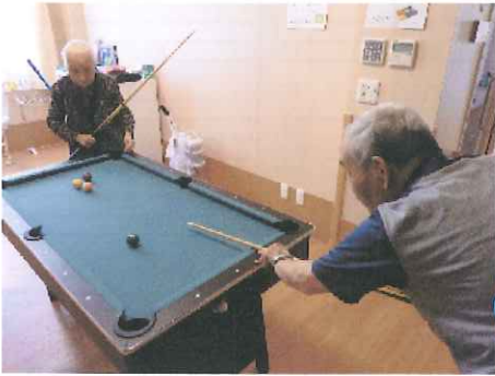
〈ビリヤードを競いあっている様子〉

初めて、ご利用者様・ボランティア様・職員で麻雀を行ってみました。今後こうした時間を作りたいと思います。