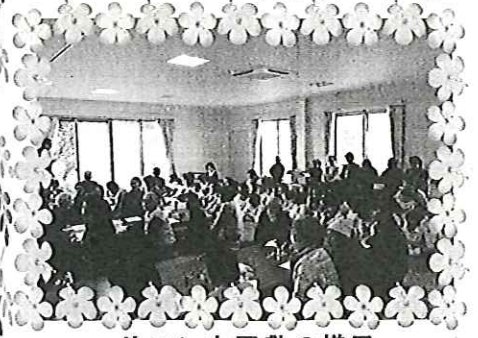
サロン山屋敷の様子