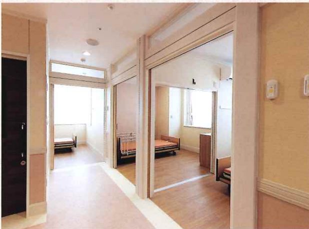
居住～プライベートに配慮した居住空間

居室の天井に設置されたセンサーカメラと職員が携帯するスマートフォンを連携させることで入居者の状態を把握するシステムです。起床、離床、転倒・転落の他、呼吸などによる体の微細な動きを検知し通知されます。特に夜間など職員が少ない時間帯での、安心や負担の軽減に繋がります。また、状況が動画で記録