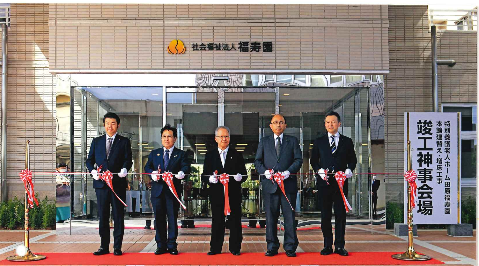
(左から) 大竹田原市議長、山下田原市長、山田理事長、根本衆議院議員、山本愛知県議会議員