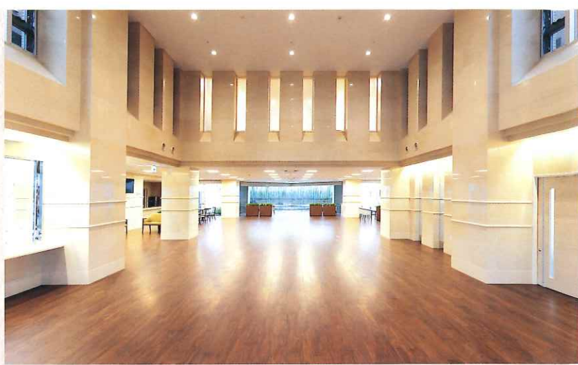
エントランスホール(1F)