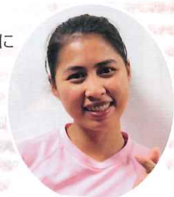
エスピサ マニリン ダルト ニックネーム マニリン くすのきの里