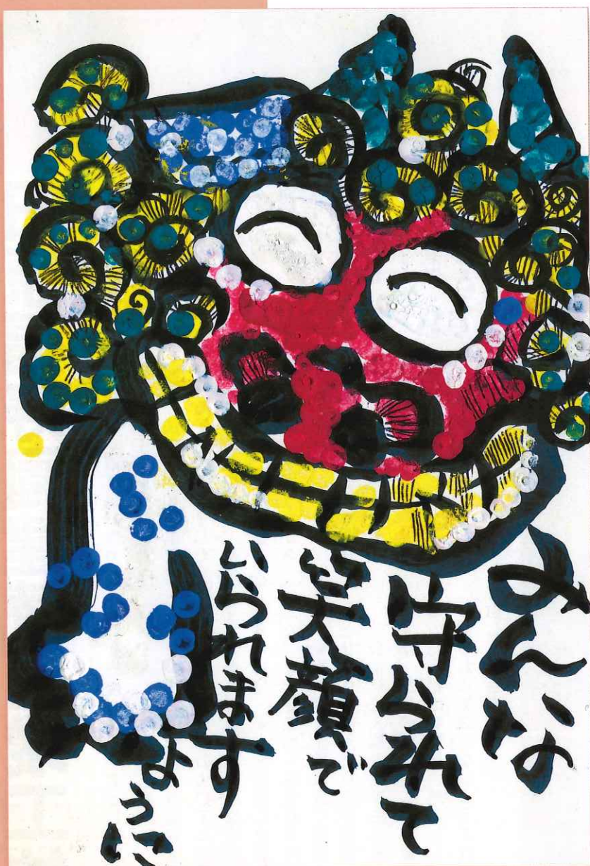
第17回 福祉の絵手紙 最優秀賞受賞作品 安倍 敏子 様