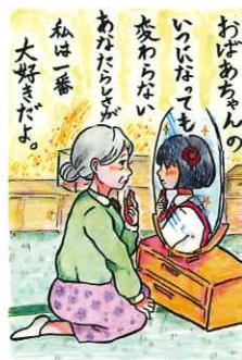
《理事長賞》 山口 裕子様