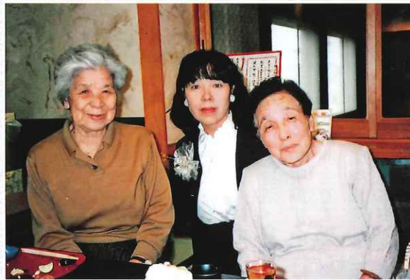
喜寿の祝い(右が本人)