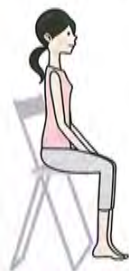
椅子に座った姿勢