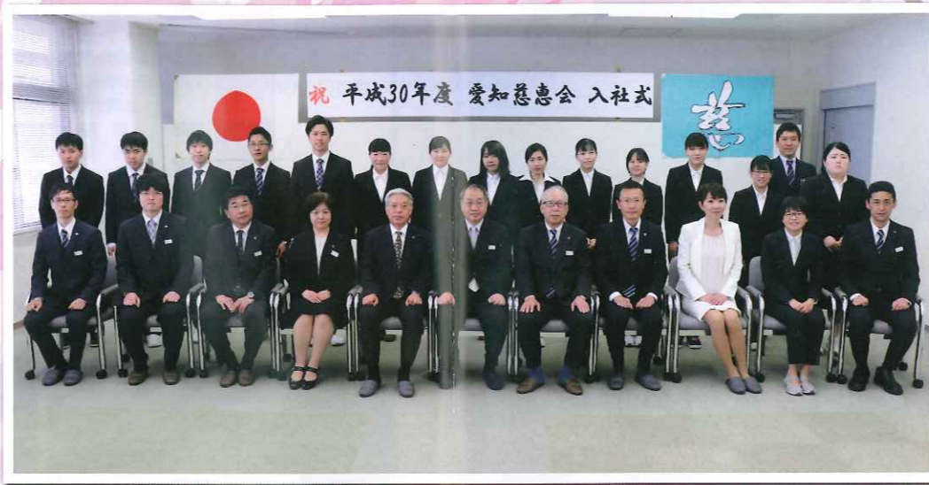
祝 平成30年度 愛知慈恵会 入社式