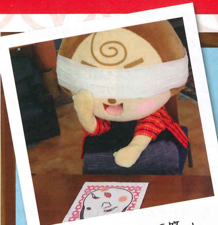
位置が変わり福笑い

清らかな水の流れて清々しい風が行き交う地域でよく見かける、一宮タワーがモチーフの幸せを運ぶ妖精です。たくさんの人と触れ合っことが願いです。 大きさ：138イチミン 発見日：1921年9月1日