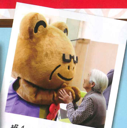
握手で気持ち繋がる！