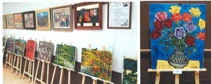
樋渡涓二(1922~2015)仙台に生まれる。 1946年NHK入局。2006年日本画府理事長就任。