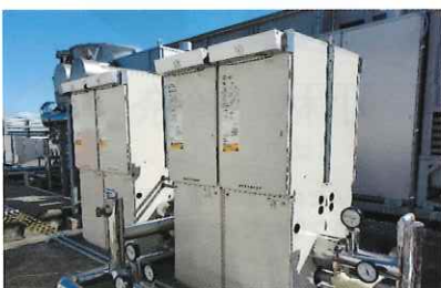
【新 冷温水発生機(空調設備)】

支援事業の名称：平成31年度エネルギー使用合理化等事業者支援事業 支援事業の内容：一宮市萩の里特別養護老人ホーム 空調設備及び給湯設備の更新 総事業費の内容：79,200,000円 内助成金額：15,933,333円 工事期間：令和元年10月25日～令和元年12月6日