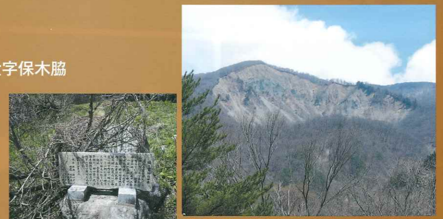
神社の下にある石碑

1585年(天正13年)11月29日に天正地震が起き、帰雲山の崩壊で埋没。被害は埋没した家300戸以上、圧死者500人以上とされ、城主の内ヶ島氏理ら一族もすべて死に絶え、一夜にして滅亡したといわれる。内ヶ島氏の領内には金山があったことから、城崩壊とともに埋まったとされる埋蔵金伝説が残る。