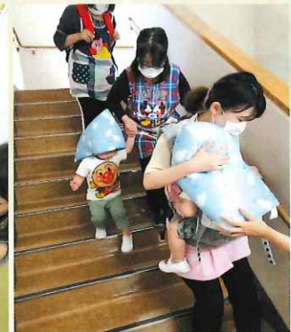
避難訓練も頭巾を被って参加