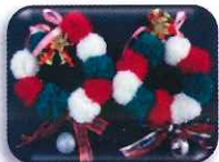
クリスマスリース