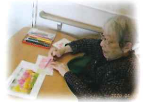
趣味の時間を楽しみます♪