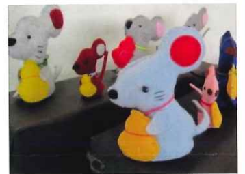
干支(子)のマスコット