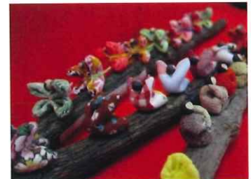
難が転じて苦が去る