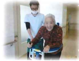
歩行訓練中！ 早くお出かけしたいな～

すっかり春の陽気に包まれるこの季節。例年であれば面会や外出の機会も多く、皆様楽しんでみえます。しかし今年は新型コロナウイルス感染症の新たな情報に日々アンテナを張りながら、面会制限、イベント中止、他サービスとの交流制限・・・。ご利用者はもちろんご家族にも窮屈な想いをさせてしまっています。アルメゾンみづほでは、ストレスが溜まらぬよう、施設内で安全に楽しめる企画の提案や生活リハビリにも力をいれていきたいと考えております。もちろんスタッフ一同、検温、マスク着用、アルコール消毒、換気等感染予防もしっかり行って行きます。ご不便をお掛けしますが皆様のご協力ご理解今後ともよろしくお願い致します。