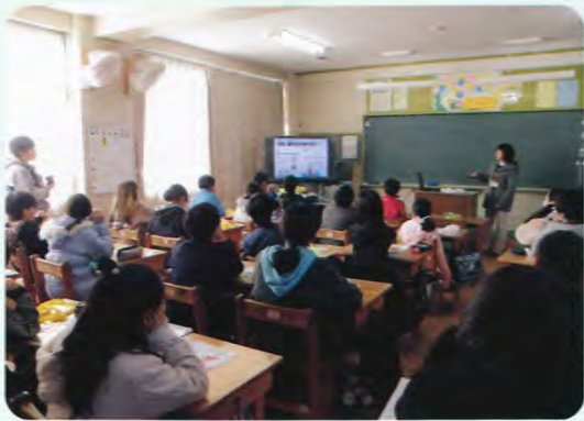
石巻小学校での認知症サポーター養成講座

また、一月十七日、芦原校区「おしゃべり会」にて健康教室を開催し、七名の方に参加いただきました。(白井秀)