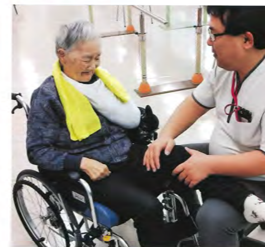
▲リハビリ風景写真②