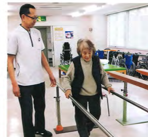
▲リハビリ風景写真①