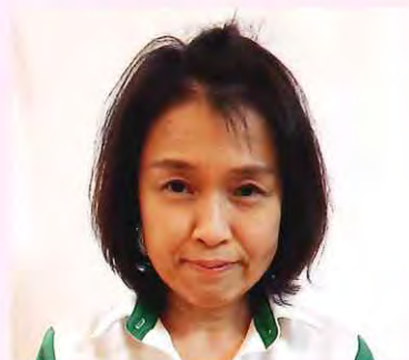
デイサービスセンター八町