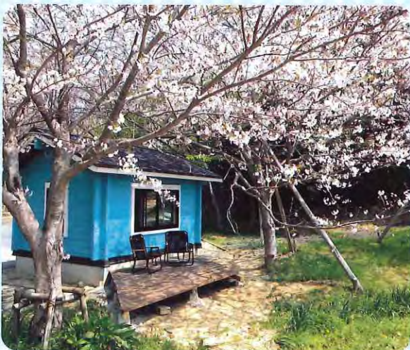
ウッドデッキ側の様子