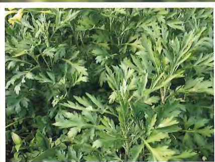
学名: Artemisia indica Willd. Artemisia princeps Pamp. 和名: ヨモギ 英名: mugwort 科名/属名: キク科/ヨモギ属

百人一首51番の伊吹山について織田隆三 モグサの研究(2)伊吹山考(全日本鍼灸学会雑誌35巻1号(66-72))において植物生態系より平安時代は下野、江州(滋賀県岐阜卓の伊吹山)は江戸以降との報告に基づき執筆。