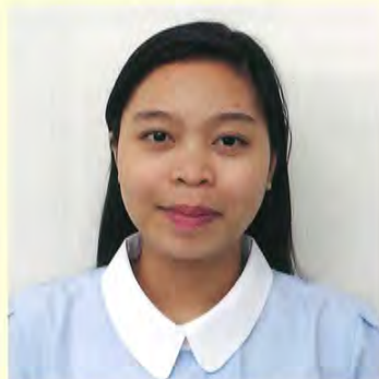
ビルトウダゾ ロッセル ハリナ

2月16日に行われた看護師国家試験の合格者が3月19日に発表され、福祉村病院のEPA看護師候補者3名が合格しました。