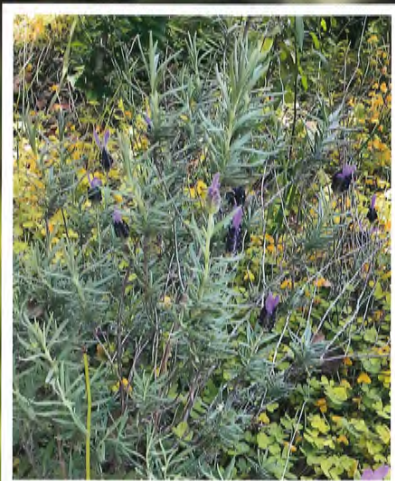
学名: Lavandula angustifolia Mill. 和名: ラベンダー 英名: Lavender 科名/属名: シソ科/ラベンダー属

ラベンダーには様々な種類があり一年で枯れてしまう一年生や何年も生きる多年生の半木性(低木のような草)植物です。地中海沿岸が原産地であるため、日当たりの良い乾燥した環境を好みます。日本の高温多湿の気候に合わず栽培に苦労しましたが北海道が栽培に適していると分かり昭和十四年に札幌に農場が作られその富良野を中心に北海道全土に広まりました。戦後ラベンダー精油の輸入が再開され香料の化学合成が行われるようになると農作物としてのラベンダー栽培は衰退しました。現在は観光資源として富良野のラベンダー畑が世界中に知られるようになりました。