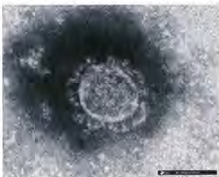
新型コロナウイルス電子顕微鏡写真

ドイツInfRx社の抗ヒト補体C5b抗体が、新型コロナウイルスへの臨床試験実施をオランダの当局から認められ、患者登録を開始したと発表されています。有効性と安全性が確認され、敗血症性DICへの適用となることが期待されます。しかし、C5bに対するモノクローナル抗体は感染防御力を低下させ、重篤な感染症を起すリスクが高いので、長寿医学研究所で、もっか開発中のC5a阻害ペプチドは半減期が三時間と短いので安全性が高いと考えています。