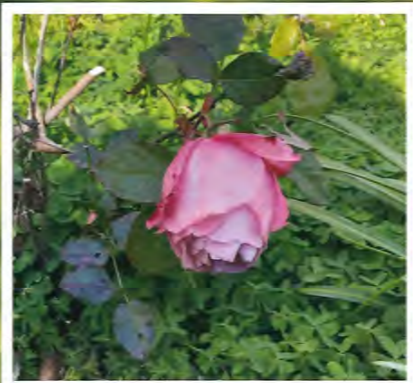
学名:Rosaceae Rosa 和名:バラ 英名:rosa 科名/属名:バラ科/バラ属

バラは北半球に分布し起源は白亜紀後半から古第三紀中期頃のチベット周辺ではないかと言われています。バラは観賞用のほか花弁から抽出した精油(ローズオイル)は香水の原料として有名です。他にも花弁を蒸留した化粧水のローズウォーター、最近ではエディブルフラワーとして生で食べたりジャムやお茶など食用にも使われます。今回の写真は「フェルゼン伯爵」という名の紫のバラ。平成二十四年「ベルサイユのばら」四十周年を記念しフランスの老舗バラ育苗会社のメイアン社が作りしました。発売当初に入手し白薔薇の「オスカルフランソワ」、ローズピンクの「王妃アントワネット」と共にこの花壇へ植えました。バラは色によつて育てやすさが違い、赤や白、その中間色であるピンクは強く、紫や青系統になると弱くと言われています。真つ先に紫の「フェルゼン伯爵」が枯れるのではと思ったのですが、実際は一年ほどで「オスカルフランソワ」が二年目で「王妃アントワネット」が枯れました。それから七年、紫のバラは今年も大輪の花を咲かせようとしています。フランス革命という激動の時代を生き抜きその後母国スウェーデンの国王を補佐し続けたフェルゼン伯爵と重なります。強いバラの香りを聞いたら花壇で紫のバラを探してみてください。