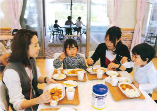
子ども食堂 2019年4月開催の様子