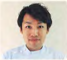
福祉村病院 ● 理学療法士