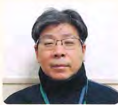
珠藻荘 ● 副施設長