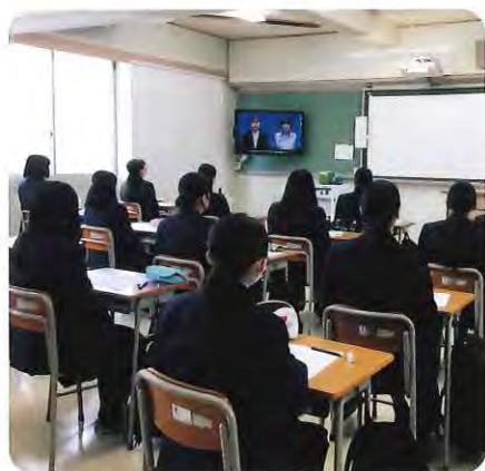
▲今年各教室で受講