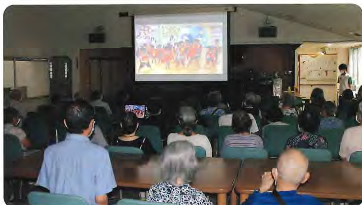
▲ビデオレターは大好評でした

九月には保育園で歌と踊りの映像を撮影して若菜荘の敬老祝賀会でプロジェクターの大画面で上映し、子どもたちの一生懸命な姿に元気をもらったと大変喜ばれました。