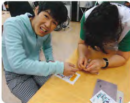
▲年賀状作成の様子

可愛いイラストで自分の気持ちを表現されるなど新たな気つきもありました。手紙を書いた方の気持ちをご家族に伝わっていると思います。