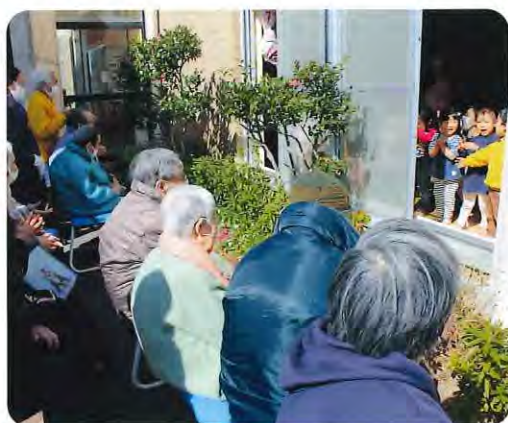
▲散歩の行事で保育園に立ち寄ることもあります

また、特別な取り組みではなくても園児の元気な姿を見られるように、日時を合わせて散歩の途中で福祉村保育園に立ち寄り、窓越しに子供たちの元気な歌声を聞く機会を設けたところ、普段は転倒が心配だと言いつ屋外に出ない方も参加されるなど、大変喜ばれております。