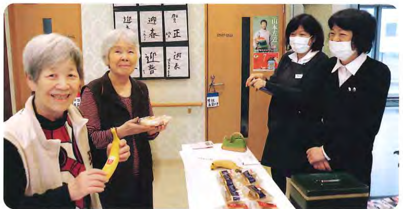
▲グループホームフジ