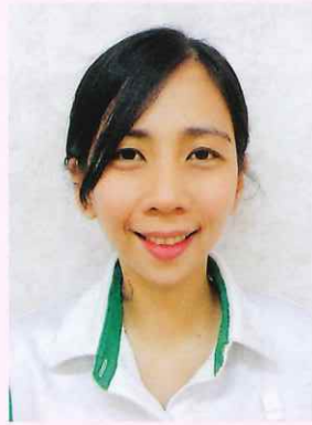
さわらび荘 トラヘコ クリス アン コープス