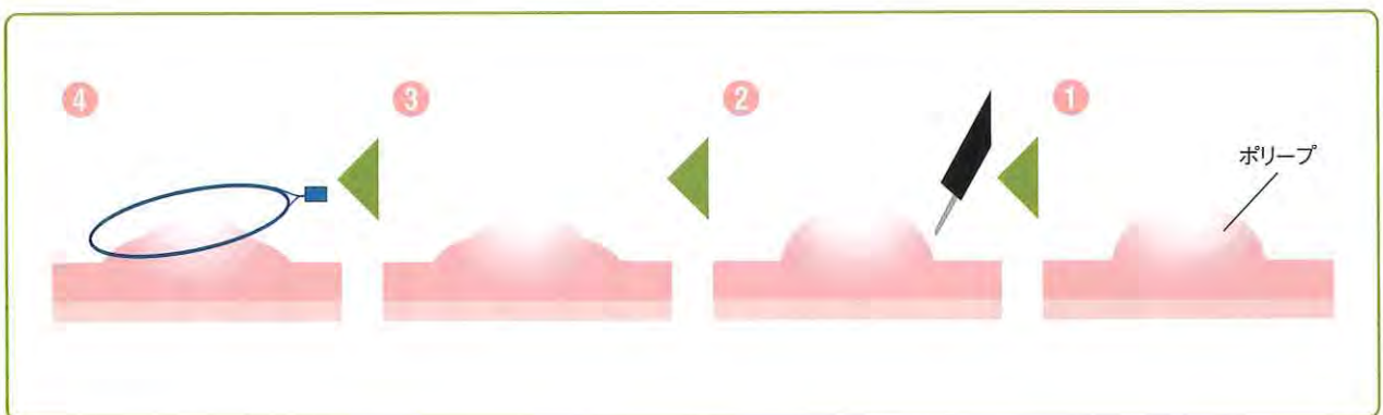
(図)ポリープの切除

このことからやはり、定期的に健診を受けることが大事だと言えます。みなさんにも定期的な大腸癌健診を受けることをお勧めします。