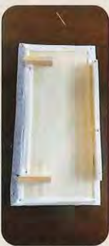
滑り落ちないように裏面にはストッパーを取り付けています。