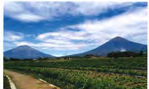
スンビン・シンドロ山 (Gunung Sumbing,Sindoro)

十月頃まで栽培しています。テマングン市は私にとって自然が美しいところだと思いません。皆様インドネシアに行く機会がありましたらぜひテマングン市に来ていただく嬉し