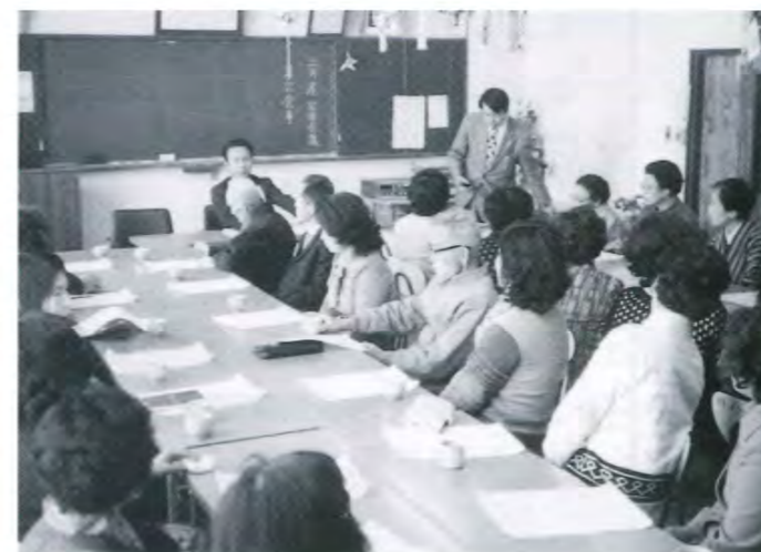
▲家族会議はご家族と病院を結ぶ大切なパイプ役

1980年2月に医療法人早蕨会の認可を受け、お年寄りや障がい者の自立を促進するための重要な施設として福祉村に設立しました。