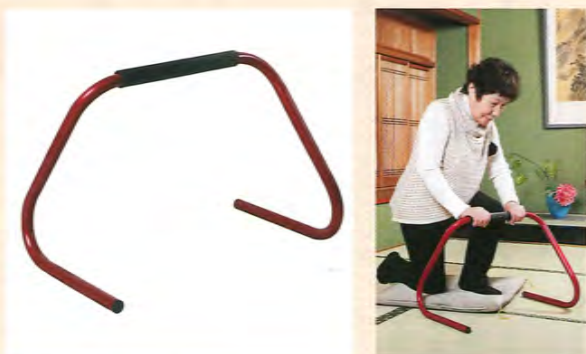
販売価格:17,380円(税込) ※介護保険レンタル対象品です。