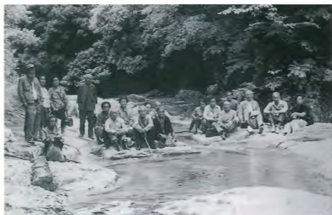
▲老人大学の野外講座

歳を取ると趣味や楽しめるものは一人ひとりはっきりと違ってきます。そこで、毎日午後2時から老人学校と称して患者様に会議室へ集まっていただき、医師や職員による授業を始めました。内容は、名曲鑑賞、小説や詩の朗読、英会話などさまざま、宗教講話や詩吟等もボランティアの先生にお願いして授業を開き、患者様はそれぞれ好きなクラスを受けられるようにしました。また、寝たきりなど、会議室での授業に出席できない患者様のためにクラスの模様を院内放送で流したりもしていました。その後、市内外の学識経験者に大学レベルの講義をしていただく「老人大学」となり、現在はますます内容を充実した「さわらび大学」となって多くの方々にご参加いただいています。