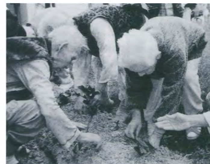
▲畑仕事(院外リハビリ)