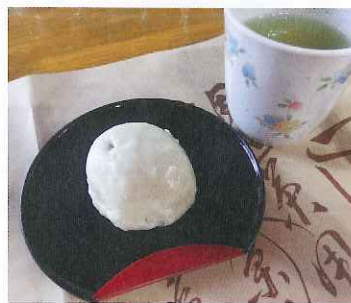
瀬戸川まんじゅう