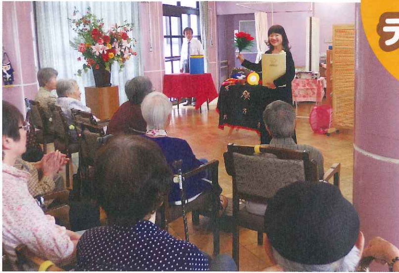
ハピースマイルさんによるマジックショー