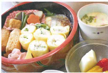
創立記念特別御膳

午前中は昔懐かしの暮らしをテーマ に回想し、午後にはボランティアの ハピースマイルさんによるマジック ショーで大盛り上がりでした。