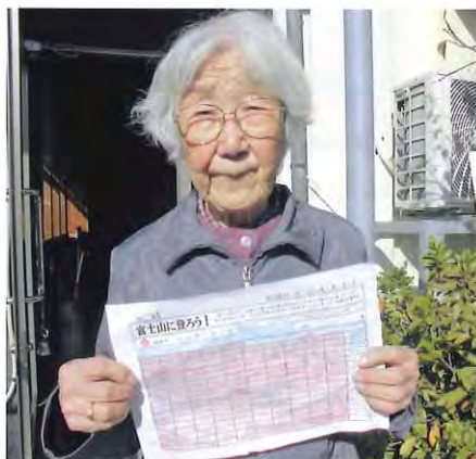
一番歩かれているご利用者さん、登頂記念撮影

そこで思いついたのが「富士山に登ろう」計画です。実際に富士山に登ることはできませんが、登ったつもりになって歩きましょうという計画です。その日の体調をチェックして、職員の付き添いのもと全員の方が取り組まれています。現在、一番歩かれている方は、376.2km、富士山登頂を11回達成されたこととなります。