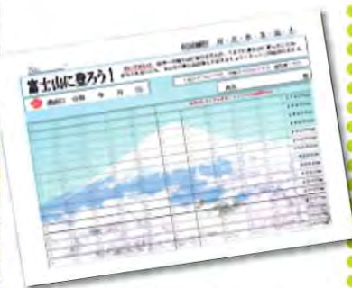
「富士山に登ろう！」 励み表

ふたば庵では、歩行能力の維持・向上を目指して、より実践的な歩行機能訓練として毎朝ウォーキングに取り組んでいます。 歩行は、私たちの生活の中で「トイレに行く」「買い物に行く」等なくてはならない重要な能力です。歩行能力は高齢者にとって単なる移動手段ではなく、自分らしくいきいきとした生活を送るうえで大きな意味を持ちます。また歩行は、全身諸臓器に良い影響を与え、免疫力アップ、血流が良くなる等の様々な健康効果があるといわれています。 朝の爽やかな空気の中で、外気浴も兼ねて行うウォーキングは、何よりも実践的な転倒予防訓練となり、歩くこと、生きることへの自信に繋がると私たちは考えています。