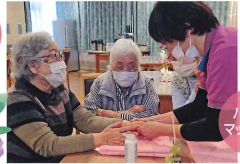
ハンドマッサージ