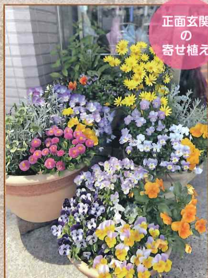
正面玄関 の 寄せ植え