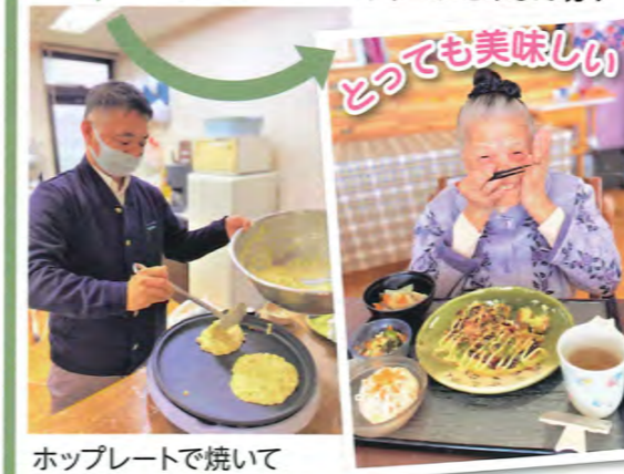
ホッププレートで焼いて