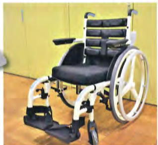
トランスファーボード

車イス「ワイリー」を6台購入しました。「ワイリー」は防水性クッションと トランスファーボード を標準装備し、職員も利用者様にもストレスなく使用できる優れた車イスです。 そして清拭が簡単なホイールで、感染対策にも適しています。