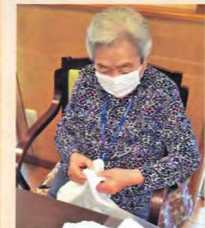
雑巾作りに取り組まれるご利用者

と継続して行きたいと考えています。 ご協力いただきました利用者の皆様には、心から感謝申し上げます。