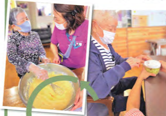
粉を混ぜて キャベツをみじん切り

みじん切り器を活用して、楽しく安全に調理しました。 ふつくらアツアツのお好み焼きは大好評でした。