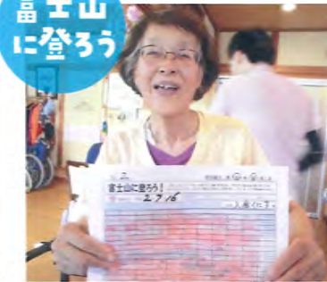
「富士山に登ろう」励み表