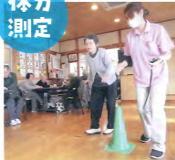
体力測定結果のお知らせ