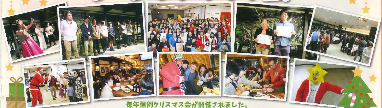
毎年恒例クリスマス会が開催されました。

おいしい食事と豪華な景品が揃ったビンゴ大会でスタッフ一同の労を労いました。 萩原地区のクリスマス会には、来年入社する内定者も参加し、一層盛り上がりました。