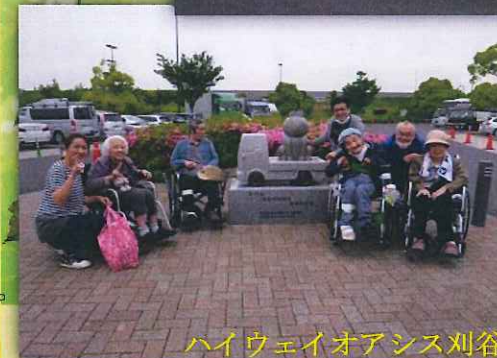
ハイウェイオアシス刈谷