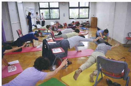
※お申し込みは、終了しました。

65歳からの運動・栄養教室 九月七日(木)、介護予防を目的とした一般高齢者向けの運動・栄養教室を開催しました。 教室は、全六回で、65歳以上の方に起こりやすい、高血圧、認知症、腰痛、肩こり、便秘などの疾患、症状に合わせた予防トレーニングと栄養教室を行います。 初回のこの日は、15名の方が参加され「転びにくいカラダ作りトレーニング」「教えて！骨粗鬆症予防のための食事」と題して行いました。