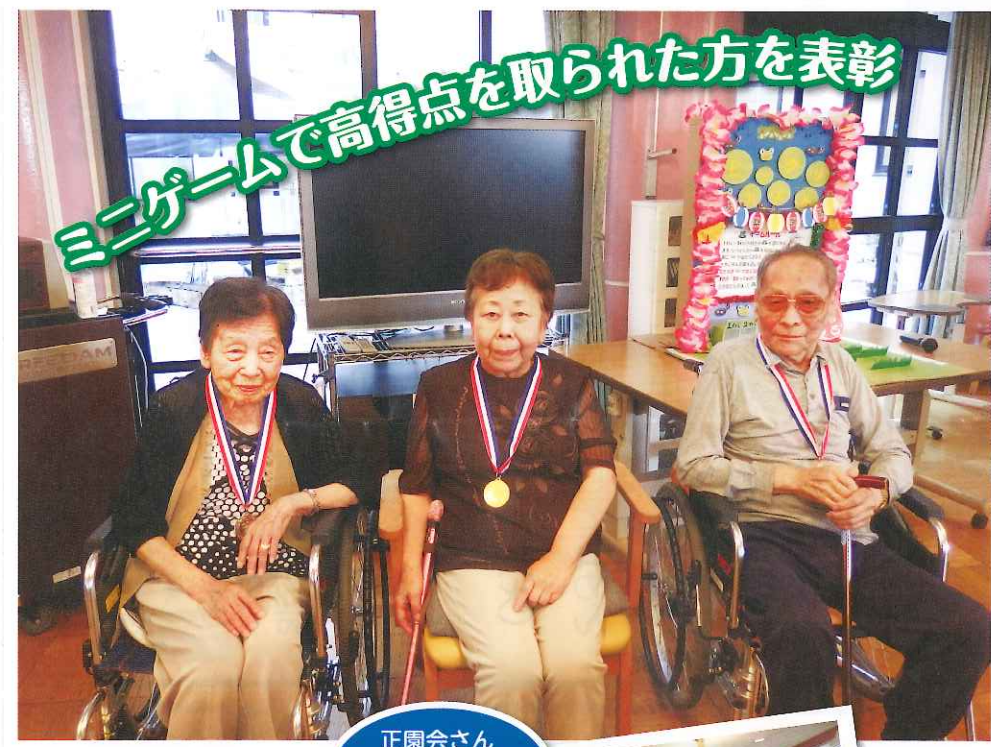
ミニゲームで高得点を取られた方を表彰

65歳からの運動・栄養教室 九月七日(木)、介護予防を目的とした一般高齢者向けの運動・栄養教室を開催しました。 教室は、全六回で、65歳以上の方に起こりやすい、高血圧、認知症、腰痛、肩こり、便秘などの疾患、症状に合わせた予防トレーニングと栄養教室を行います。 初回のこの日は、15名の方が参加され「転びにくいカラダ作りトレーニング」「教えて！骨粗鬆症予防のための食事」と題して行いました。