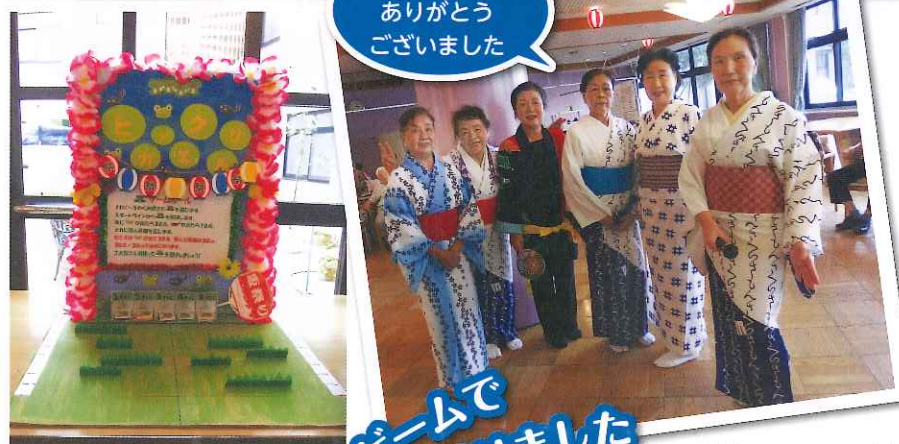
ミニゲームで盛り上がりました